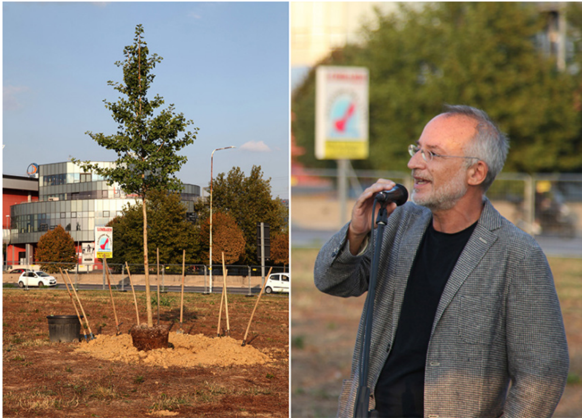
Arte per la riforestazione. Stefano Mancuso.

Le parole di Mancuso richiamano inevitabilmente alla mente il progetto 7000 Eichen di Joseph Beuys che nel 1982, per la manifestazione artistica documenta 7 , propose la piantumazione di 7000 querce. Un progetto di riforestazione urbana concepito dall'artista come «scultura sociale», che ha coinvolto l'intera città di Kassel. Il progetto nacque in seno al programma ecologico e al tempo stesso antropologico della Free International University for Creativity and Interdisciplinary Research (FIU) fondata nel febbraio 1974. Sono gli anni in cui si sviluppò una sensibilità verso l'ambiente coniugata all'utopia della terza via , alternativa sia al sistema fondato sul capitalismo privato, sia a quello fondato sul capitalismo di stato. Anni in cui gli artisti mettevano la loro arte al servizio dell'impegno civile. Nel 1973 Gianfranco Baruchello fondò Agricola Cornelia S.p.A. allo scopo di conciliare l'arte con l'agricoltura e la zootecnia, un progetto nel quale l'arte era allo stesso tempo azione economica, politica e poetica.