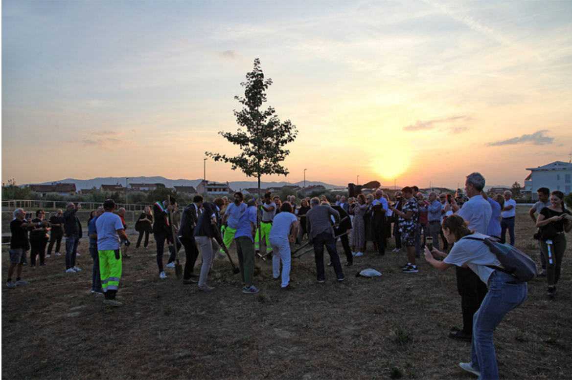
Arte per la riforestazione. Messa a dimora del Ginkgo biloba .

pubblici e sotto l'ipoteca dei Comuni», in altri termini si diede licenza al sacco del territorio da parte degli speculatori. Antonio Cederna comprese la necessità di restituire il patrimonio e il paesaggio alla rigenerazione sociale. Le sue epiche battaglie s'inserirono in una mutazione che negli anni della ripresa economica e della ricostruzione diede luogo ad una estensione semantica al concetto di patrimonio e paesaggio includendovi «qualsiasi esito del rapporto tra uomo e natura, individuo e società».