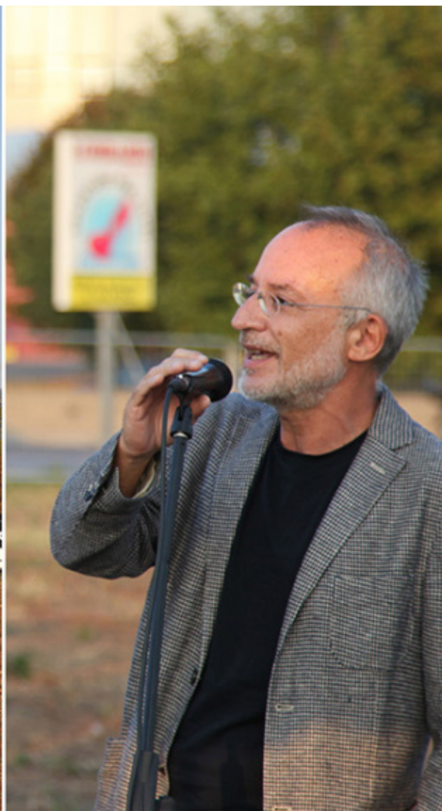
Arte per la riforestazione. Stefano Mancuso.

Le parole di Mancuso richiamano inevitabilmente alla mente il progetto 7000 Eichen di Joseph Beuys che nel 1982, per la manifestazione artistica documenta 7 , propose la piantumazione di 7000 querce. Un progetto di riforestazione urbana concepito dall'artista come «scultura sociale», che ha coinvolto l'intera città di Kassel. Il progetto nacque in seno al programma ecologico e al tempo stesso antropologico della Free International University for Creativity and Interdisciplinary Research (FIU) fondata nel febbraio 1974. Sono gli anni in cui si sviluppò una sensibilità verso l'ambiente coniugata all'utopia della terza via , alternativa sia al sistema fondato sul capitalismo privato, sia a quello fondato sul capitalismo di stato. Anni in cui gli artisti mettevano la loro arte al servizio dell'impegno civile. Nel 1973 Gianfranco Baruchello fondò Agricola Cornelia S.p.A. allo scopo di conciliare l'arte con l'agricoltura e la zootecnia, un progetto nel quale l'arte era allo stesso tempo azione economica, politica e poetica.