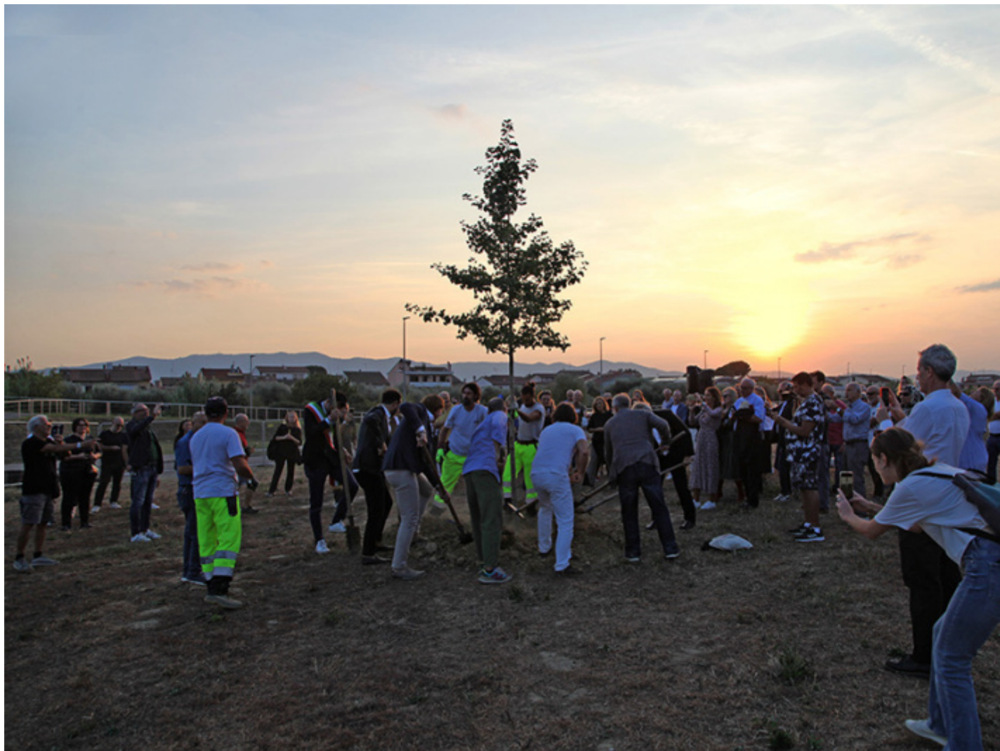
Arte per la riforestazione. Messa a dimora del Ginkgo biloba.

s'inserirono in una mutazione che negli anni della ripresa economica e della ricostruzione diede luogo ad una estensione semantica al concetto di patrimonio e paesaggio includendovi «qualsiasi esito del rapporto tra uomo e natura, individuo e società».