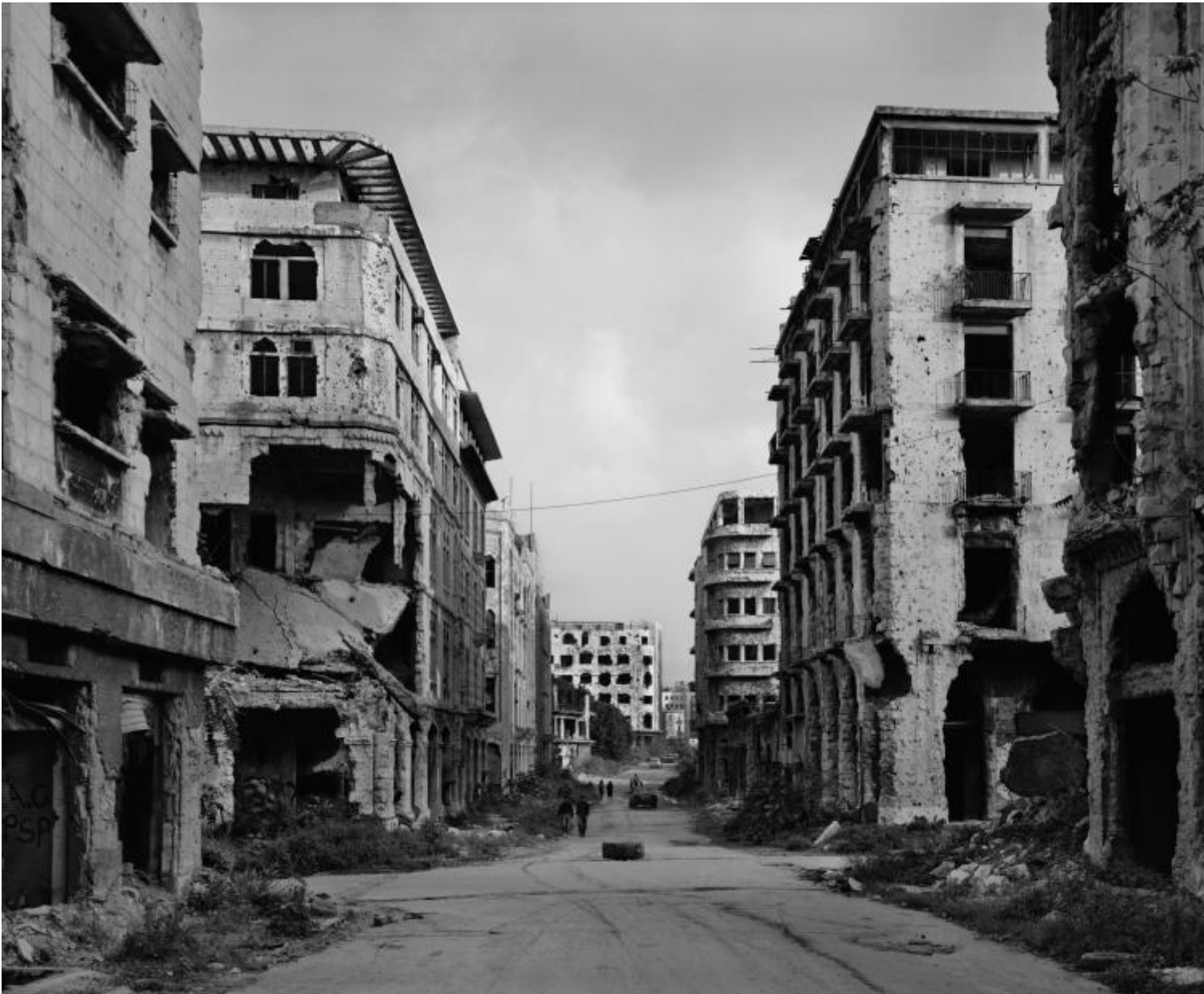
Beirut 1991.