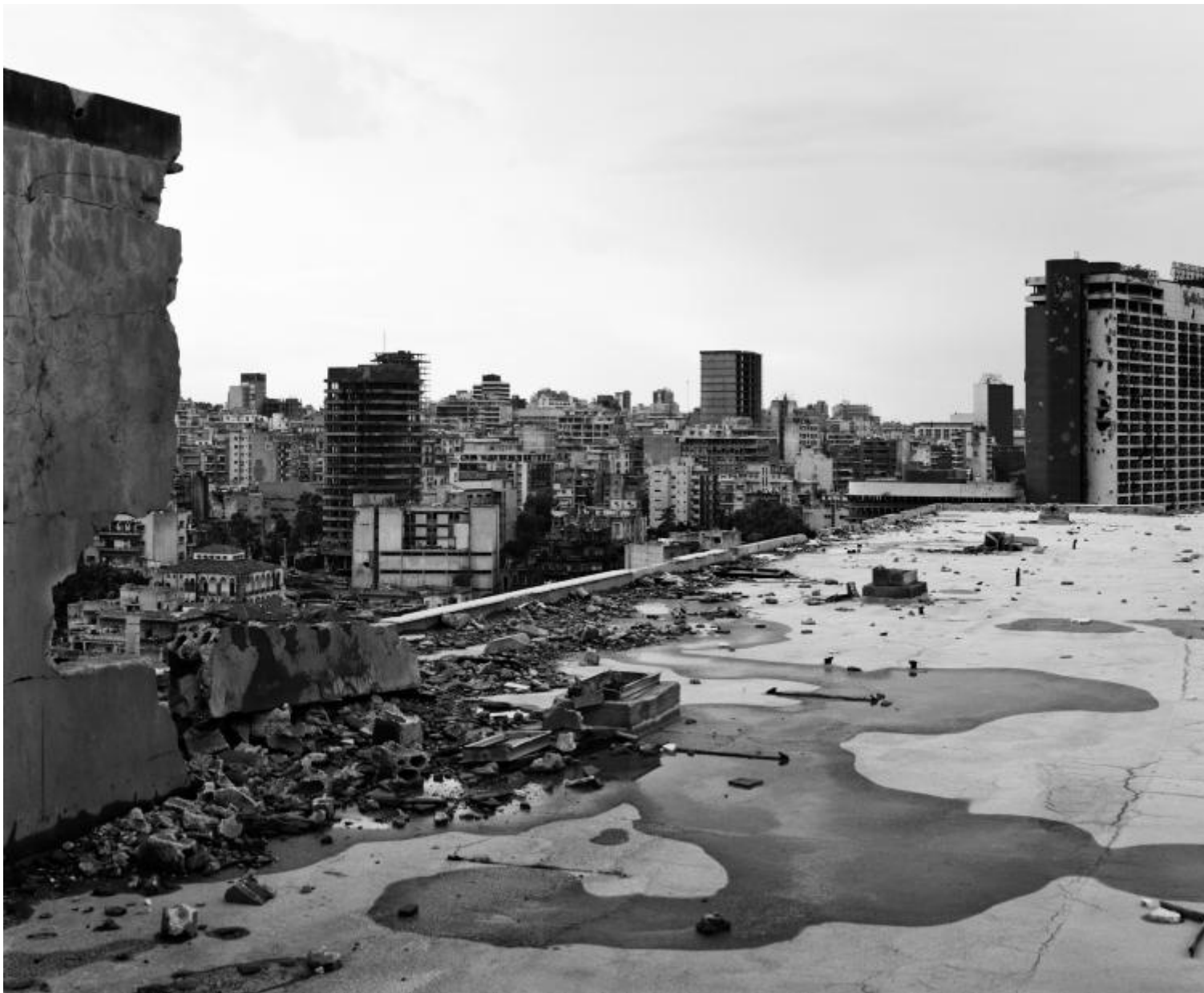
Beirut 1991.

La distruzione porta via con sé parti numerose di ciò che prima era stato intero: provoca, in altri termini, l'eliminazione da un paesaggio originario di quelle porzioni necessarie per completarlo, conducendolo a una sintesi bestiale della propria anatomia. A metà del XIX secolo, John Ruskin – pittore e scrittore britannico, nonché grande studioso di architettura – rappresentava la selezione naturale operata dalle rovine degli edifici storici in carte dipinte con tecniche miste facendo celare dal bianco stesso della carta tutto il resto del paesaggio che rovina non era – il mare, la terra, tutti gli altri edifici che le circondavano; a Beirut, dove tutto è rovina di fronte agli occhi di Basilico, niente va cancellato più di quanto il conflitto abbia fatto, e va fatto emergere tutto ciò che fin lì è riuscito a sopravvivere: questa la scelta, pare, di fronte al compito di rappresentarla.