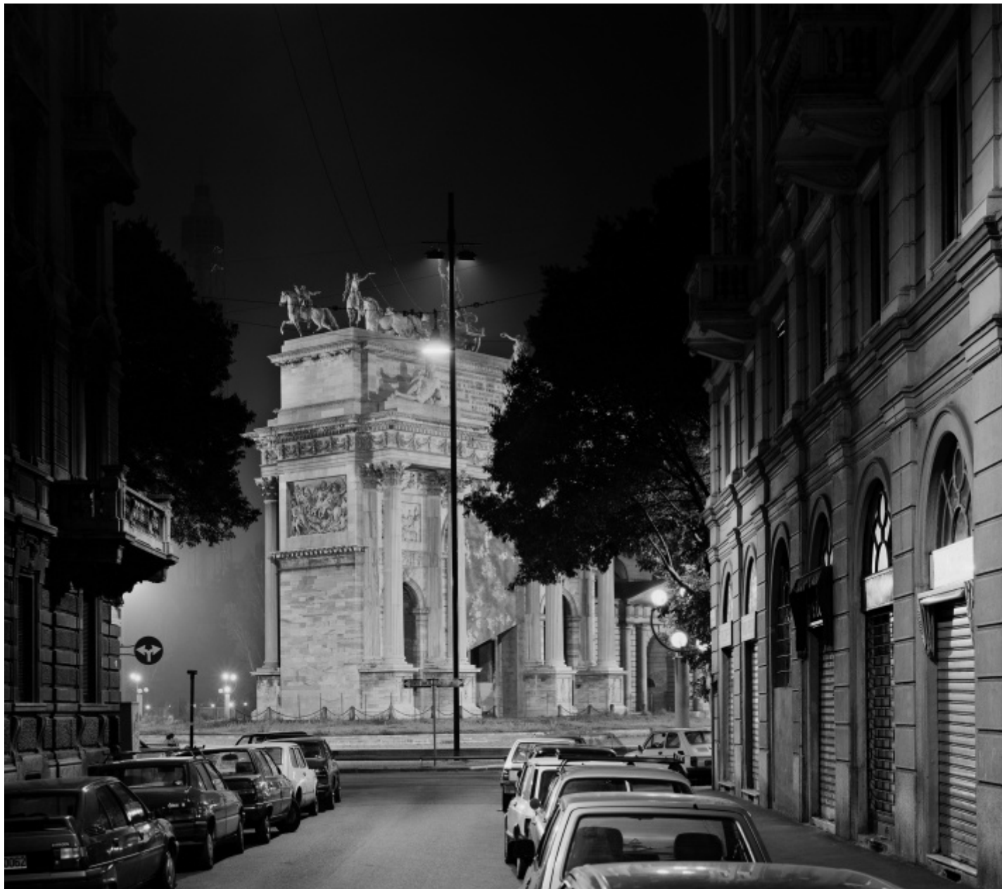
Gabriele Basilico, Milano 1989, Foto di Gabriele Basilico/Archivio Gabriele Basilico.

Con umiltà confessava :«Mi piace pensare di aver imparato, in quanto fotografo, a mettermi da parte, rinunciando a una rappresentazione troppo soggettiva e spesso artificiosa in favore di una riproduzione apparentemente oggettiva della realtà e caratterizzata da un grande rispetto verso le cose». Il suo era un mettersi da parte anti-narcisistico, per dare maggiore voce ai luoghi che aveva di fronte: abbassava la propria voce in modo da comprendere meglio la storia di un dato tessuto urbano, fino a coglierne il segreto genius loci . Un approccio, questo, che però non implicava un'assenza di coinvolgimento, anzi. Nel 1994, quando lo intervistai per l'Unità, mi raccontò che dopo l'importante esperienza della Mission Photographique de la Datar (per la quale aveva documentato le coste del nord della Francia su incarico del governo) «mi sono sentito sempre più avvolto dai luoghi, nutrito da essi, come dilatato fisicamente, tanto che la fotografia si è trasformata in un esercizio spirituale, dove riscoprire l'importanza della contemplazione e della lentezza dello sguardo». Nel caso di quella particolare ricerca (poi confluita nel libro Bord de Mer ) il suo sguardo faceva in effetti emergere un nuovo «bisogno di scorrevolezza verso l'infinito (...) è come se fossi passato da un meccanismo prospettico rinascimentale al vedutismo fiammingo, dove il paesaggio è dilatato, naturalistico».