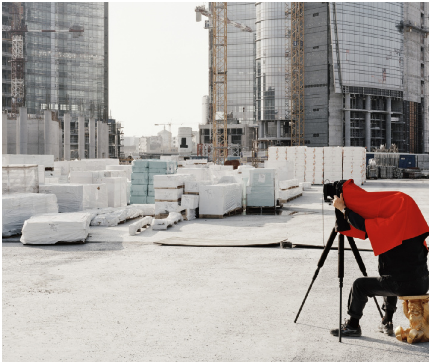
Gabriele Basilico, Autoritratto/Self portrait, 2011

Piccola nota a margine: allontanati da piazza Missori, i valdesi ottennero come risarcimento dal Comune un terreno in via Francesco Sforza, dove erigere il loro nuovo tempio. L'antica facciata della chiesa di San Giovanni in Conca venne allora smontata pezzo dopo pezzo, recuperata e ricostruita così com'era prima, ma nella nuova sede. E infatti la si può ammirare ancora adesso, come ingresso principale del tempio valdese di via Sforza, inaugurato nel 1952. Mentre il resto dell'abside e la splendida cripta romanica sono ancora in piazza Missori. All'insegna di "miracoli a Milano" abbiamo da allora una chiesa sdoppiata, con una cripta da una parte e una facciata dall'altra!