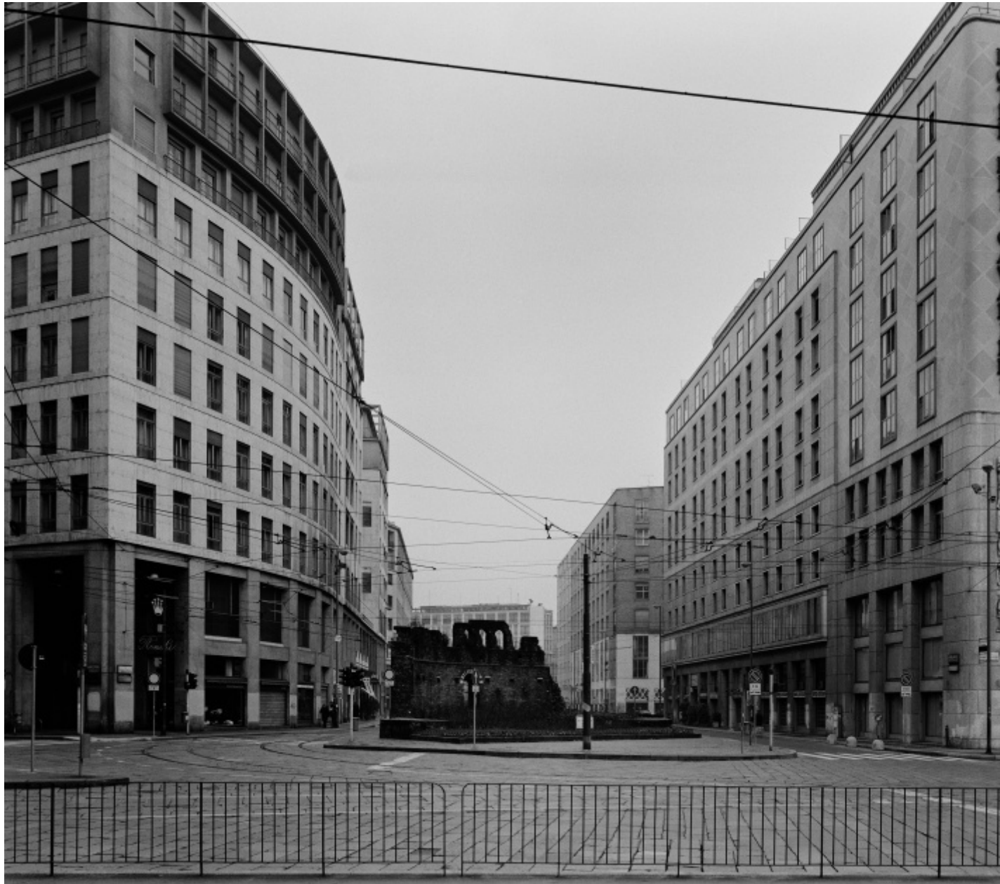
Gabriele Basilico, Milano 1996

Torniamo allora a questo suo bisogno di «cogliere i messaggi della città» e cerchiamo di leggere una sua celebre immagine di Milano, appartenente alla serie La città interrotta , per comprendere meglio come Gabriele Basilico riuscisse in una singola fotografia a condensare magicamente la storia di un luogo, attraverso un approccio essenziale, asciutto, che offriva precise tracce interpretative. Si tratta di una fotografia di piazza Missori, vista frontalmente, guardando verso via Albricci: un ampio stradone che si riduce dopo poco in due stretti vicoli contornanti il rudere smangiato di quella che un tempo era stata la grande chiesa romanica di San Giovanni in Conca. Ai due lati degli umili e tristi resti di questa storica chiesa (di cui ora sopravvivono solo la cripta e parti dell'abside) si ergono in posizione eminente due imponenti edifici della fine degli anni '40, simili a due giganteschi generali saldamente ancorati al terreno, ma protesi verso un'avanzata che... non riescono a compiere e in effetti non compiranno mai. Con un tocco da maestro, infatti, tutto il primo piano di questa fotografia risulta genialmente occupato da un leggero sbarramento a transenna che indica l'impossibilità di ulteriori conquiste: qualcosa come un'esile ringhiera che avrebbe potuta essere spazzata via quasi in un soffio. Se non fosse che tutto però si è davvero interrotto lì, lungo la linea invalicabile di tale sottile transenna.