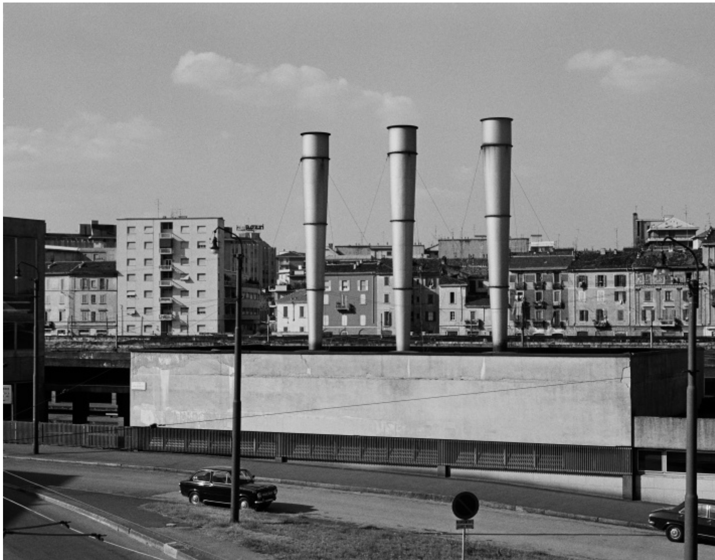
Gabriele Basilico, Milano 1978-80, Foto di Gabriele Basilico/Archivio Gabriele Basilico.