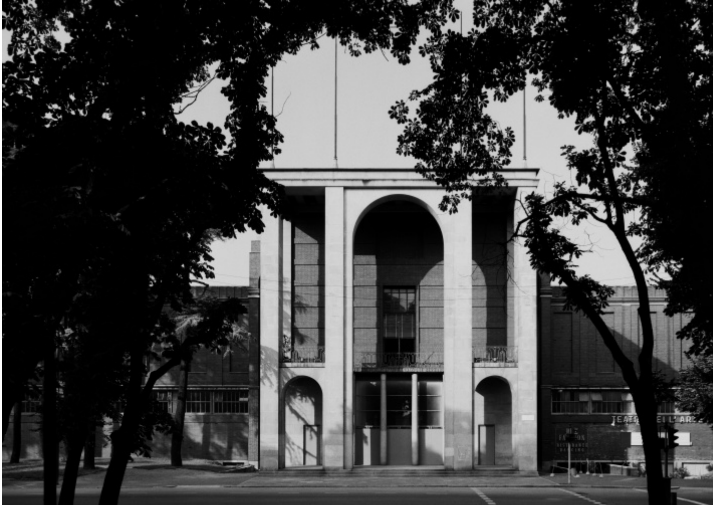
Gabriele Basilico, Milano 1980, Foto di Gabriele Basilico/Archivio Gabriele Basilico.

capire senza giudicare. «Penso che nella mia fotografia non ci sia un giudizio sulla qualità dell'architettura. Alla fine non è troppo importante se una città è bella o brutta, se l'architettura è di qualità o mediocre, m'interessa la convivenza, lo scenario esistenziale degli esseri umani» – raccontava Basilico in un'intervista raccolta da Roberta Valtorta (curatrice e storica della fotografia che ha da sempre seguito il suo lavoro) e poi riportata in: Gabriele Basilico. Scritti e conversazioni sulla fotografia 1970-2012 , a cura di Roberta Valtorta (Dario Cimorelli Editore, Milano, 2023, pp.440), un libro appena uscito, in felice coincidenza con la doppia mostra di cui stiamo parlando.