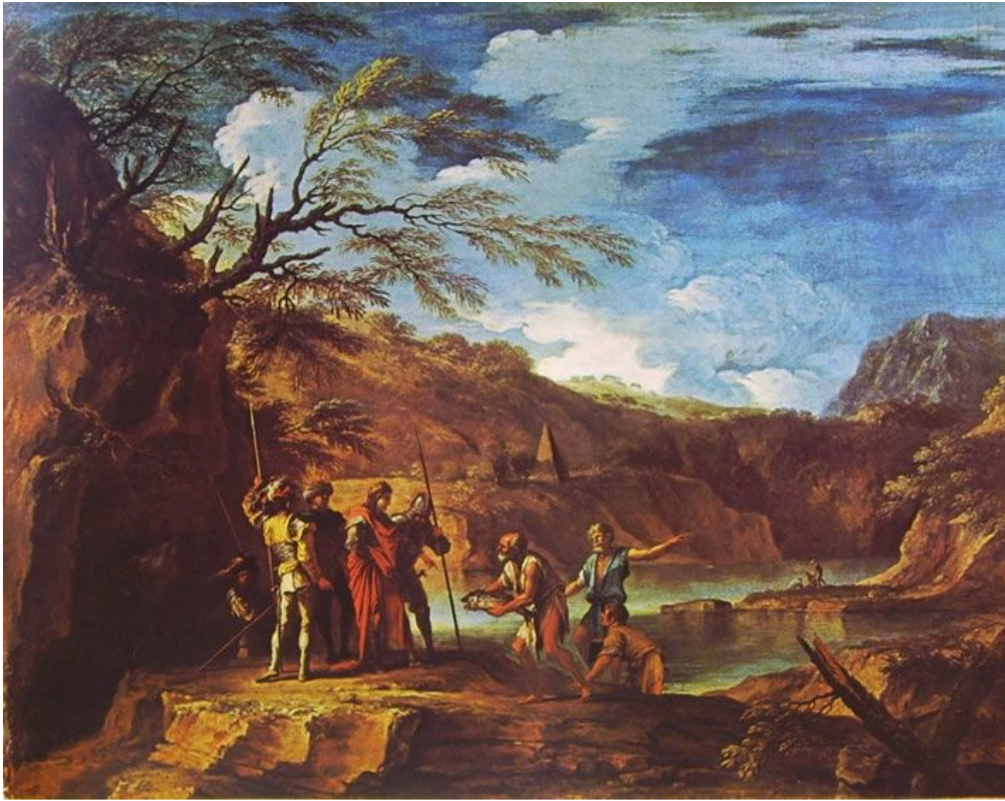
Arche Diem - L' ANELLO DI POLICRATE Erodoto, Storie III, 39-43.

D'altra parte niente di minor levatura di un qualche abitante dei cieli può prendersi cura in modo così minuzioso, ferocemente mirato, di noi, del nostro corpo e delle nostre faccende sentimentali e finanziarie, che una certa importanza ce l'hanno, quanto meno ai nostri occhi. A volte è davvero troppo per andare a cercare altri responsabili più peregrini. Al massimo sono solo stupidissimi strumenti.