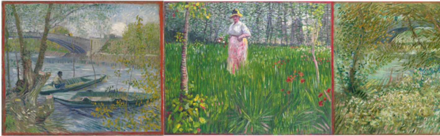
Vincent van Gogh, Il trittico di Clichy , 1887: Pescare in primavera, il Ponte di Clichy , (Asnières), Art Institute of Chicago; Donna che passeggia in un giardino , Collezione privata; Riva del fiume in primavera , Dallas Museum of Art.