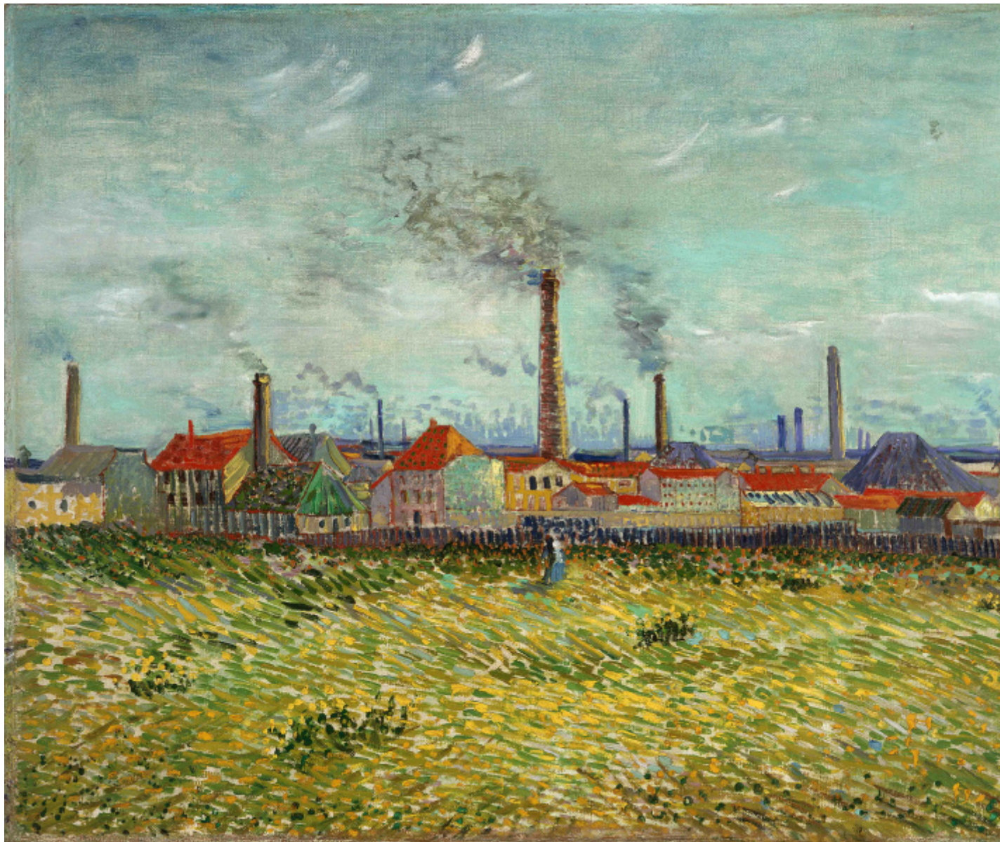
Vincent van Gogh, Fabbriche a Clichy , 1887, Saint Louis Art Museum, Missouri.

E poi i ponti, i treni, le gru per il carbone...le rive con i bagnanti – i lavoratori di questa nuova periferia che si concedono una giornata di riposo all’aperto, ritratti da Seurat nell’impressionante bozzetto a olio su tavola, o ‘ croqueton ’, per I bagnanti di Asnières . Impressionante perché questi croquetons (in mostra ne vediamo cinque) sono molto piccoli, eppure c’è già tutto in quei 15 centimetri per 25 che diventeranno due metri per tre nell’ opera finale , (rifiutata al Salon del 1884). Sembra di sbirciare il pittore mentre è lì, concentrato a dipingere qualcosa di intimo, un’istantanea di quel paesaggio un poco melanconico, le figure tutte isolate, sullo sfondo l’industrializzata Clichy. Bellissimo il contrasto di soggetto con lo Studio finale per La Grande Jatte , della stessa misura, iniziato subito dopo, nel 1884 – uno spaccato di una domenica borghese, che nel celebre dipinto finale vede anche una scimmietta al guinzaglio (esposto all’ottava mostra impressionista del 1886). Seurat in questi piccoli studi non adotta ancora la tecnica pointilliste , ma i contrasti puri di colore sono studiati con grande attenzione.