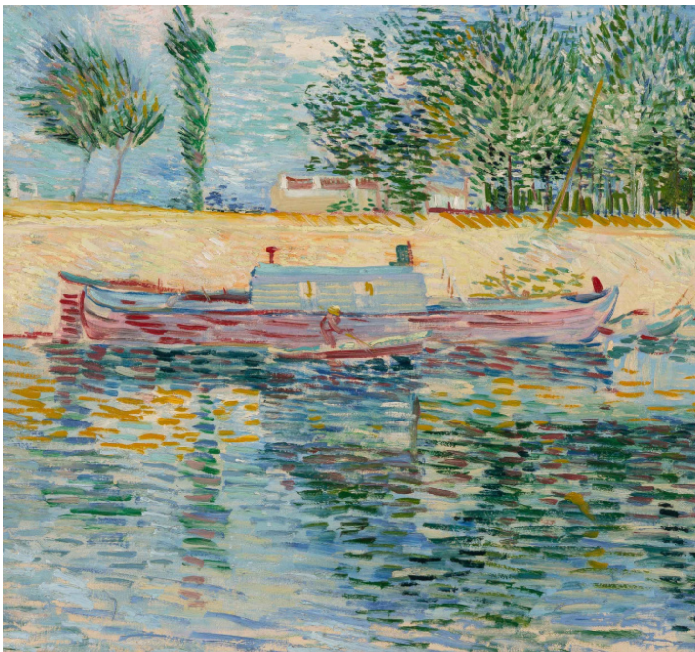
Vincent van Gogh, Riva della Senna con barche , 1887, collezione privata.

“Dipingevamo sulle rive del fiume, pranzavamo a la guinguette , e tornavamo a Parigi a piedi, da Saint-Ouen e Clichy. Van Gogh indossava una giacca blu da zincatore, e si era dipinto dei puntini di colore sulle maniche”, ricorderà anni dopo Paul Signac. Non è difficile immaginare quelle maniche... cosparse di colori contrastanti.