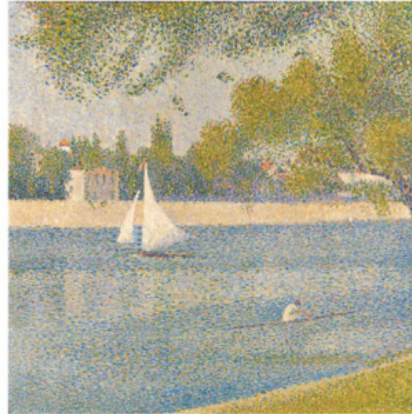
Da sinistra: Charles Angrand, La Senna a Courbevoie: La Grande Jatte , 1888, collezione privata; Georges Seurat, La Senna a La Grande Jatte , 1888, Royal Museum of Fine Arts, Bruxelles.

Quello che sorprende è che, anche se le sperimentazioni di questi artisti portarono a esiti molto diversi, ci sono alcune opere che, viste accanto, potrebbero essere dell'uno o dell'altro, il che dimostra che la divisione dei colori sulla tela fu un passaggio quasi 'obbligato' per tutti loro. Van Gogh esplora un po' tutto, ma non si accoda a nessuno. In alcune opere adotta elementi puntinisti, in altre pennellate impressioniste, in altre ancora costruisce l'opera con tasselli di colore puro, come nella vivacissima Riva della Senna con Barche (sopra, non esposta al pubblico dal 1984).