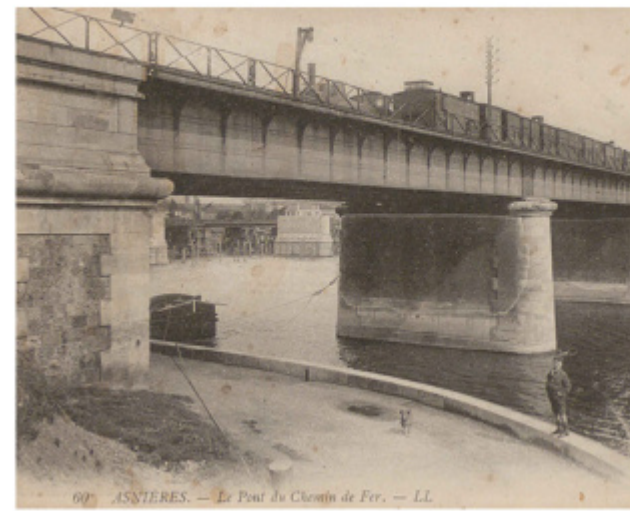
Vincent van Gogh, Ponti sulla Senna ad Asnières , 1887, Emil Bührle Collection, Kunsthau, Zurigo; Asnières, Pont du Chemin de Fer , cartolina, c. 1905.

Seurat è il primo a dipingere nella zona nel 1881, Signac nel 1882, seguito da Bernard e Angrand nel 1884-85, e da ultimo Van Gogh nel 1887. Cosa accomuna questi cinque artisti, personalità tanto diverse? La necessità di una nuova pittura. Di una rivoluzione nell'affrontare le pennellate e il colore, con nuovi esperimenti, dettati anche dalle ricerche sulle leggi cromatiche di Michel Chevreul, Ogden Rood, e Charles Blanc. Questo era uno dei modi con cui la nuova generazione intendeva superare l'eredità dell'impressionismo. Il fermento era grande. Gli stimoli offerti dalla nuova periferia urbana, con le sue contraddizioni, diventano le zone da scandagliare. Non si tratta dei luoghi idilliaci cari a Monet e Renoir, come Argenteuil e Chatou, più lontani da Parigi, ma di un nuovo vocabolario visivo, a un'ora a piedi dalla metropoli. Da un lato l'incanto della Grande Jatte, dall'altro il profilo delle ciminiere fumanti.