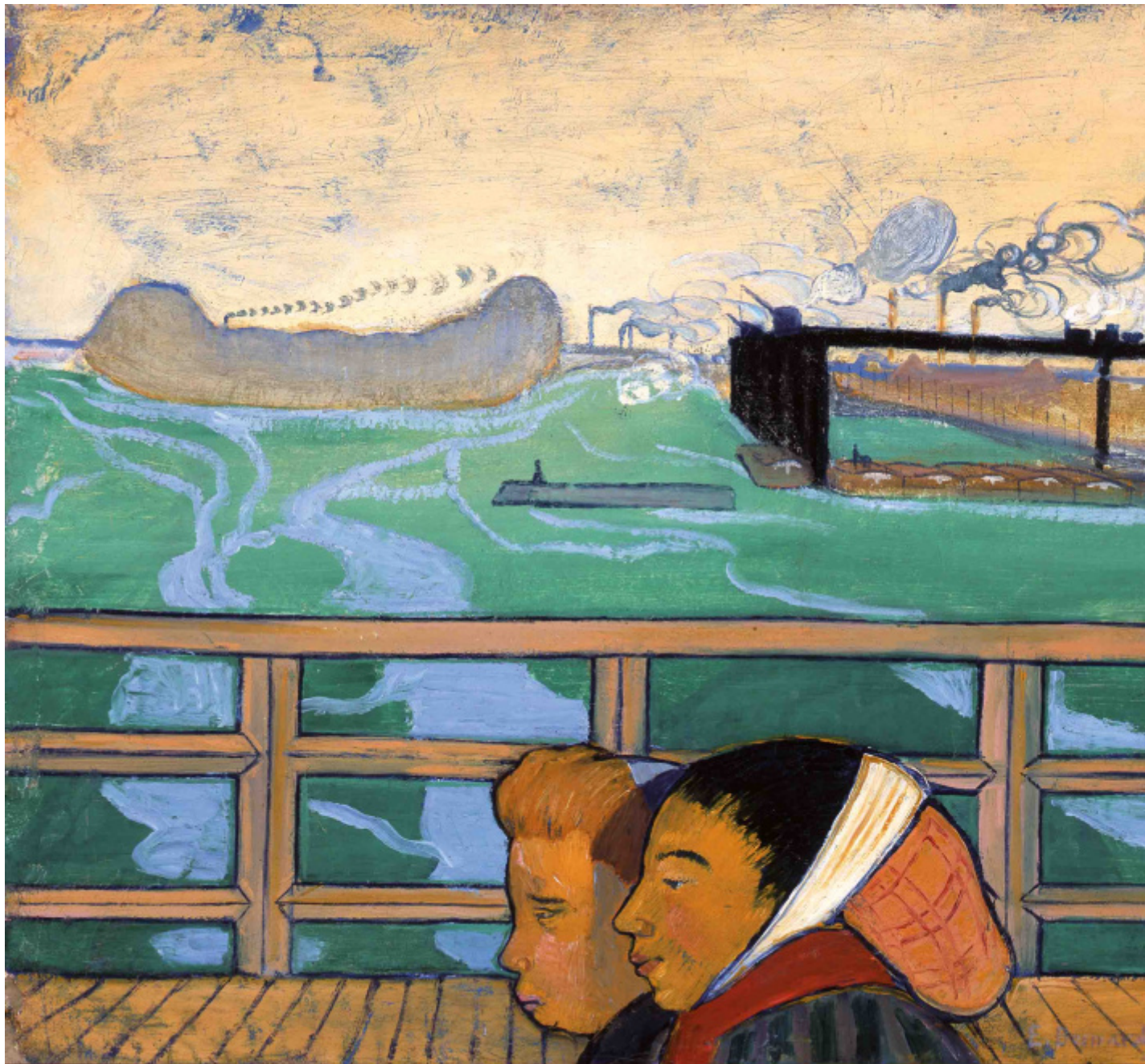
Émile Bernard, Due donne sul ponte pedonale di Asnières , 1887, Musée des Beaux-Arts, Brest métropole.