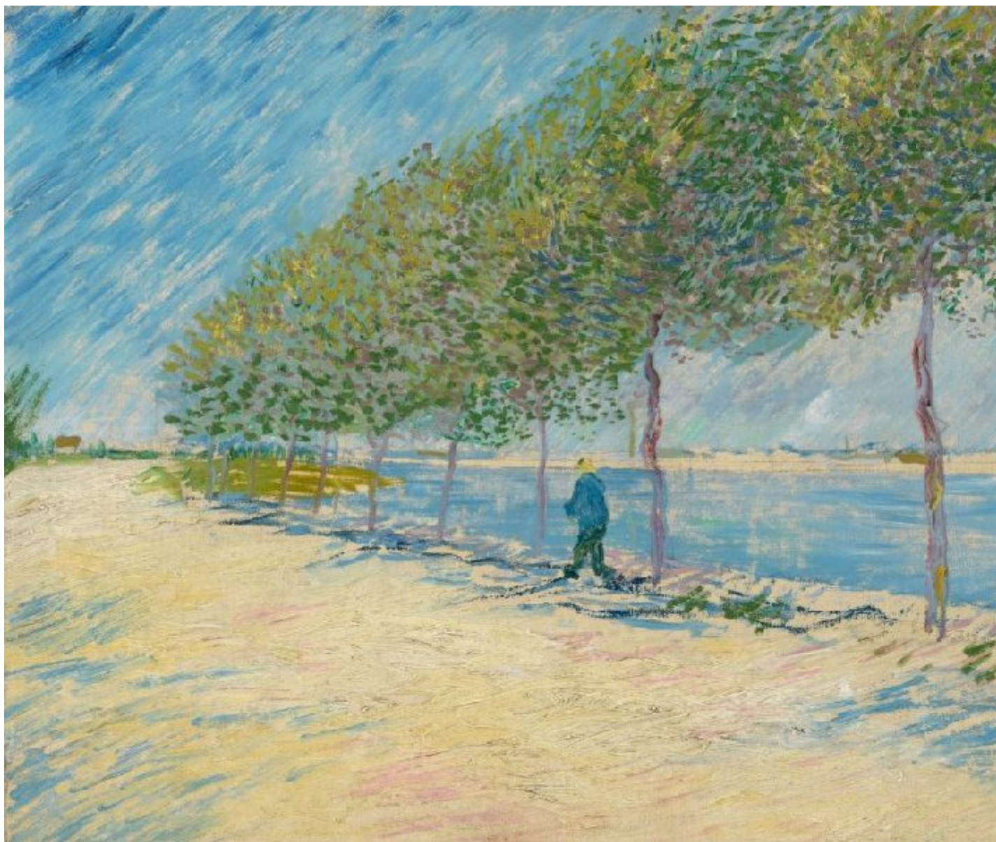
Vincent van Gogh, Lungo la Senna , 1887, Amsterdam, Van Gogh Museum (Vincent van Gogh Foundation).

paesaggi ad Asnières, ci vedevo più colore che in passato. Ora studio questo sui ritratti”.