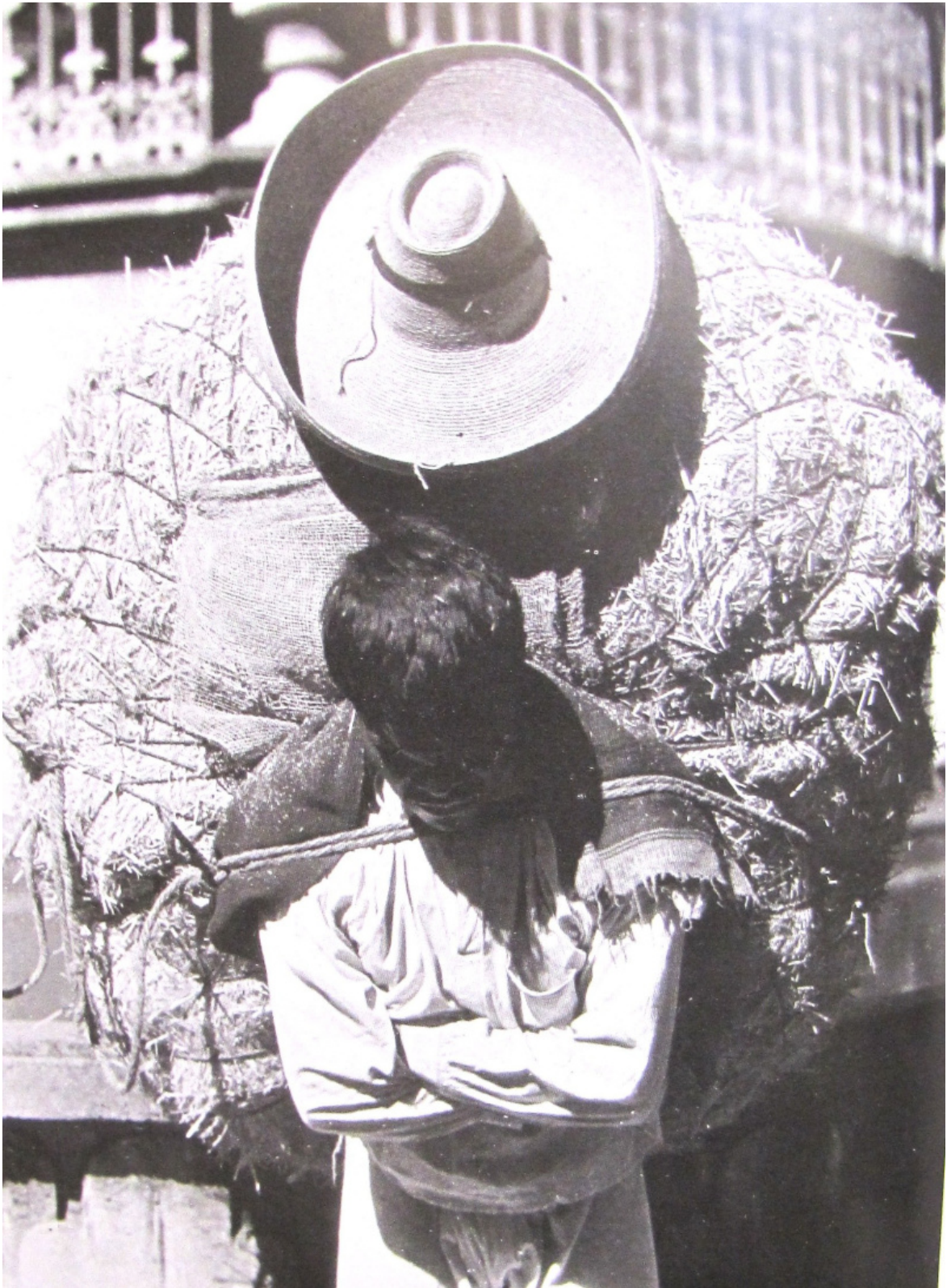
Uomo che porta fieno, Messico, 1927-1929.

Mani segnate, piedi luridi, gente distesa sulla strada: per Tina il corpo è denuncia politica. Un grido, le sette bare allineate di campesinos uccisi dai reazionari. Dietro, le famiglie sono una barricata. Tengono la posa di un ritratto di gruppo, guardano in camera e accettano di sospendere il dolore per il tempo dello scatto, perché la foto testimonierà l'ingiustizia di cui sono stati vittime i loro familiari.