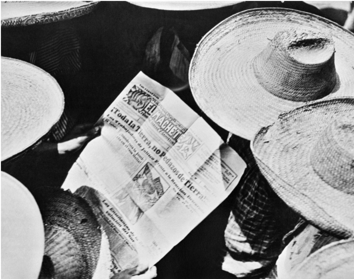
Campeſinos che leggono El Machete, Messico 1929.