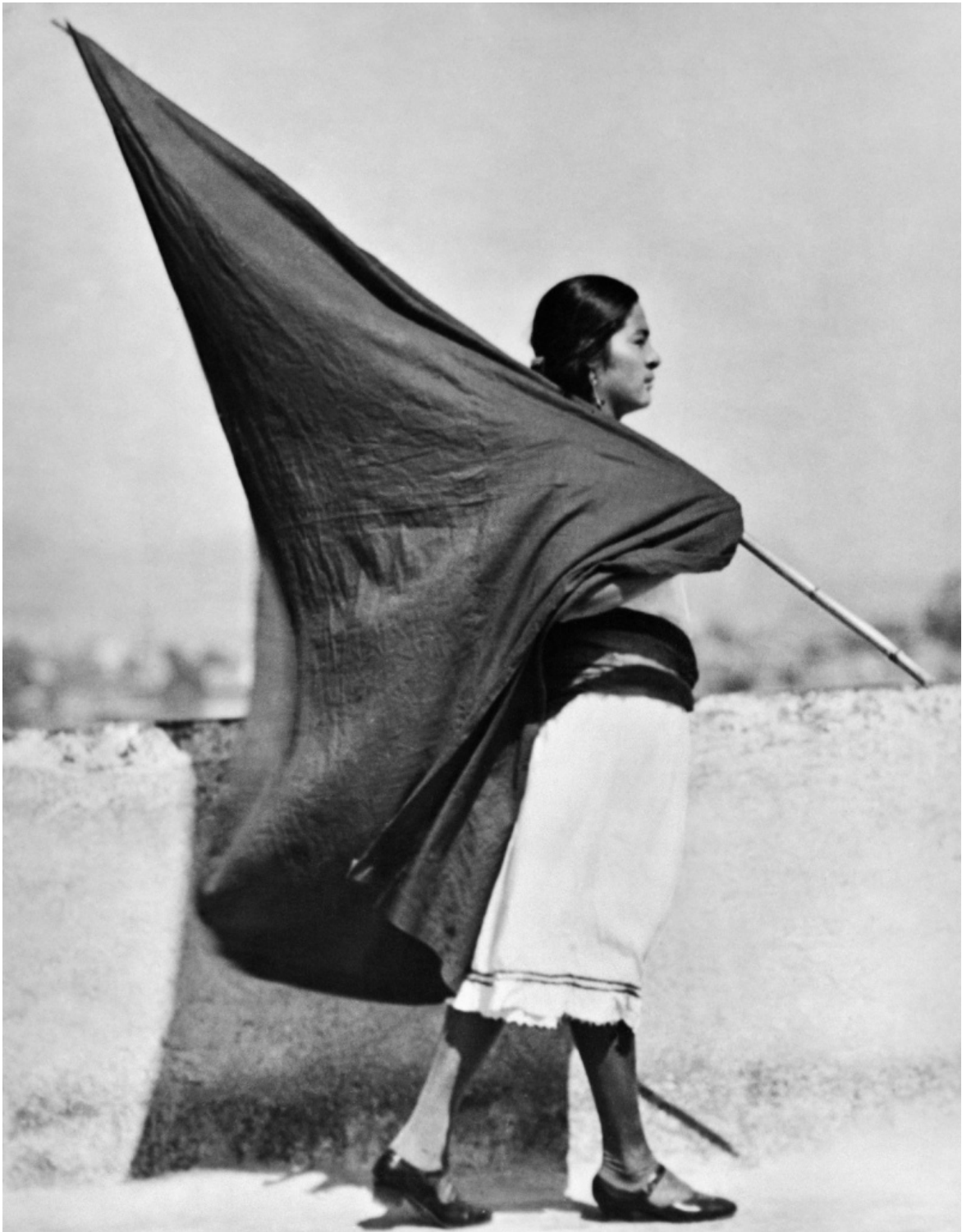
Donna con bandiera, Messico, 1928 ca.

Nel 1930 Tina raggiunge Berlino, espulsa dal Messico con la falsa accusa di avere avuto un ruolo nell'attentato contro il presidente Rubio. In Germania le viene proposto di lavorare come fotogiornalista, ma non riesce ad adattarsi ai nuovi formati e alla velocità che si stanno imponendo in Europa, con le Leica compatte capaci di 36 pose a rullino contro il caricamento singolo della Graflex. Di fatto, la sua carriera fotografica è conclusa. Lascia Berlino per Mosca, in seguito si reca a Parigi, di nuovo a Mosca, poi in Spagna durante la guerra civile, infine torna in