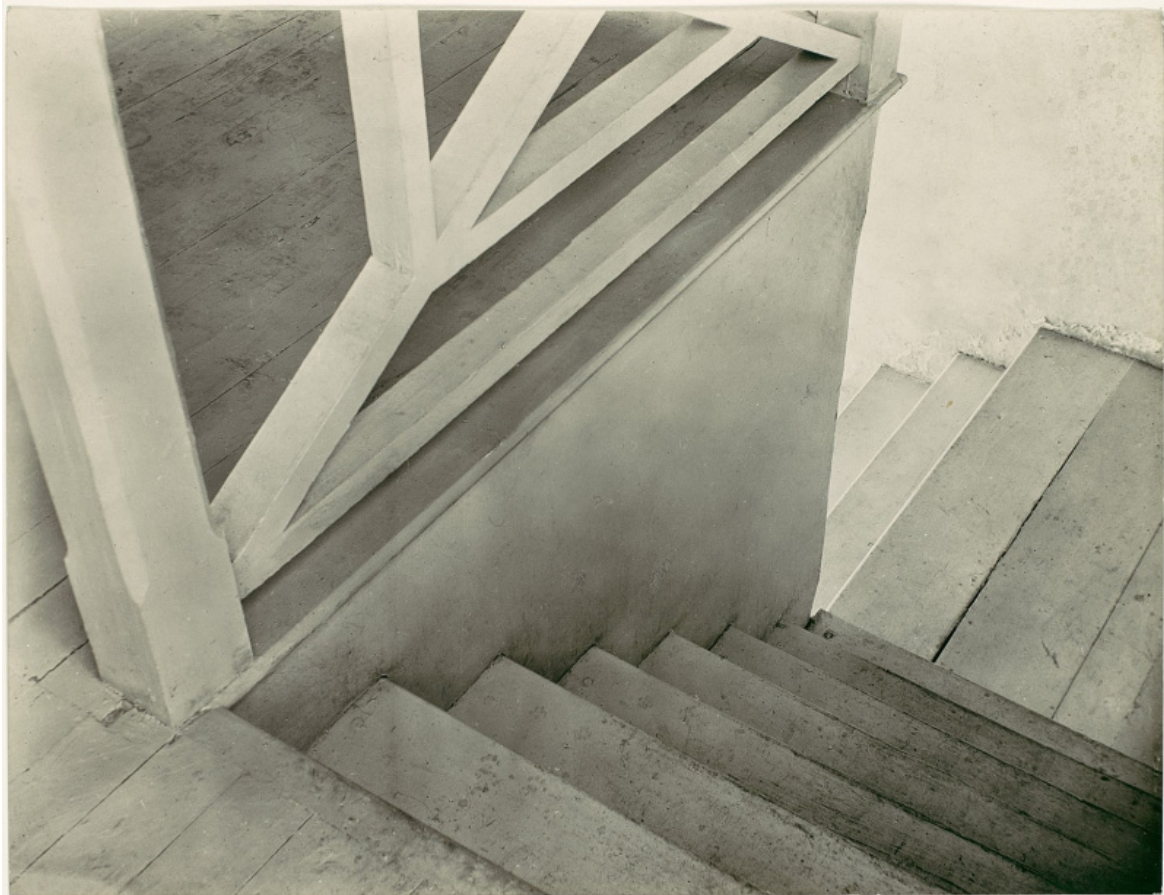
Stairs, Mexico City, 1924-26, stampa ai sali d'argento.

Sono di questa fase i close-up di fiori e piante, le nature morte, le foto di architetture ed elementi dell'ambiente circostante. Immagini che fanno risaltare la bellezza delle strutture, la sinuosità delle linee, sia che si tratti di due calle o di tetti abbacinati di sole. Oggi siamo assuefatti a questo tipo di estetica, ma negli anni Venti questo sguardo incarnava una precisa, radicale scelta modernista in rottura con il pittoricismo delle generazioni precedenti.