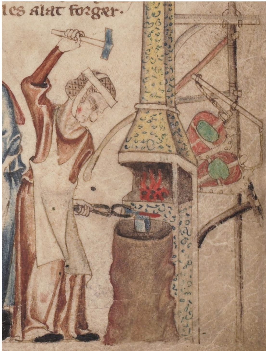
La moglie del fabbro ritratta nella Bibbia di Holkham (1327- 1335 ca.), London, British Library, Add Ms 47682, fol. 31.