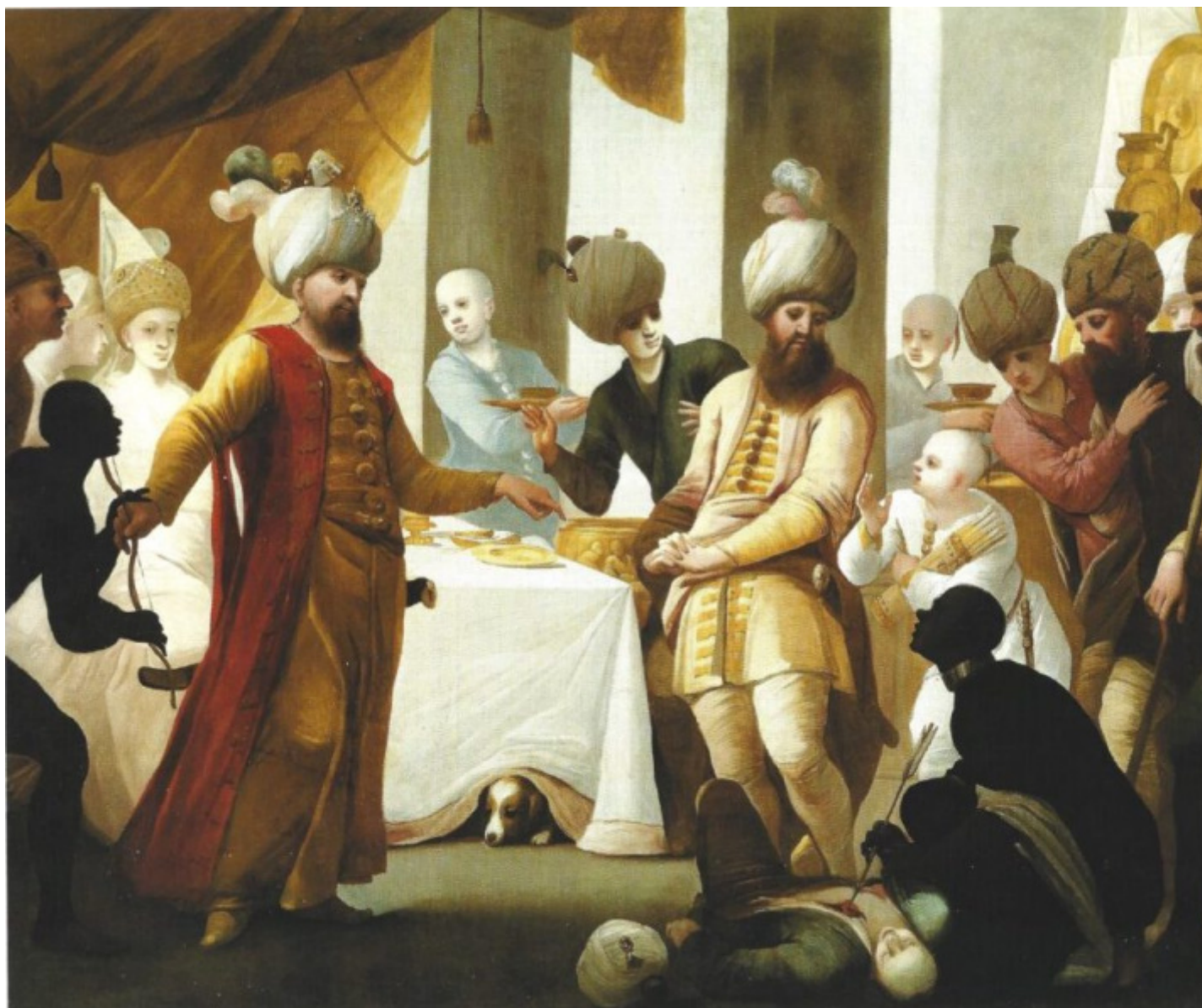
Antonio Cifrondi, L'ebbrezza di Cambise Cambise ebbro uccide il figlio del suo ministro Pressaspe (1690 ca.), Collezione Intesa Sanpaolo.