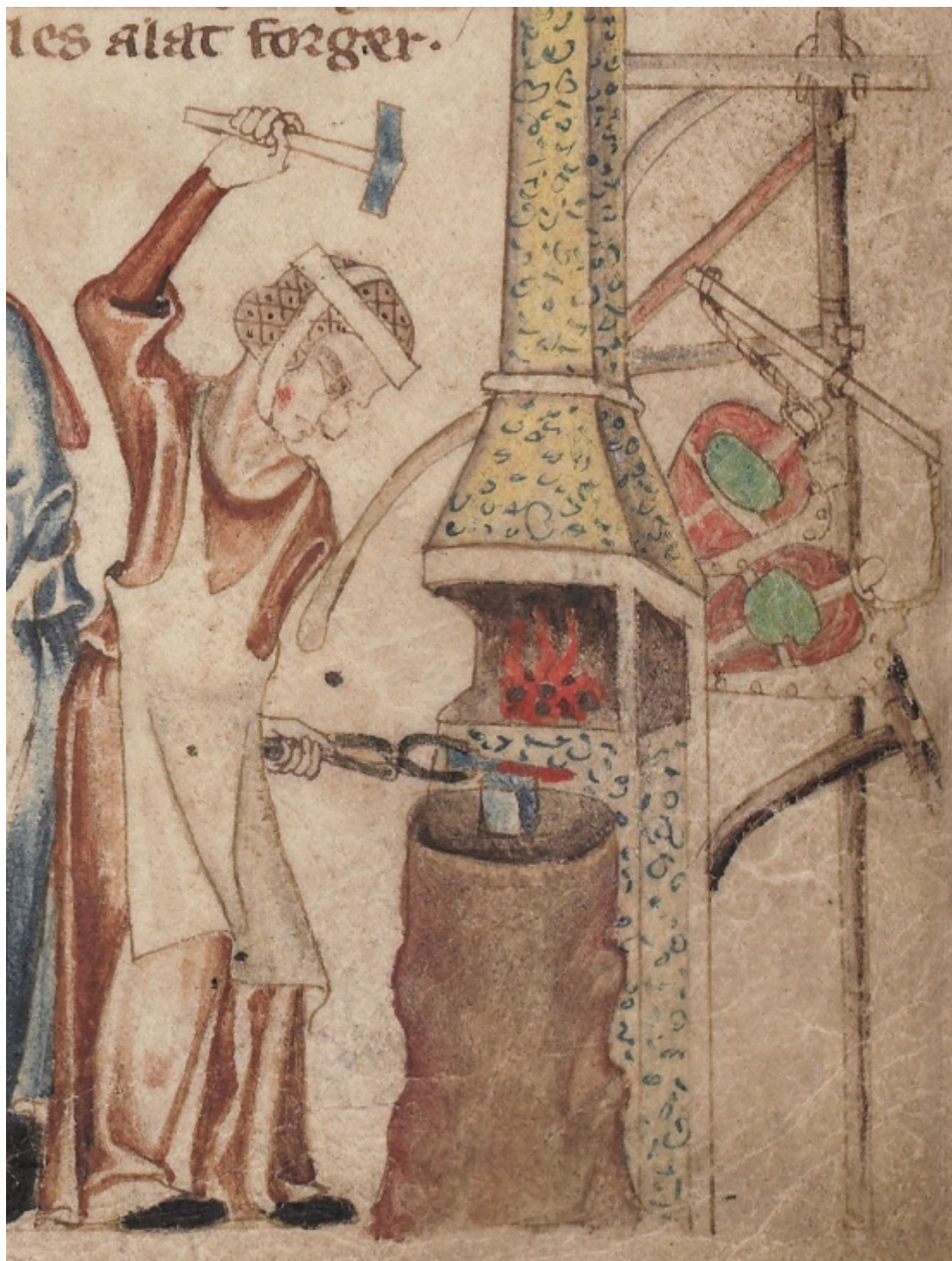
La moglie del fabbro ritratta nella Bibbia di Holkham (1327- 1335 ca.), London, British Library, Add Ms 47682, fol. 31.