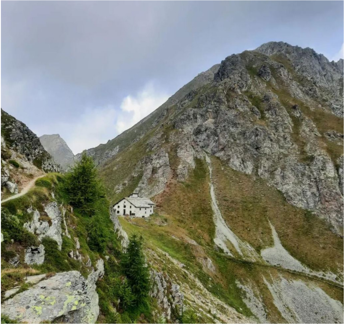
Il rifugio Sottile, sulla sella del Colle Valdobbia, che collega la Val Vogna, diramazione laterale della Valsesia, alla valle di Gressoney.

Il libro si conclude con un testo che conferma le qualità saggistiche già evidenziate in A pesca nelle pozze più profonde. Meditazioni sull'arte di scrivere racconti , del 2014, che meriterebbe una ristampa. Il saggio finale non è una guida alla lettura del romanzo, è uno stimolo per i lettori, un motore di ricerca per chi voglia saperne di più, viaggiando e indagando in altre storie, vicine o lontanissime.