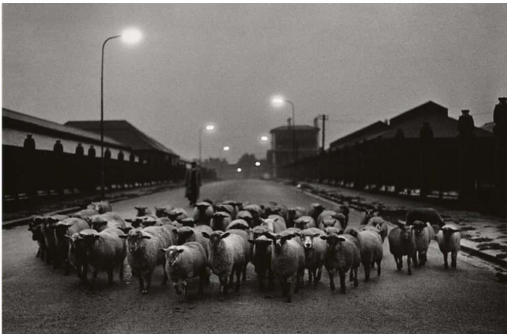
Sheep Going to the Slaughter, Early Morning, Near the Caledonian Road, London, 1965.

L'interregno tra vecchio e nuovo del tessuto urbano in evoluzione è sintetizzato in modo emblematico da un gregge di pecore portate al macello in mezzo alla città, appena dietro alla stazione di Kings Cross; a condurle, un uomo con un lungo impermeabile, una specie di pastore cittadino, personificazione degli affanni, della stanchezza che ciascuno porta in sé. Lunghi edifici scuri e recinzioni rievocano analogie sinistre e anche in questo caso si preannuncia un feroce destino. È l'alba. “Le lampade sono accese ma non risplendono, ha notato?”, scriveva Anna Maria Ortese in Silenzio a Milano .