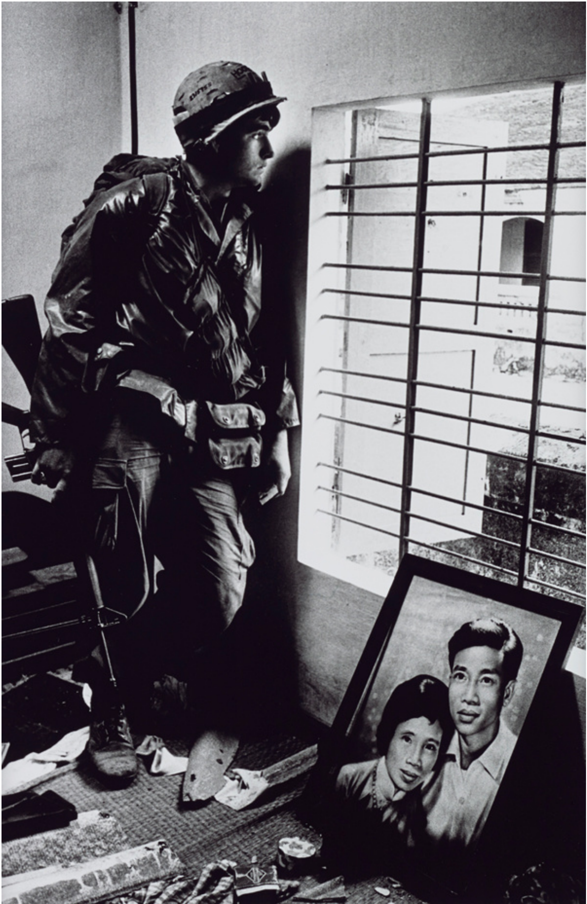
The Battle for the City of Hue, South Vietnam, US Marine Inside Civilian House, 1968.