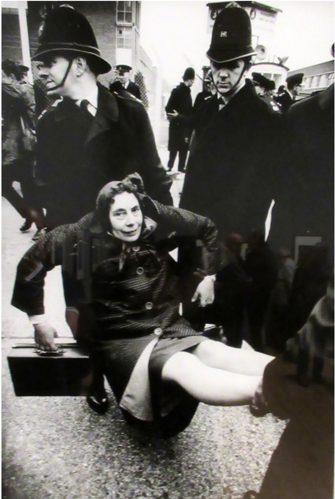
Ban the Bomb March, Aldermaston, England, early 1960s.

Fotografo irrequieto, mai riappacificato con la violenza della propria infanzia, McCullin riversa nelle immagini i suoi traumi irrisolti: “Come tutta la mia