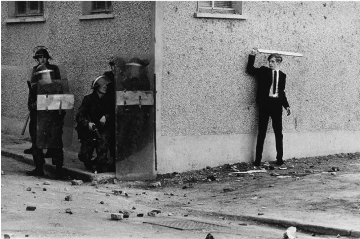
Northern Ireland, The Bogside, Londonderry, 1971.

In un'altra, l'angolo di una strada demarca due mondi in conflitto. A sinistra, un gruppo di soldati britannici in equipaggiamento antisommossa; sulla destra un ragazzo irlandese, perfettamente vestito in giacca e cravatta, impugna un bastone come se sollevasse una spada in un gesto antico, eroico e incongruo, mentre a terra restano i sassi e i mattoni di precedenti scontri. Nella scena c'è qualcosa di ironico, in un certo senso affine allo spirito di Henri Cartier-Bresson, ma c'è anche durezza, violenza trattenuta: gli attori della scena ignorano la reciproca presenza, ma noi, al di qua, spettatori privilegiati come il fotografo, li vediamo simultaneamente e possiamo cogliere la tensione mortale del momento.