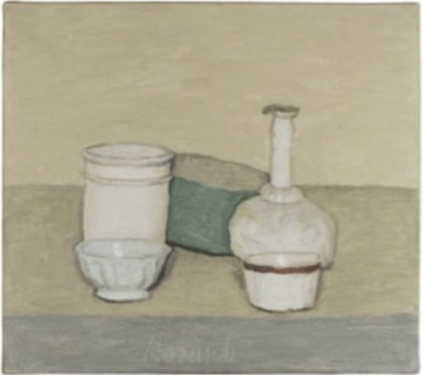
Giorgio Morandi, Natura morta (Still Life) , 1952, olio su tela, ©2015 Artists Rights Society (ARS), New York/Siae, Roma/Collezione privata

Nelle sue acqueforti Morandi usa contrasti tonali più forti che nei suoi dipinti. Ma il loro soggetto è il medesimo ed esse implicano lo stesso distacco e la stessa sensazione che gli oggetti raffigurati siano preziose reliquie di un qualche tipo. Tecnicamente sono magistrali. Ancora una volta in contrasto con tanti suoi contemporanei, Morandi rifiuta di affidarsi alla retorica. Non c'è una lotta "epica" con il rame e l'acido: il mezzo vince alcuni round e l'artista altri. Ogni centimetro quadrato della lastra viene corrosivo come previsto. La gradazione del tratteggio da un tono mussola grigia a un nero profondo è impeccabile; i punti bianchi e le linee tra la "griglia" del tratteggio non sono mai sfocati o imperfetti. Sono fatte – queste acqueforti – con lo spirito con cui alcune donne anziane sanno fare il merletto.