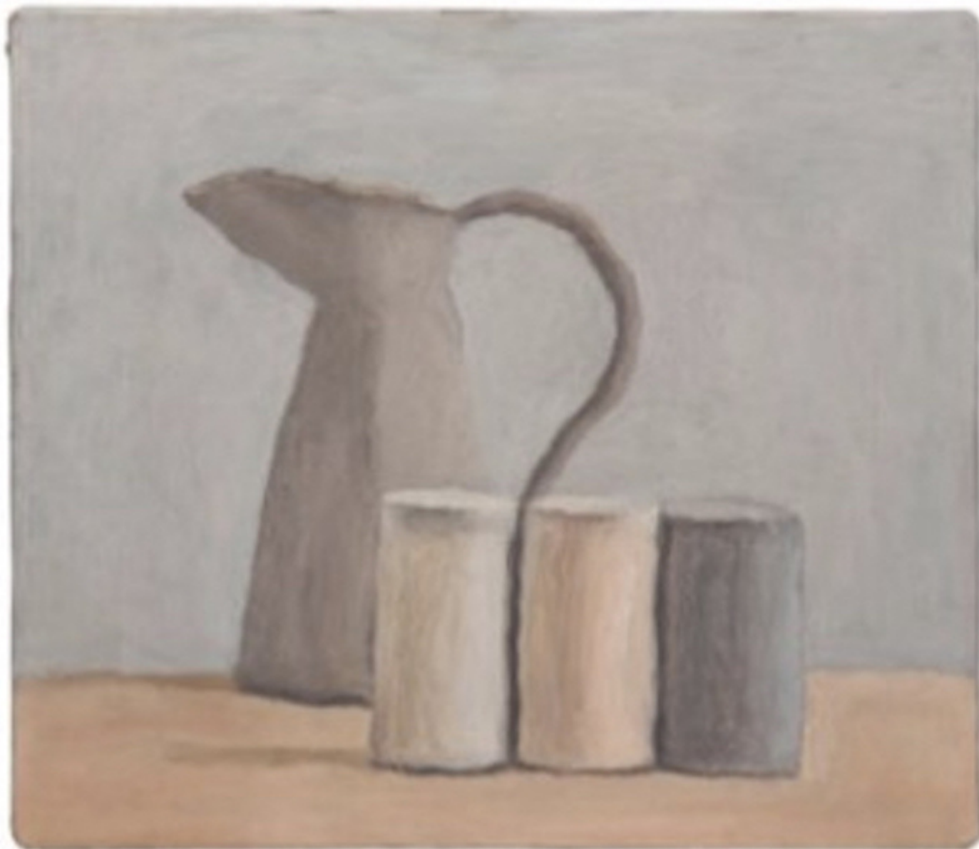
Giorgio Morandi, Natura morta , 1962, olio su tela ©2015 Artists Rights Society (ARS), New York/Siae, Roma/Collezione privata, Svizzera

Non voglio spingere troppo oltre questa osservazione. Tuttavia non riesco a immaginare come descrivere in altro modo quanto l'arte di Giorgio Morandi sia tipicamente italiana. Potrebbe diventare facilmente ultrasoggettivo. Ma non riesco a vederla che in questo modo. L'opera di Giorgio Morandi non contiene echi romani o rinascimentali evidenti. E non esprime neppure l'energia e l'entusiasmo propri del temperamento italiano. La sua opera è specificamente italiana solo perché i suoi dipinti e le sue acqueforti evocano così precisamente questa particolare qualità della luce – la stessa qualità, benché interpretata in maniera assai diversa, che si trova, ad esempio, nell'opera di Piero della Francesca o di Giovanni Bellini.