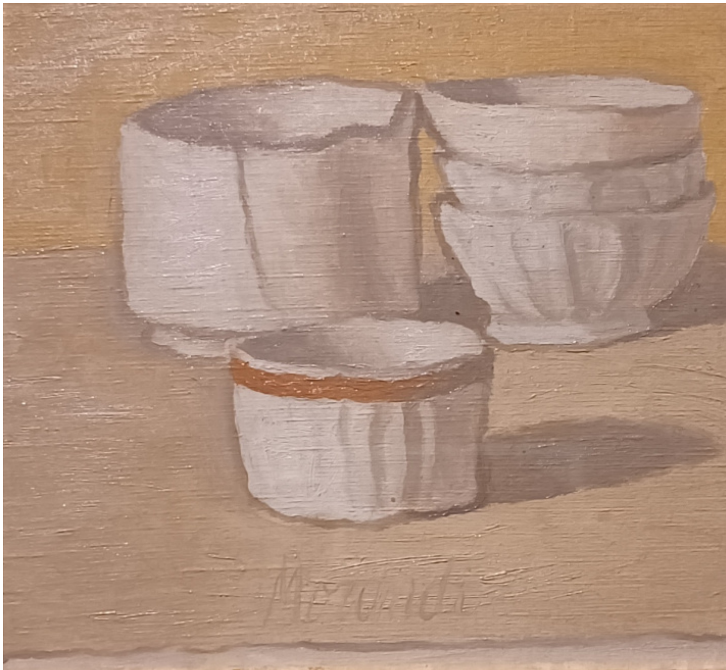
Giorgio Morandi, Natura morta , 1943.

Anche questo, a ben vedere, fa parte di quell'amore di precisione e di quel disdegno della parola superflua o tautologica, chiassosa, che il bergeriano zio Edgar attribuisce al pittore di Via Fondazza. La 'variazione' o 'fuga', impercettibile come una brezza o un sospiro, non può essere segnalata da un titolo. Se a costruirla con intatto stupore è l'artista, paziente sperimentatore di spazi, distanze, intervalli, contiguità e slittamenti, sarà l'osservatore a coglierla e decifrarla con altrettanta intatta sorpresa, come si fa con un messaggio in codice o con un segreto.