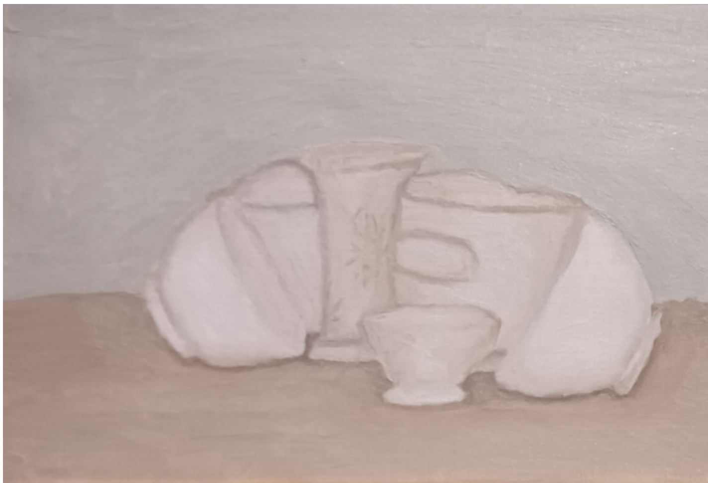
Giorgio Morandi, Natura morta , 1942.

“Lavoro costantemente dal vero”, ha scritto Morandi, “quello che importa è toccare il fondo , l'essenza delle cose”. Ma dov'è il fondo? Qual è l'essenza? È il movimento della luce a produrre quello stato di necessità che l'artista riconosce definitivo? Che sia per questo 'stato d'attesa' giunto a compimento che in alcune tele gli oggetti non proiettano ombra, messi a nudo e trafitti in piena luce? Vano, allora, parlare di forme e di geometrie, di astrazione e di calcolo. Si tratterebbe piuttosto di un rapporto istintivo e sensuale con l'atmosfera e il suo ordine instabile, perennemente provvisorio. Nulla, per Morandi, è più astratto del reale. Tanto che i suoi paesaggi sembrano frutto di un'orchestrazione, di un processo compositivo, tanto quanto le sue nature morte. Questione di sguardo, di ritmo dell'osservazione, di capacità di instaurare un dialogo con la cosa guardata, a sua volta mai statica, mai passiva, mai per sempre uguale e chiusa in se stessa. C'è, nel bel testo della curatrice che inaugura il catalogo, una notazione cruciale: Morandi “ rigetta ogni compiacimento vedutistico ”. Ed è così. Morandi guarda a lungo e aspetta di essere visto. A fare da tramite tra lui e le cose, la potenza alchemica della luce, la sua funzione relazionale.