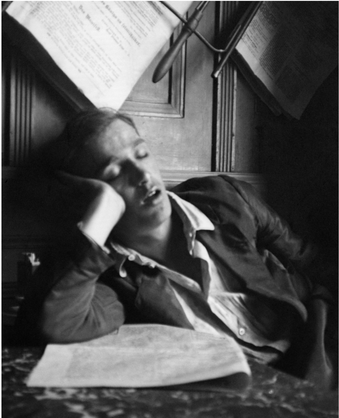
André Kertész. Garçon endormi, Budapest, 1912.

Allo stesso tempo, già in questo primo tratto del percorso di Kertész si può iniziare a notare il primo germoglio della vaga tentazione che fa vedere le cose per un momento distanti da quella rigorosa attinenza con gli schemi della fisica, e della forma naturale: l'“Uomo che nuota sott'acqua”, del 1917, può essere considerato la prima avvisaglia di un intuito pronto a scomporre e ricomporre ciò che gli occhi vedono, un corpo allungato dalle rifrazioni dell'acqua, segmentato dai riflessi che giocano a far cambiare i volumi delle gambe, o della nuca. Non tanto una volontà di guastare ciò che possiede dei confini precisi, in particolare il