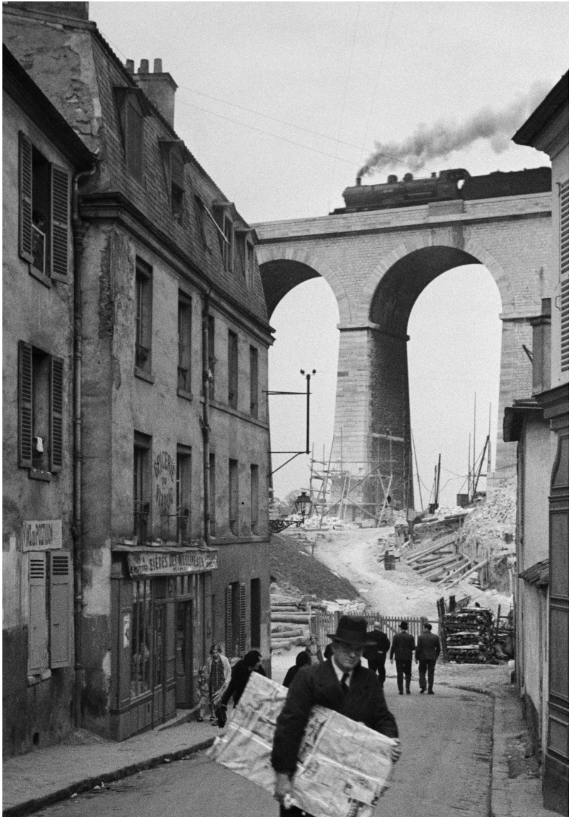
André Kertész. Meudon, 1928.