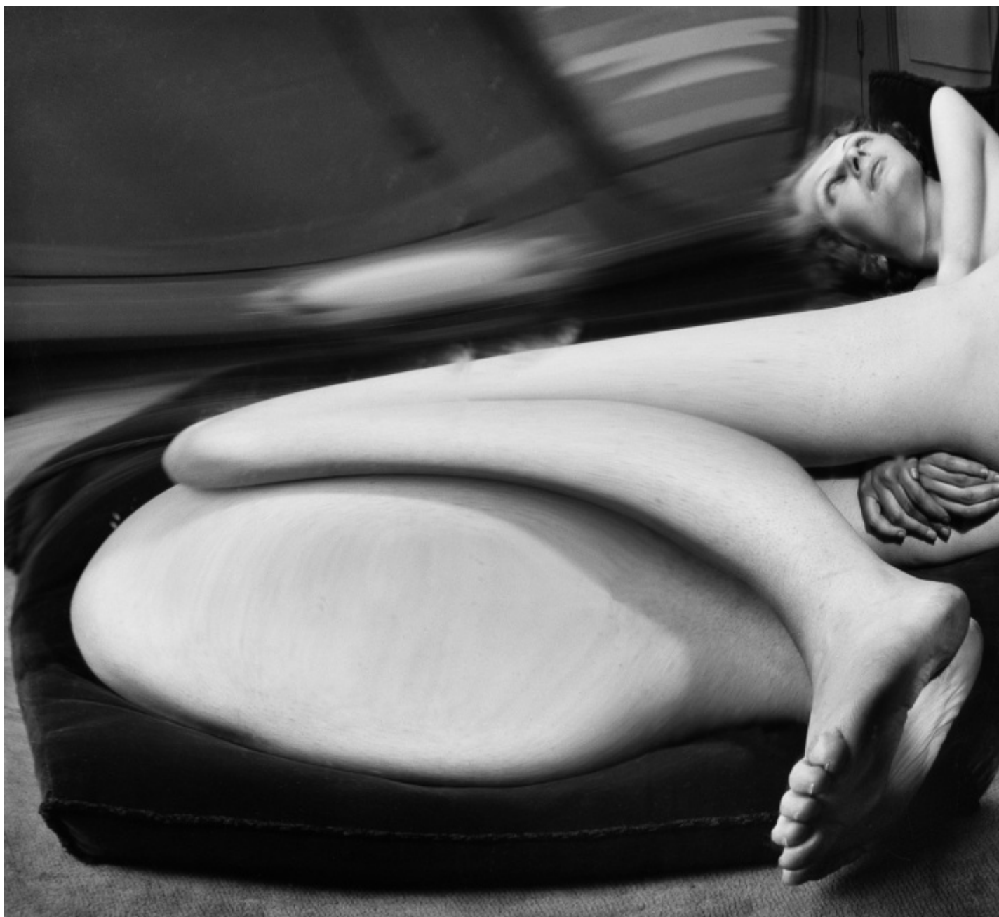
Andre? Kerte?sz. Distorsion n°40, Paris, 1932-1933.