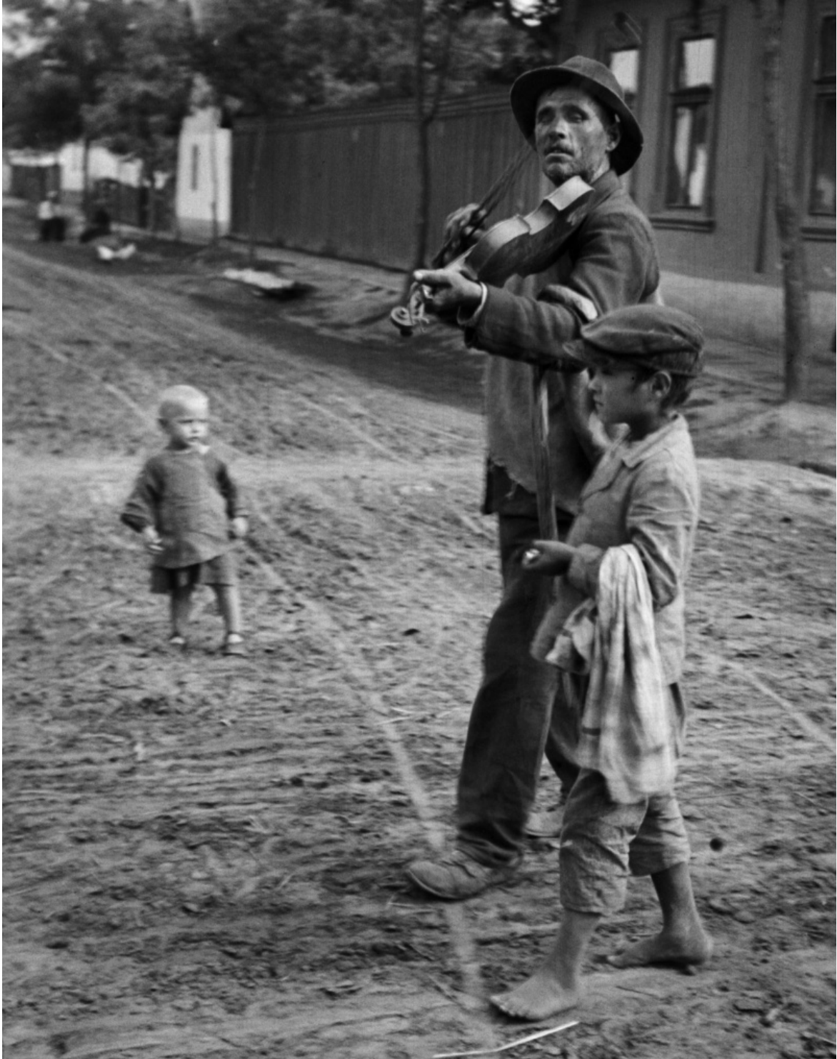
André Kertész. Violiniste aveugle, Abony, 1921.

argomento dell'umano: dal reportage di strada, agli autoritratti, alle vedute della città natia, scattate appena ventenne. Il "Violinista cieco", il "Barbone seduto", il "Ragazzo addormentato" sono i tanti protagonisti di una storia che noi soli ricomporremo, dicendoli sempre così, con la prima lettera maiuscola; e facendoli vagare nelle pianure ungheresi, o nelle piazze vuote all'alba.