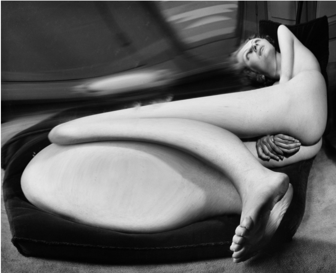
André Kertész. Distorsion n°40, Paris, 1932-1933.

Qui, il gioco della decostruzione della forma viene messo in scena grazie all'effetto di particolari specchi da circo che riescono a esasperare ogni minimo dettaglio di ciò che gli capita di fronte. La lente fotografica dialoga così con una superficie per certi aspetti analoga, capace di portare agli estremi un discorso dalle enormi potenzialità. Nel 1933 Kertész dà a tutti gli effetti vita a un insieme di immagini (circa 200 in tutto) sì in grado di suscitare la risata in chi le guarda - questo infatti era il fine principale che gli era stato affidato dalla rivista - ma anche di sondare i nuovi spazi ricreabili sulla lastra, estesi ora oltre le consuete leggi dell'ottica, delle normali aspettative degli occhi. I "Nudi" già citati di Bill Brandt appaiono in questo modo l'avvio di un'epopea formale ben lontana dal potersi esaurire in fretta, e Kertész è indubbiamente stato maestro, tra gli altri meriti, nel dare al soggetto vere speranze di una trasformazione totale, almeno entro i margini dell'inquadratura. Il corpo può diventare allora un fluido rannicchiato, rifratto e ripetuto più volte nello stesso spazio, minuscolo e gigantesco. Ed è con questa consapevolezza che anche il nuovo insieme di personaggi del racconto newyorkese di Kertész ci appare il prosieguo necessario dell'apice raggiunto con le "Distorsioni", in cui compare in diramazioni sempre