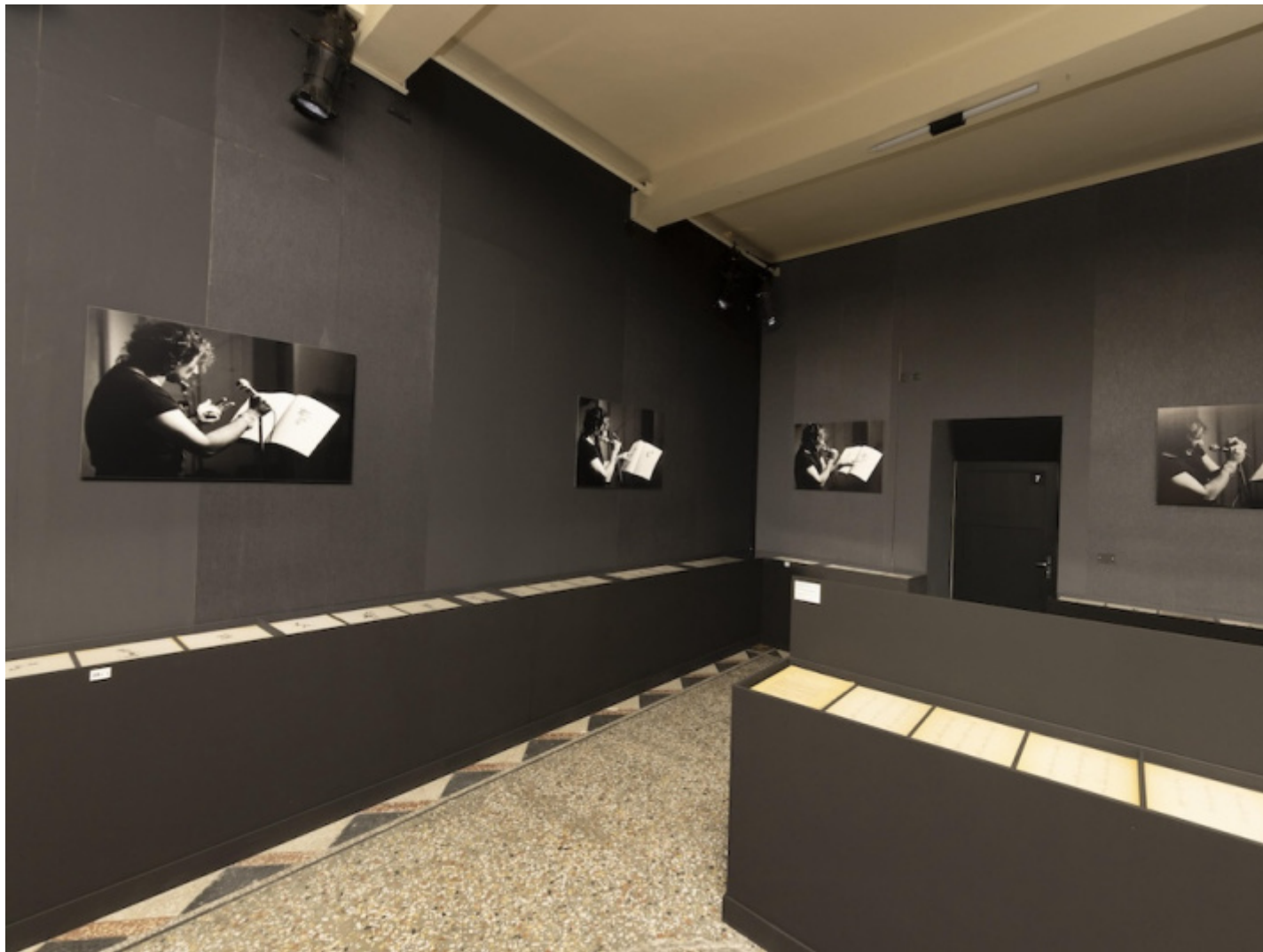
Sala Mesostics, ph. Marco Caselli Nirmal.

“La voce è magia: appello, grido, rimbombo che scaturisce dalla terra madre. Essa non appartiene a noi, noi ne siamo trapassati” commenta Ermanna Montanari. E con Enrico Pitozzi scrive, nell’introduzione all’elegante catalogo Sigaretten Edizioni Grafiche: “La voce non coincide con la parola, bensì prende corpo in uno spazio intermedio tra il segno (la parola) e il discorso che l’articola. La voce è il lampo che convoca la figura – l’immagine-somiglianza che la voce manifesta – della cosa che chiama”. La voce, intervallo tra inspirazione ed espirazione, non definisce, evoca il mondo. E perché ciò avvenga “serve concepire il corpo come un risonatore che si lasci attraversare dall’emissione sonora e si dispieghi integralmente nella voce”, con “tecnica fonatoria che organizza l’intera anatomia in vista dell’emissione vocale e fa della bocca il luogo fisico, la grotta o la cattedrale, in cui la voce risuona”. La voce di Stratos manifesta, in un’accordatura cosmica, il tessuto del mondo nella sua “splendente molteplicità”.