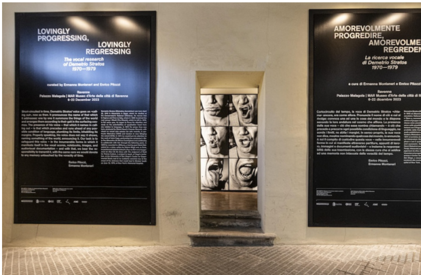
Ingresso alla mostra, ph. Marco Caselli Nirmal.

Rubo questi frammenti di frasi a un'intervista per la televisione di Demetrio Stratos, il grande sperimentatore sulla voce. A lui Malagola, Centro di ricerca vocale e sonora legato al Teatro delle Albe, dedica a Ravenna la mostra Amorevolmente progredire, amorevolmente regredendo. La ricerca vocale di Demetrio Stratos 1970-1979 .