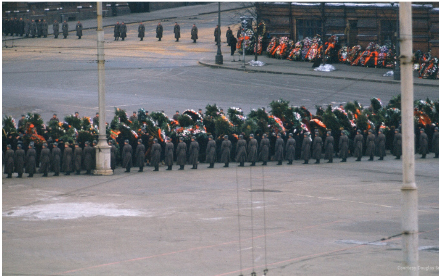
Le centinaia di corone di fiori per Stalin, 1953.

L'ottimismo di inizio anni Sessanta si accompagnava anche a una crescente ricerca d'autonomia dai circuiti ufficiali, a malapena tollerata durante la prima parte del decennio ma poi perseguita come violazione della legalità socialista in seguito, anche se, come ricordato da Anna Achmatova, le repressioni avevano assunto forme "vegetariane" in confronto a quanto avvenuto durante il Terrore. Proprio il funerale della grande poeta (odiava essere declinata al femminile) viene presentato in maniera convincente come la fine di questo periodo, con l'organizzazione delle esequie divisa tra due personaggi molto diversi, Iosif Brodskij e Lev Gumilëv, figlio dell'Achmatova con cui ebbe sempre un rapporto conflittuale.