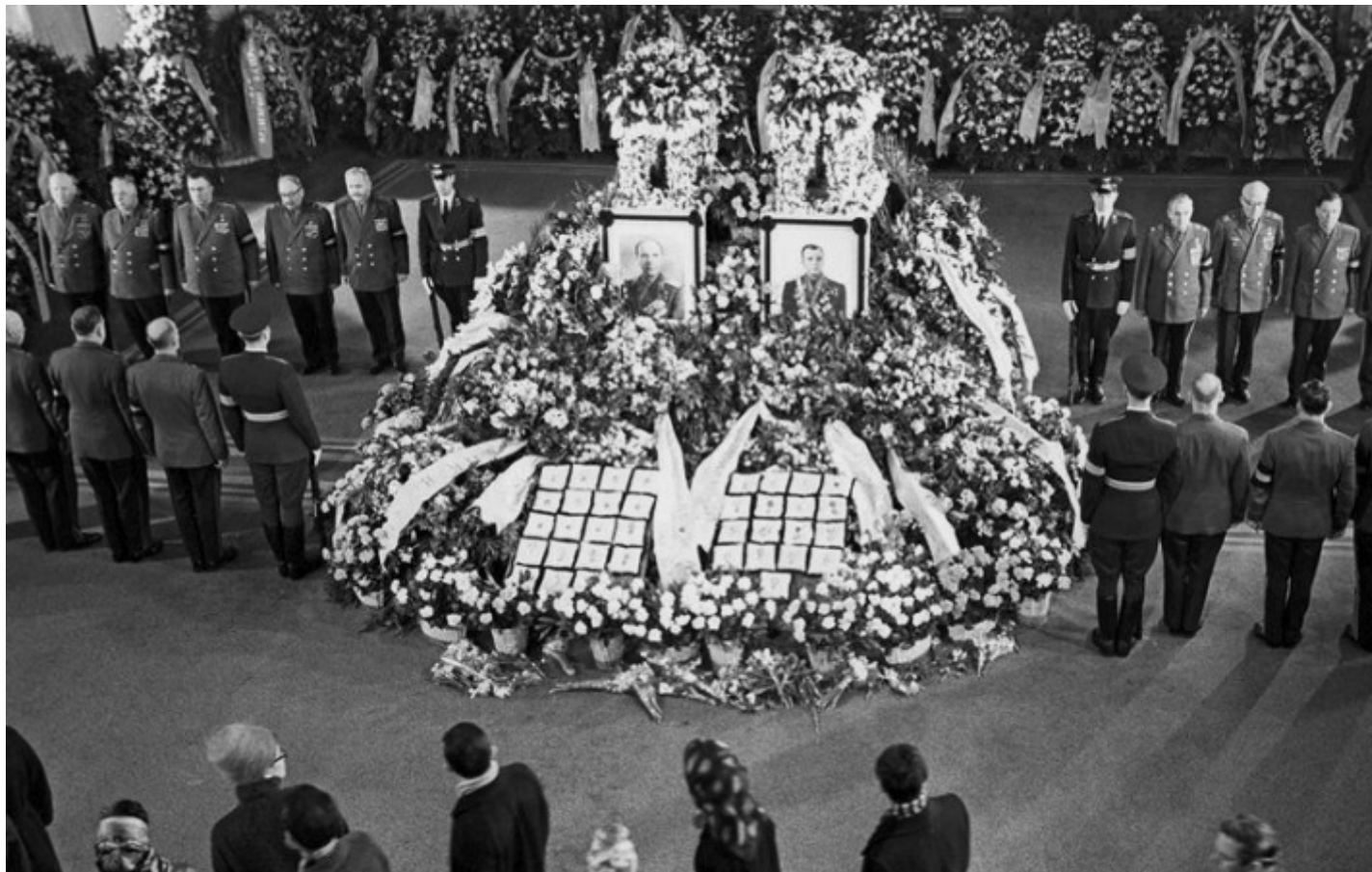
Le urne con le ceneri di Gagarin e Seregin, 1968.

Ma dodici anni dopo la marcia funebre si sarebbe arricchita di note trionfali, con la sepoltura dei caduti degli scontri nelle strade di Pietrogrado durante le giornate della Rivoluzione di febbraio: l'atmosfera non era esclusivamente di lutto, ma festosa, di fede nel radioso avvenire annunciato dalla caduta dell'autocrazia, e il luogo prescelto, il Campo di Marte non lontano dalla prospettiva Nevskij e dal Palazzo d'Inverno, richiamava anche la decisiva partecipazione dei soldati all'insurrezione, in una mescolanza che avrebbe avuto effetti di lunga durata. Già nell'inverno del 1917 a Mosca, teatro di sanguinosi combattimenti tra le Guardie rosse e le unità restate fedeli al Governo provvisorio, si ripeteranno in parte le scene pietrogradesi e si procederà all'interramento delle vittime sulla Piazza Rossa, sotto le mura del Cremlino, inaugurandone la funzione di necropoli socialista assolta per i successivi sette decenni. La morte non implicava la fine, ma un nuovo inizio, una promessa di resurrezione nel ricordo dell'esempio, del sacrificio nella "battaglia decisiva" (per citare un verso dell'Internazionale in russo) per la costruzione della società socialista.