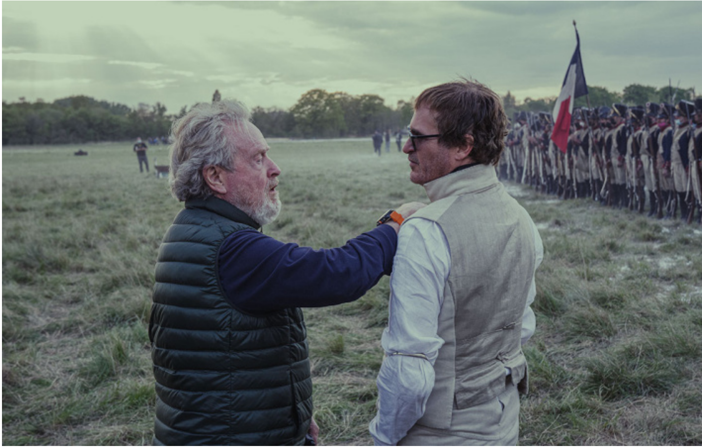
Ridley Scott con Joaquin Phoenix sul set.

armate di Napoleone erano soprattutto l'immagine del cambiamento.