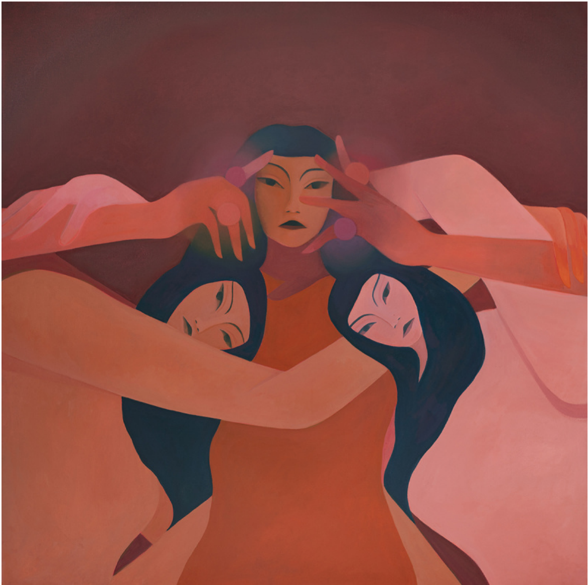
Illustrazione di Laura Berger.

“Perché non posso salire sul tram con il passeggino? si domanda Kern architetta-ricercatrice appena diventata mamma. Perché sono costretta a percorrere mezzo chilometro in più per tornare a casa considerando che la scorciatoia è troppo pericolosa? si domanda Kern, giovane donna che si muove dentro uno spazio metropolitano a libertà limitata. Chi andrà a prendere mio figlio al campo scuola se dovessi avere un contrattempo imprescindibile? si chiede ancora Kern madre single alle prese con la difficile conciliazione tra essere madre lavoratrice con una figlia piccola, senza avere reti familiari di supporto.”