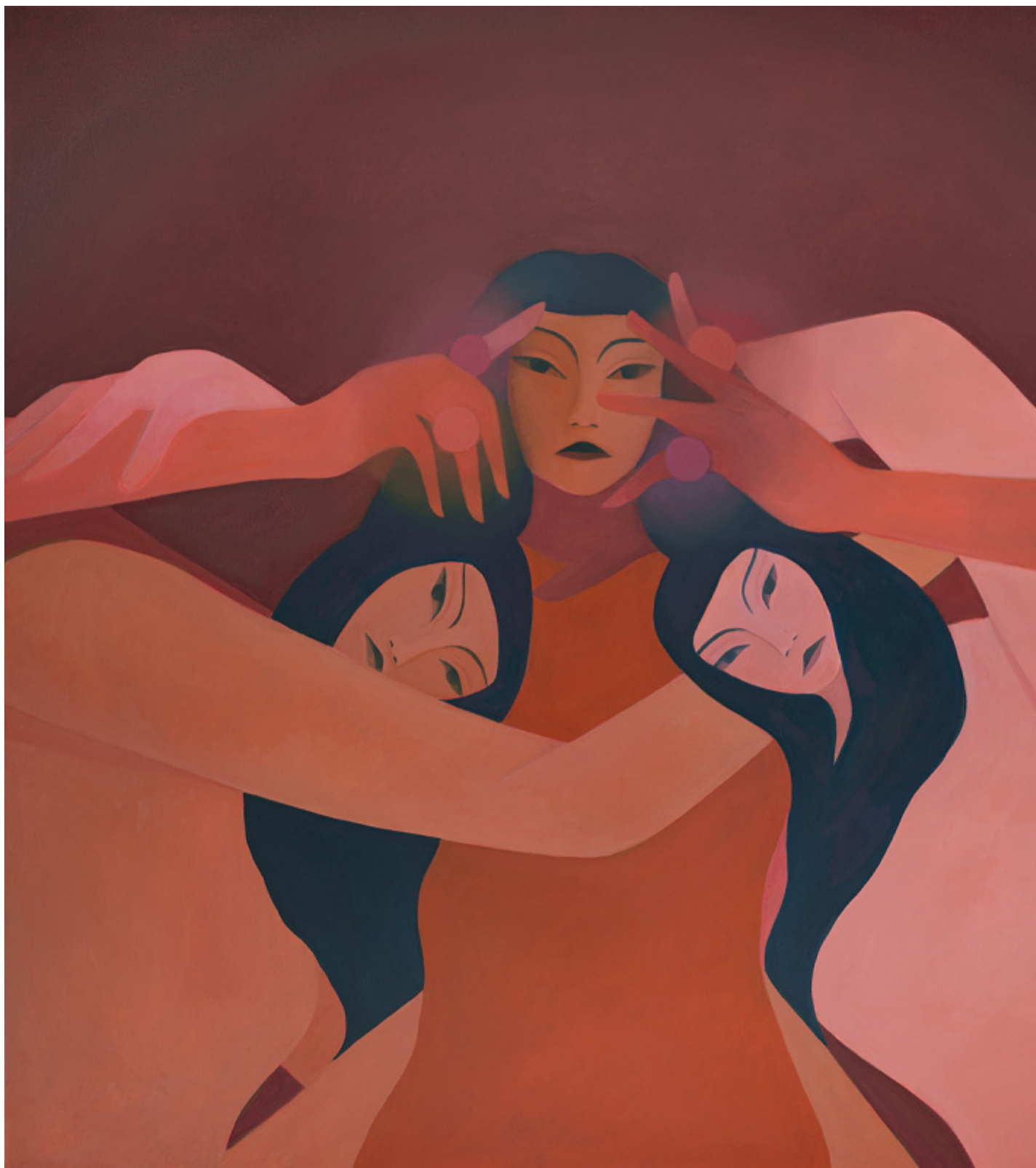
Illustrazione di Laura Berger.

“Perché non posso salire sul tram con il passeggino? si domanda Kern architetta-ricercatrice appena diventata mamma. Perché sono costretta a percorrere mezzo chilometro in più per tornare a casa considerando che la scorciatoia è troppo pericolosa? si domanda Kern, giovane donna che si muove dentro uno spazio metropolitano a libertà limitata. Chi andrà a prendere mio figlio al campo scuola se dovessi avere un contrattempo imprescindibile? si chiede ancora Kern madre single alle prese con la difficile conciliazione tra essere madre lavoratrice con una figlia piccola, senza avere reti familiari di supporto.”