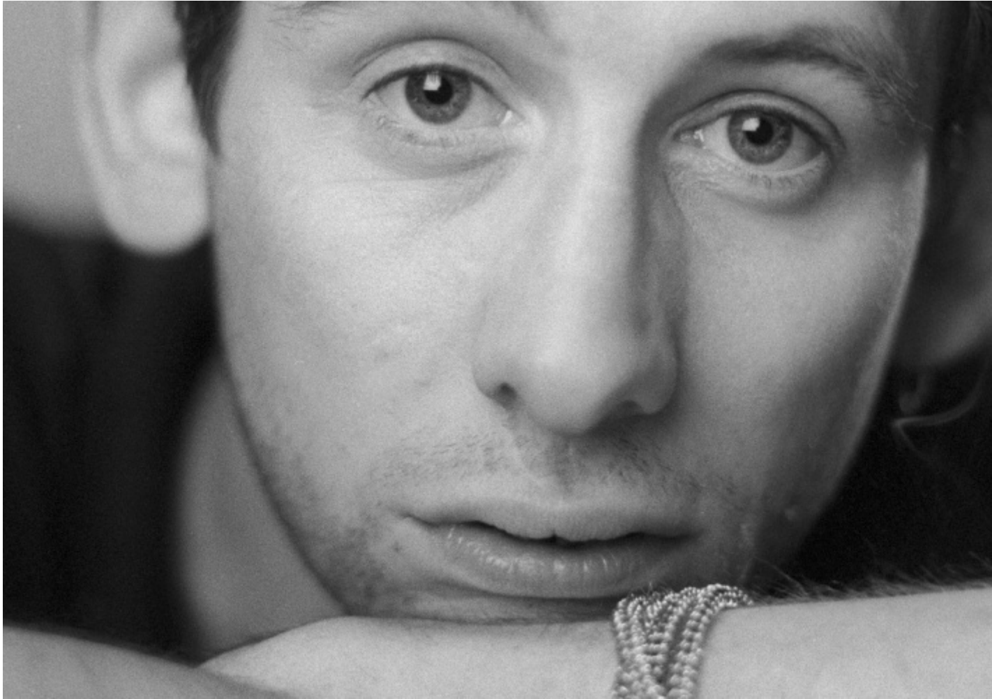
Shane MacGowan.

di una bontà che cozzavano con la sua immagine di ubriaccone cronico, la faccia sghemba, perennemente stralunata, i denti guasti, troppo alcool e eroina. Ma un poeta, appunto, uno, citando sempre Nick Cave, con un profondo senso di ciò è vero, qualcosa che ne amplificava la fragilità e l'umanità . Quella canzone, che trentacinque anni dopo la sua composizione si è ormai guadagnata lo statuto di canzone di Natale fra le più amate al mondo, è stata cantata in chiesa , il giorno del funerale di Shane MacGowan, da Glen Hansard, dalla splendida Lisa O'Neill, una delle più pregnanti voci dell'Irlanda canora di oggi, e dai vecchi amici dei Pogues con un carico di emozione e con quel senso di festa collettiva che soltanto gli irlandesi riescono a creare. E poi sì, non li hanno censurati, in chiesa, quei famigerati versi: