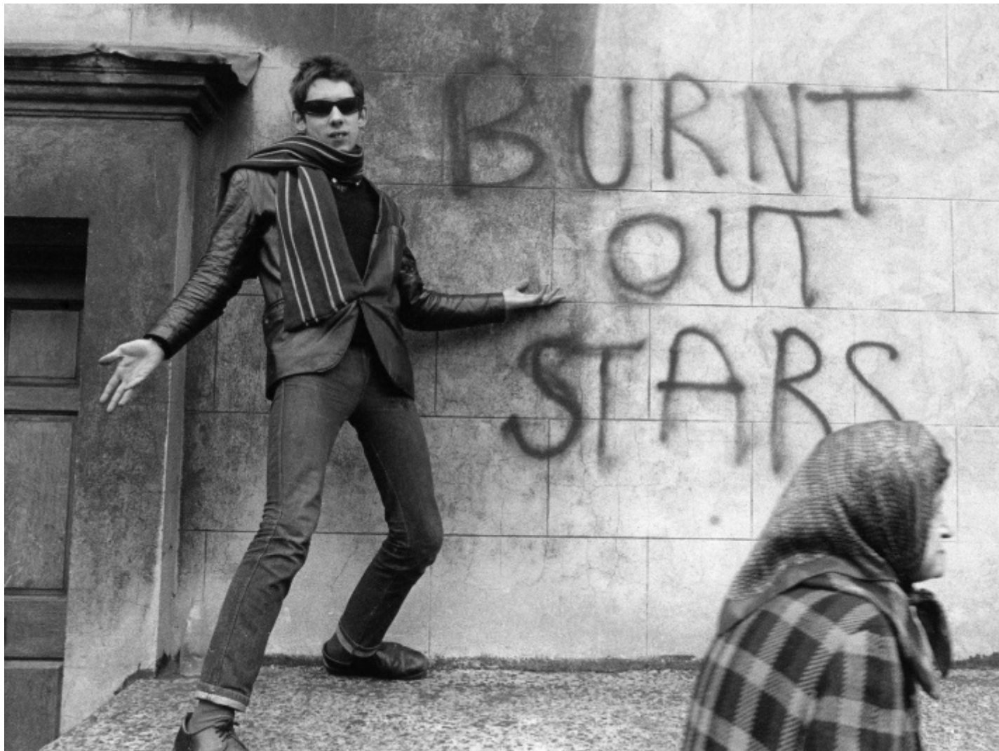
Shane McGowan.

Le canzoni di Natale che di primo acchito paiono c'entrare poco col Natale, fuliginose come se avessero visto la luce nella canna fumaria di un camino dove Babbo Natale non si avventura, formano un canone a sé. La loro particolarità non consiste tanto nel fatto che non si richiamano a slitte, renne e stelle filanti, quanto al fatto che affrontano il Natale con i piedi ben piantati per terra. Impongono un che di realistico al regno fantastico delle canzoni di Natale che tutti abbiamo imparato ad amare. Un esempio fra i più poderosi è Christmas card from a hooker in Minneapolis di Tom Waits (sì, le prostitute scrivono delle lettere di Natale), ma anche l'antesignana Blue Xmas (to whom it may concern) di Miles Davis (canta Bob Donough; il sax è di Wayne Shorter), che già a inizio anni '60 affrontava il tema del Natale consumistico.