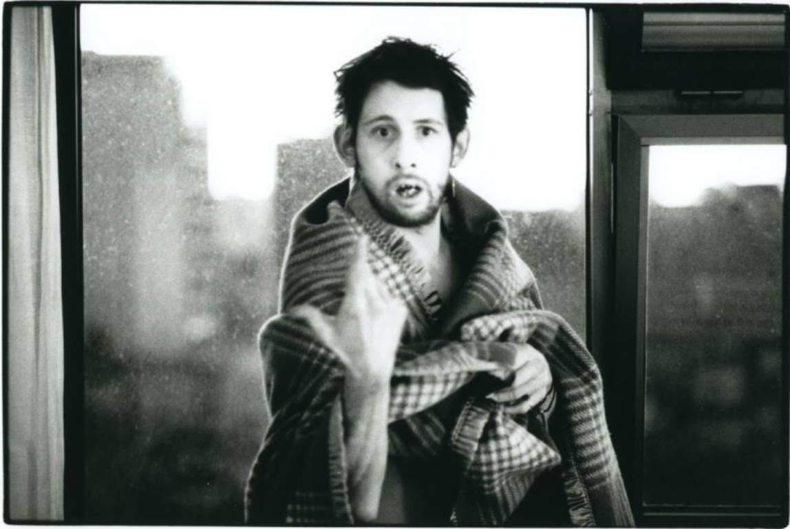
Shane McGowan.

con una parodia in cui i ruoli vengono invertiti, mettendo un secondo lui nei panni di lei e una seconda lei nei panni di lui (un'inversione di ruoli che in verità risulta a sua volta problematica, a prescindere dall'intento comico, laddove lei è presentata come una predatrice e lui nei panni di un tontolone, se non proprio, con sovraccarico di pregiudizio, di travestito, non fosse che per sbadataggine).