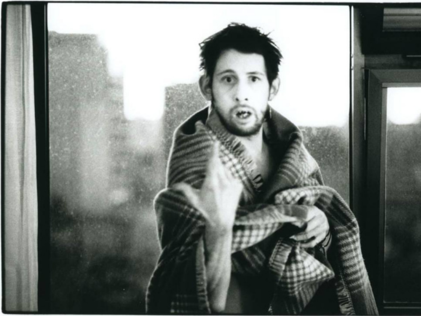
Shane McGowan.

Tornando alla canzone Fairytale of New York , il testo di Shane MacGowan è uno dei più schietti che si possano immaginare per una canzone natalizia. Shane non era mai stato a New York prima di scrivere la canzone, ma questo non gli impedì di imbastire la storia di due immigrati irlandesi che negli anni '40 del Novecento s'erano messi in testa di conquistare New York. Era l'America di Sinatra, quella delle macchine grandi come bar e dei fiumi dove scorreva l'oro. Le cose però, come può capitare, presero un'altra piega. Nel giorno di Natale i due si rinfacciano di tutto, a Shane MacGowan bastano due versi, due battute di un dialogo fra questi due amanti in crisi per rendere vivida la distanza che li separa in quel momento: