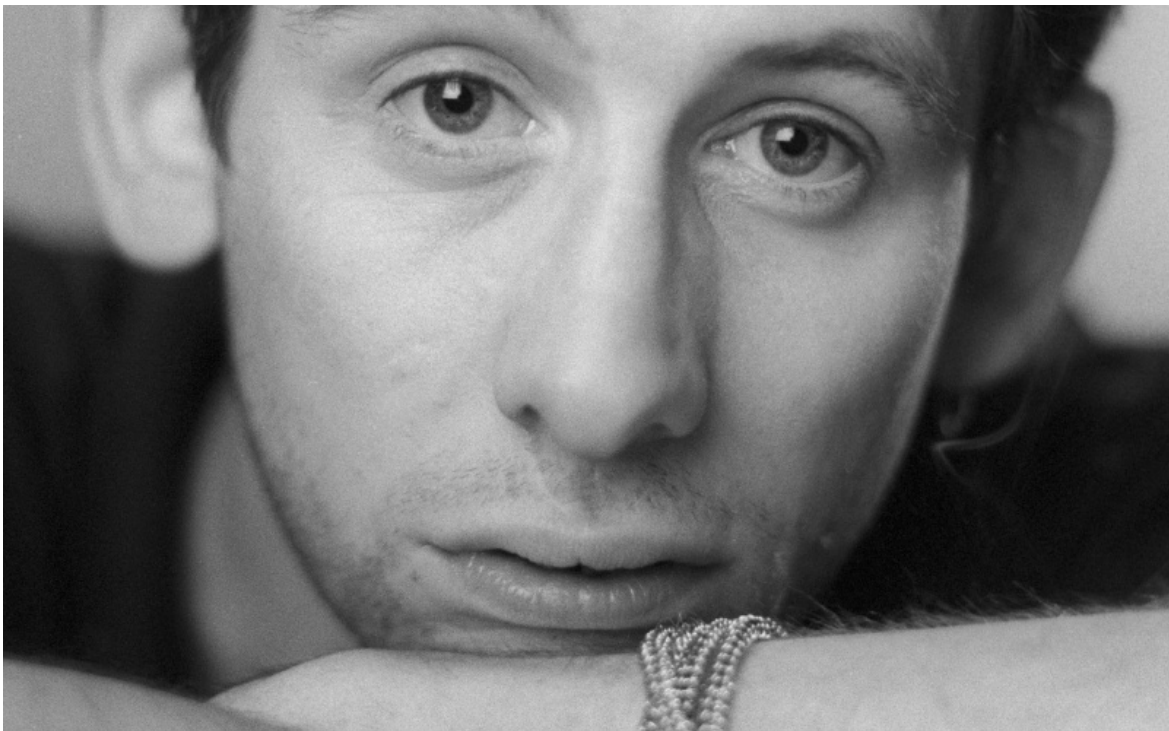
Shane McGowan.

Shane MacGowan, il cantante dei Pogues, uno dei tanti poeti d'Irlanda, ci ha lasciati da poco. Shane era un ragazzo difficile fin dagli anni '70, a beautiful and damaged man , ha scritto Nick Cave in un toccante ricordo subito dopo la sua morte, un uomo bello e rovinato , rovinato nel senso di ferito . Un uomo di una generosità e di una bontà che cozzavano con la sua immagine di ubriaccone cronico, la faccia sghemba, perennemente stralunata, i denti guasti, troppo alcool e eroina. Ma un poeta, appunto, uno, citando sempre Nick Cave, con un profondo senso di ciò è vero, qualcosa che ne amplificava la fragilità e l'umanità . Quella canzone, che trentacinque anni dopo la sua composizione si è ormai guadagnata lo statuto di canzone di Natale fra le più amate al mondo, è stata cantata in chiesa , il giorno del funerale di Shane MacGowan, da Glen Hansard, dalla splendida Lisa O'Neill, una delle più pregnanti voci dell'Irlanda canora di oggi, e dai vecchi amici dei Pogues con un carico di emozione e con quel senso di festa collettiva che soltanto gli irlandesi riescono a creare. E poi sì, non li hanno censurati, in chiesa, quei famigerati versi: