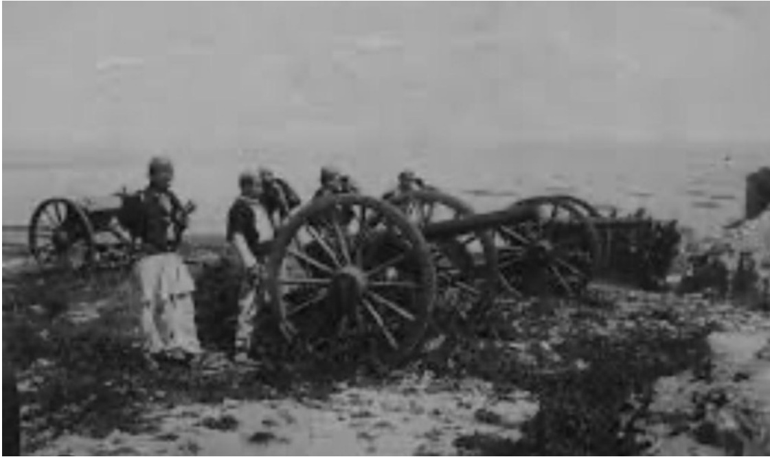
Artiglieria albanese 1920.

per parlare di accordi su migranti e frontiere, un giovane migrante albanese si è tolto la vita in Inghilterra, mentre aspettava su una nave alberghiera dove risiedono i richiedenti asilo, ormeggiata nel sud est del paese.