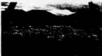
In volo su Durazzo e Tirana durante le operazioni

La notizia della nostra vittoria è stata accolta con entusiasmo in tutta Italia. Le truppe italiane sono entrate a Tirana alle ore 9.30. La capitale albanese è stata occupata senza resistenza. Il re Zog e il suo governo sono fuggiti. La Legazione italiana è stata assediata ma ha resistito fino all'arrivo delle truppe.