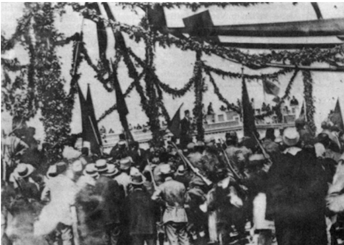
Festa per il ritiro delle truppe italiane.

Scriveva lucidamente Errico Malatesta in Volontà 1, n.6 nel 1913: «L'orrore della guerra balcanica funesta di nuovo, e nel modo più tragico, l'Europa. Prima la guerra fra l'Italia e la Turchia, - la storia assegnerà alla monarchia italiana la responsabilità delittuosa dell'inizio di questa corsa pazzo verso l'ignoto.»