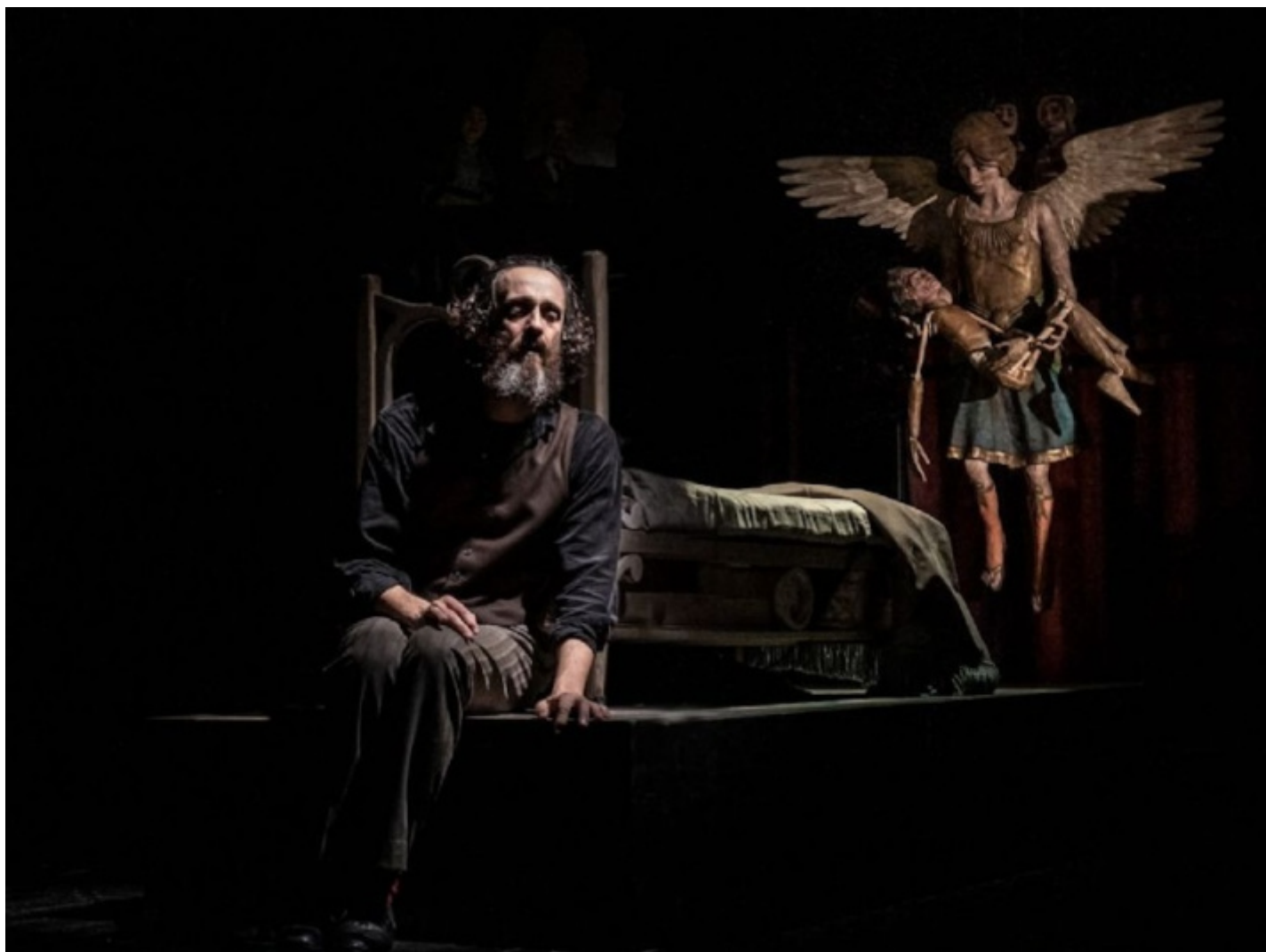
Natale in casa Cupiello per attore solo cum figuris.

Il naufragare delle illusioni di armonia del protagonista viene rafforzato dalla girandola di personaggi meccanici, ai quali la voce dell'unico attore cerca di dare, riuscendoci, sfumature di umanità. Il contrasto diventa una forma di raffinato straniamento che presto suscita l'immedesimazione totale dello spettatore, facendogli dimenticare di trovarsi di fronte a esseri mossi da fili. Allora il rifiuto del figlio di Lucariello ad amare il presepe e il pranzo di Natale che porta alla luce i malesseri dei rapporti familiari enfatizzano un meccanismo inesorabile. La commedia fa pensare al destino, a casi umani i cui intrecci portano inesorabilmente verso la rovina o la rivelazione, a qualcosa che ha a che fare, nel sorriso stemperato della farsa, con l' automaton e con l' ananke della tragedia. Quei doppi dell'essere umano che sono le marionette, con la loro rigidità, in cortocircuito con le modulazioni affettive della voce, ne rivelano i sentimenti e le paure, apparentemente senza partecipazione e sommovimenti interiori: perciò in modo più forte, come nelle favole, come nei paesaggi più estremi e vividi della memoria. Il testo di tradizione viene rivoluzionato, come volevasi dimostrare, da quei "rigidi" attori, scaglie di altri mondi più immobili e più misteriosi precipitati nel nostro.