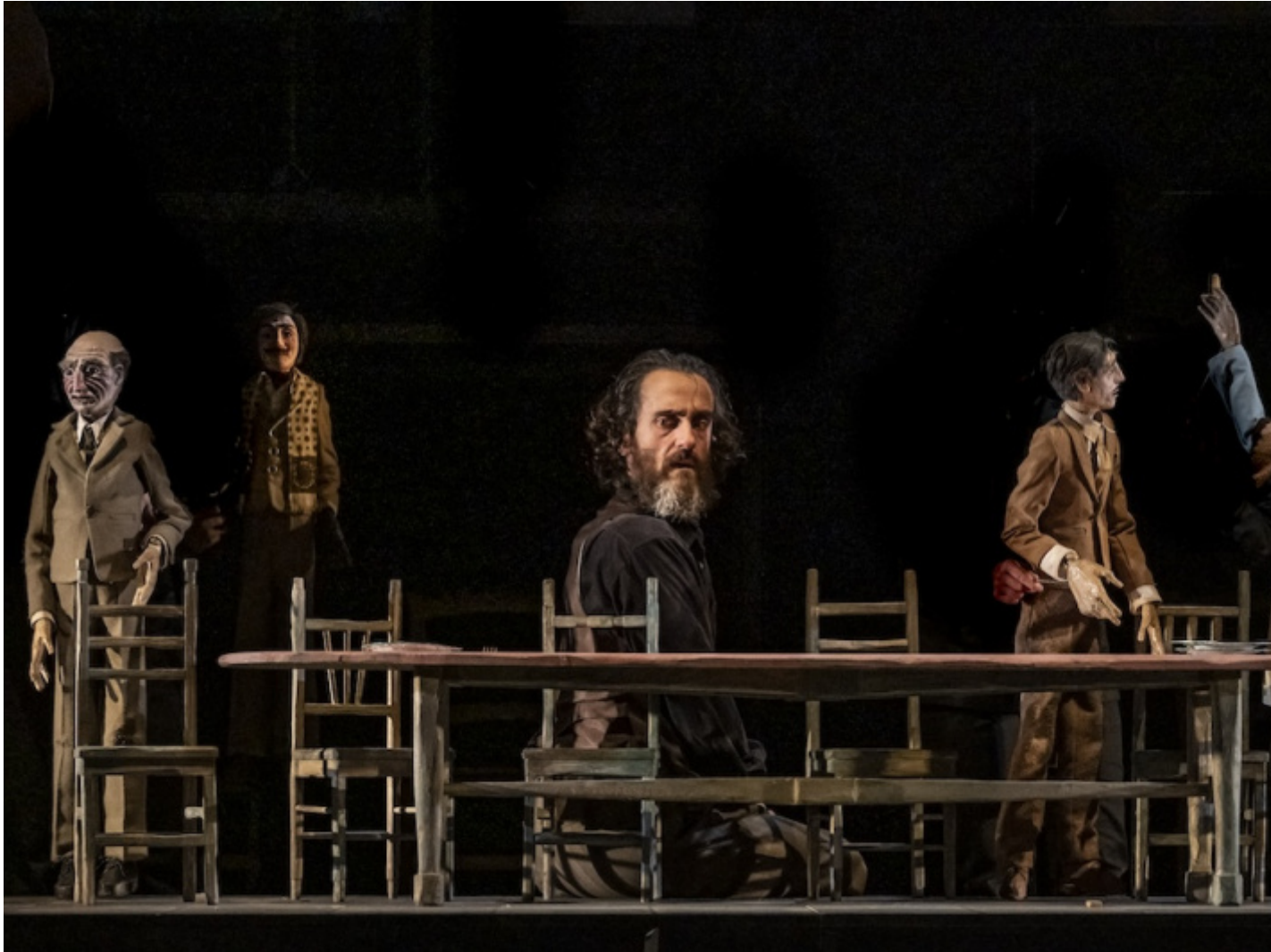
Natale in casa Cupiello per attore solo cum figuris.

da tutto il mondo e l'apertura di un nuovo teatro a Monserrato (ora non più attivo: la compagnia è in attesa di nuovo spazio). Frequente è stata la partecipazione della compagnia a festival nazionali e internazionali.