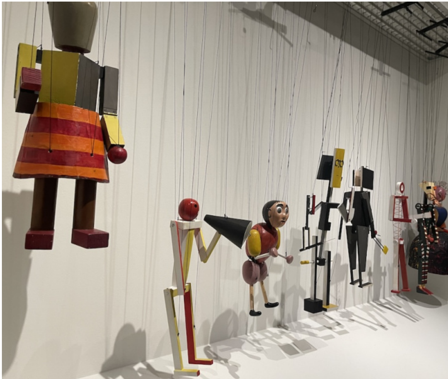
Dalla mostra Marionette e Avanguardia.

In realtà le figure sono per loro natura materia inerte: hanno bisogno di un manovratore, di un demiurgo , che dia loro vita. Sono simili a quei manichini di cui parlava Bruno Schultz nelle Botteghe color cannella : “Le nostre creature non saranno eroi di romanzi in più volumi. La loro parte sarà breve, lapidaria, i loro caratteri a una sola dimensione. [...] Il demiurgo si innamorò di materiali sperimentati, perfezionati e complessi; noi daremo la preferenza alla paccottiglia. [...] In una parola noi vogliamo creare una seconda volta l’uomo, a immagine e somiglianza di un manichino”. Dietro il fulgido Trattato dei manichini dello scrittore polacco stanno la tradizione ebraica, il Golem e il teatro delle marionette e dei burattini.