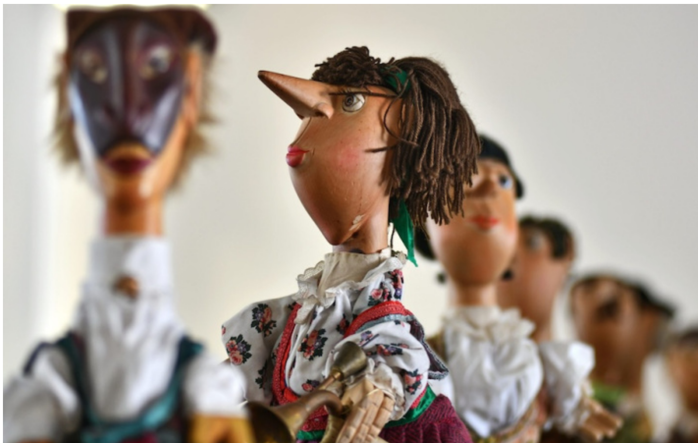
Le figure di Is Mascareddas .

La mostra rimarrà visitabile fino al 17 marzo 2024. Al suo interno, a orari precisi, si svolgono dimostrazioni sull'uso delle marionette e brevi spettacoli di marionette, a cura della storica Compagnia Carlo Colla & Figli , e di burattini, a cura di vari ensemble. Informazioni su questo link .