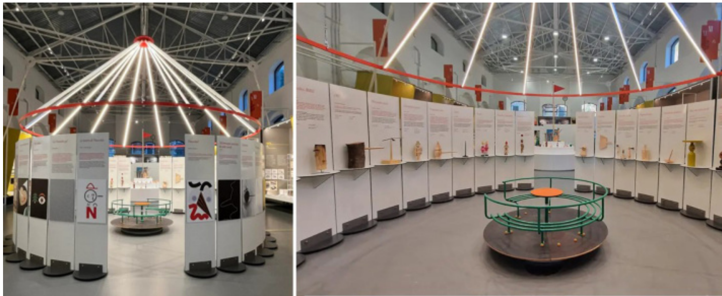
ADI Design Museum, il tendone di Mangiafuoco con all'esterno i 31 progetti di grafica e all'interno i 31 Pinocchi tridimensionali.

Il clou della kermesse è costituito dal secondo capitolo, in cui vengono presentati al pubblico 62 nuovi progetti di altrettanti artisti, 31 product designer e 31 graphic designer che si sono cimentati, su invito del curatore, nell'ideazione tridimensionale e bidimensionale di altrettanti Pinocchi.