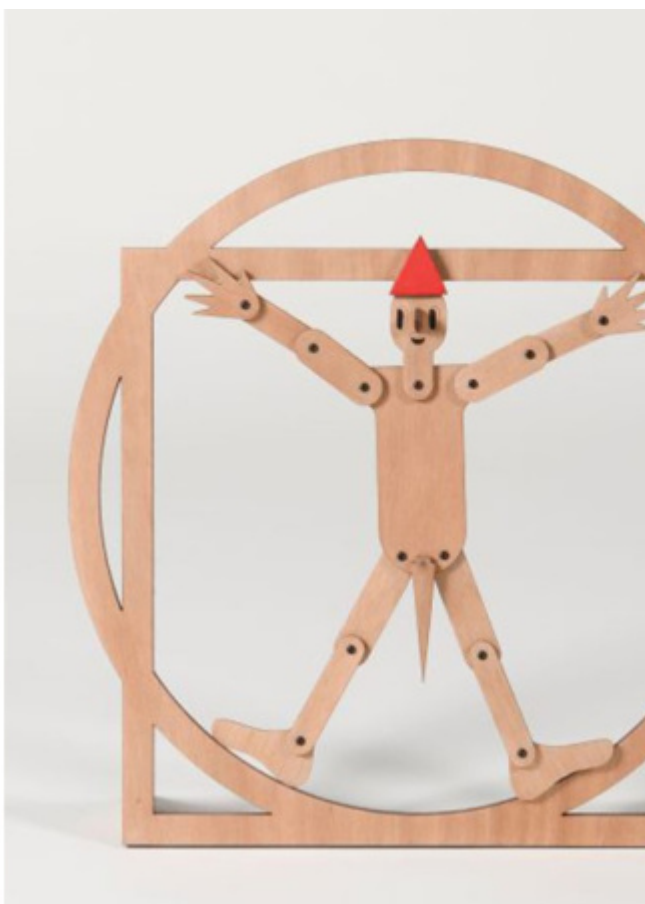
ADI Design Museum, Lorenzo Damiani, Pinocchio vola . Franco Raggi, Vitrocchio .

In fondo, qual più, qual meno, son tutti belli i Carissimi Pinocchi del circo di Mangiafuoco, perché, come ha scritto il curatore della mostra, rappresentano “un’icona aggiornata alla nostra contemporaneità. Una moltitudine di Pinocchi, con nasi che crescono e gambe che si accorciano, polemici e irriverenti, snodabili, ridotti all’essenziale (cilindro, sfera, cono), primordiali, leonardeschi, che invitano al gioco, che si prestano a giochi grafici, colorati e seri in bianco e nero, cinetici, semplicemente inutili. O meglio: utili per strappare un sorriso, per distoglierci per un momento dai nostri affanni e riportarci a pensare che ognuno di noi, per un momento nella vita, avrebbe voluto essere come il nostro burattino”.