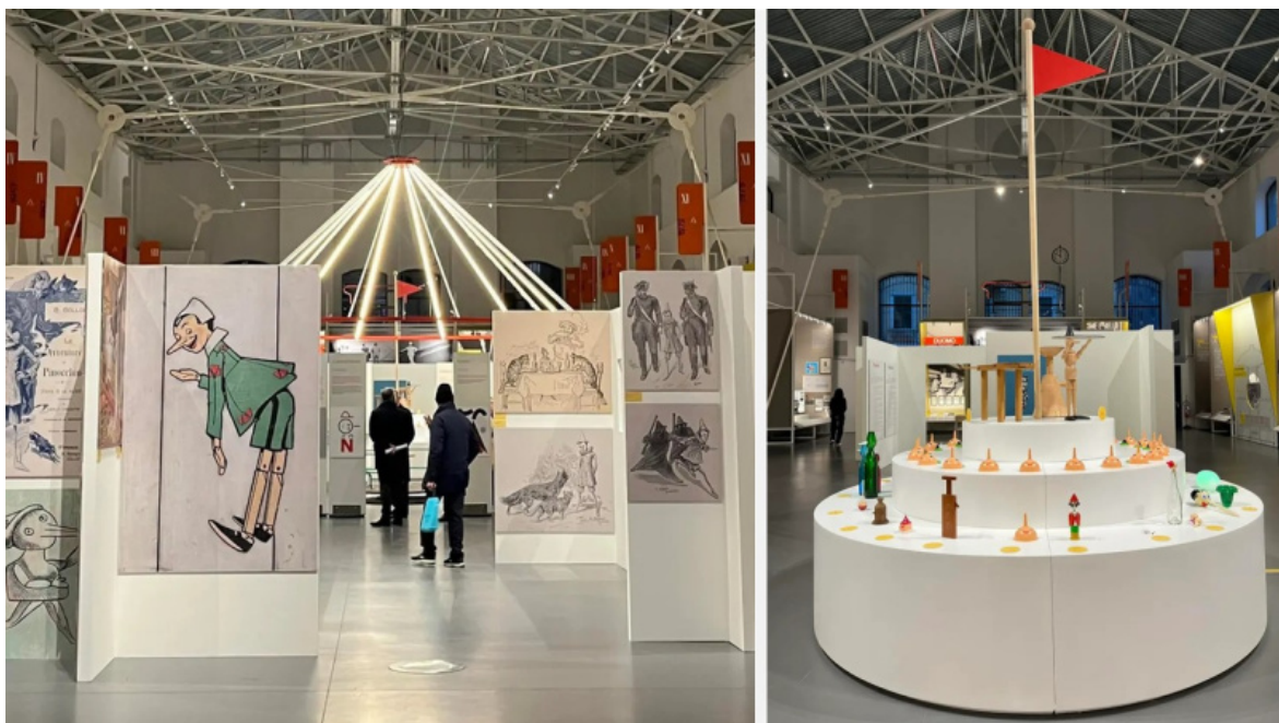
ADI Design Museum, due scorci della mostra: l'introduzione storico-iconografica e lo ziggurat con i prodotti di design ispirati a Pinocchio.

Come fosse un libro, questa rassegna espositiva, il cui titolo ci ricorda la prima strofa della canzone Lettera a Pinocchio (1961) cantata da Jonny Dorelli (autori Migliacci, Meccia) è anch'essa suddivisa in capitoli.