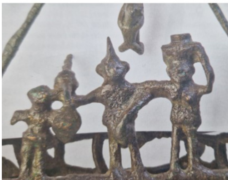
Museo Nazionale Etrusco, Villa Giulia. Bruciapfumi su ruote, dalla tomba femminile 2, necropoli di Olmo Bello, Bisenzio (Lago di Bolsena). Seconda metà VIII sec. A.C. Bronzo fuso. sotto: dettaglio di statuette antropomorfe. Da destra a sinistra moglie, marito e figlio. Cerveteri, Museo Archeologico Nazionale, vaso dipinto dal pittore dell'Eptacordo, dalla necropoli di Monte Abetone, VII sec. a.C.

A proposito della condizione della donna all'interno del suo nucleo familiare, e quindi della stessa società villanoviano/etrusca, Haynes, avvalendosi delle evidenze archeologiche, ci dimostra che fin dall'epoca villanoviana la donna era ritenuta alla pari con l'uomo. Se si osservano infatti gli elementi decorativi che ornano il bruciapfumi bronzeo rinvenuto sul Lago di Bolsena e oggi conservato al Museo Nazionale Etrusco di Villa Giulia, datato alla fine dell'VIII secolo a.C. si possono notare “sulle barre di collegamento orizzontali poste sopra le ruote, gruppi di figure, pur modellate in maniera sommaria, che rappresentano diverse attività della vita quotidiana, oltre a scene di caccia e di guerra. Su un lato, l'una accanto all'altra e della medesima altezza, [si trova un gruppo familiare costituito da moglie, marito e figlio]. La donna nuda trasporta un contenitore biconico [tipico della cultura etrusca fin dall'epoca villanoviana, destinato al trasporto dell'acqua, elemento essenziale per la vita e carico dunque di valenza simbolica] e un guerriero itifallico con elmo crestato e una lancia. [...] Accanto a loro vi è una figura più piccola che indossa un perizoma e regge uno scudo.” La medesima altezza che connota sia la figura maschile che quella femminile dimostra “che accanto all'uomo – guerriero/cacciatore/ pater familias – c'era una donna –