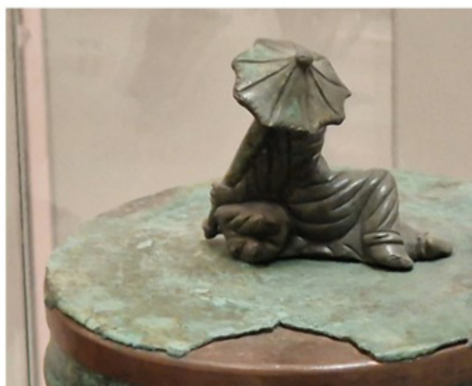
Roma, Museo Nazionale Etrusco, Villa Giulia, Piccola cista in bronzo a corpo liscio. Di probabile assemblaggio moderno ha piedi costituiti da statuette di persona con maschera teatrale; sul coperchio figuretta avvolta nel mantello con parasole”, II secolo a C.

Proprio in conseguenza della generosità mineraria del loro sottosuolo, ma soprattutto per la loro capacità di estrarre, di lavorare e di commercializzare il ferro, il bronzo e il rame, doti da loro acquisite fin dai tempi villanoviani, gli Etruschi furono molto ricchi. Amavano il lusso e non ne facevano mistero, si adornavano di gioielli preziosi, vestivano abiti ricercati molto dissimili dai semplici chitoni e pepli greci, che, in fondo, erano soltanto dei rettangoli di stoffa!