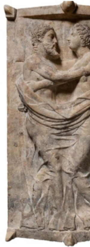
Roma, Museo Nazionale Etrusco, Villa Giulia, Sarcophago degli Sposi, terracotta policroma, 530-520 a.C. rinvenuto a Cerveteri, Necropoli della Banditaccia, zona est. Boston, Museum of fine Arts, Sarcophago di Larth Tetnies e della moglie Thanchvil Tarnai, necropoli di Ponte Rotto, Vulci, tomba dei Tetnies. Terzo quarto del IV secolo a.C.

Il sottosuolo della Toscana e dell'isola d'Elba, si sa, pullula di risorse metallifere, che già i Villanoviani avevano iniziato a sfruttare. Come ci ricorda Sybille Haynes, presso gli Etruschi: “grazie ai ricchi giacimenti minerari l'industria locale più fiorente era la metallurgia e nelle tombe sono presenti moltissimi utensili in bronzo, alcuni dei quali venivano esportati anche in Europa centrale [oltre che nei porti del Mediterraneo, ad Atene, Olimpia e in Magna Grecia], tra cui briglie e finimenti per i cavalli, vasi per banchetti, incensieri e suppellettili [...] carri, armi, armature, tutti finemente decorati, ma anche utensili con elaborate figure a tuttotondo di creature mitologiche, demoni, animali che lottano e motivi vegetali.”