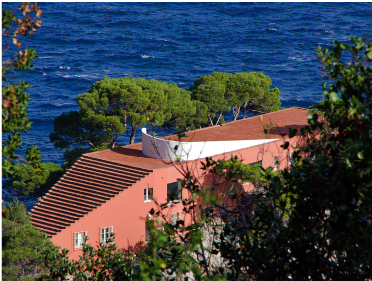
Adalberto Libera-Curzio Malaparte, Villa Malaparte, Capri, 1938-42.

Un anno dopo, nel 1964, Michelangelo Antonioni e Monica Vitti volarono in Sardegna per le riprese di Deserto Rosso sulla spiaggia rosa di Budelli. E s'innamorarono di Costa Paradiso. Insomma, tra le due abitazioni c'è un gioco, una danza, di coincidenze, ma anche di inquadrature, di campi lunghi e di particolari, di interni ed esterni, di giorni e di notti, che raccontano vite vissute e clamorosi abbandoni.