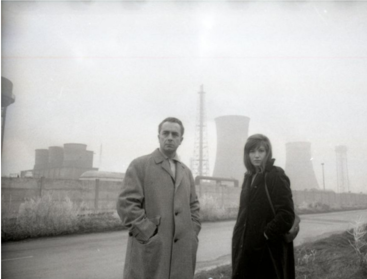
Michelangelo Antonioni e Monica Vitti sul set di Deserto rosso .

La crisi di quell'amore segnò il cambio di genere cinematografico per il regista e per l'attrice. Antonioni passò al ciclo estero con Blow-up , Zabriskie point e Professione reporter . Ancora grandi film, di pregio formale e narrativo, tra i quali Blow-up spicca per la ricerca delle inquadrature, i colori pop, il mistero della realtà imprendibile. E naturalmente il fascino della swinging London . Il film vinse la Palma d'oro a Cannes. Tra gli interpreti, con David Hammings e Jane Birkin, una giovanissima Vanessa Redgrave. La grande attrice inglese ha dichiarato: "Prima ancora di lavorare con Michelangelo, lui per me era come un dio! Quando ho saputo che mi voleva per Blow-Up ho pensato: Mio Dio, avrò un ruolo come la Vitti! Lei è un'attrice eccellente: la adoravo, volevo essere come lei, e anche bionda come lei... ma non avevo nulla di Monica! Le mie speranze infatti erano davvero scarse, e Michelangelo disse che mi voleva con i capelli neri e delle strisce bianche".