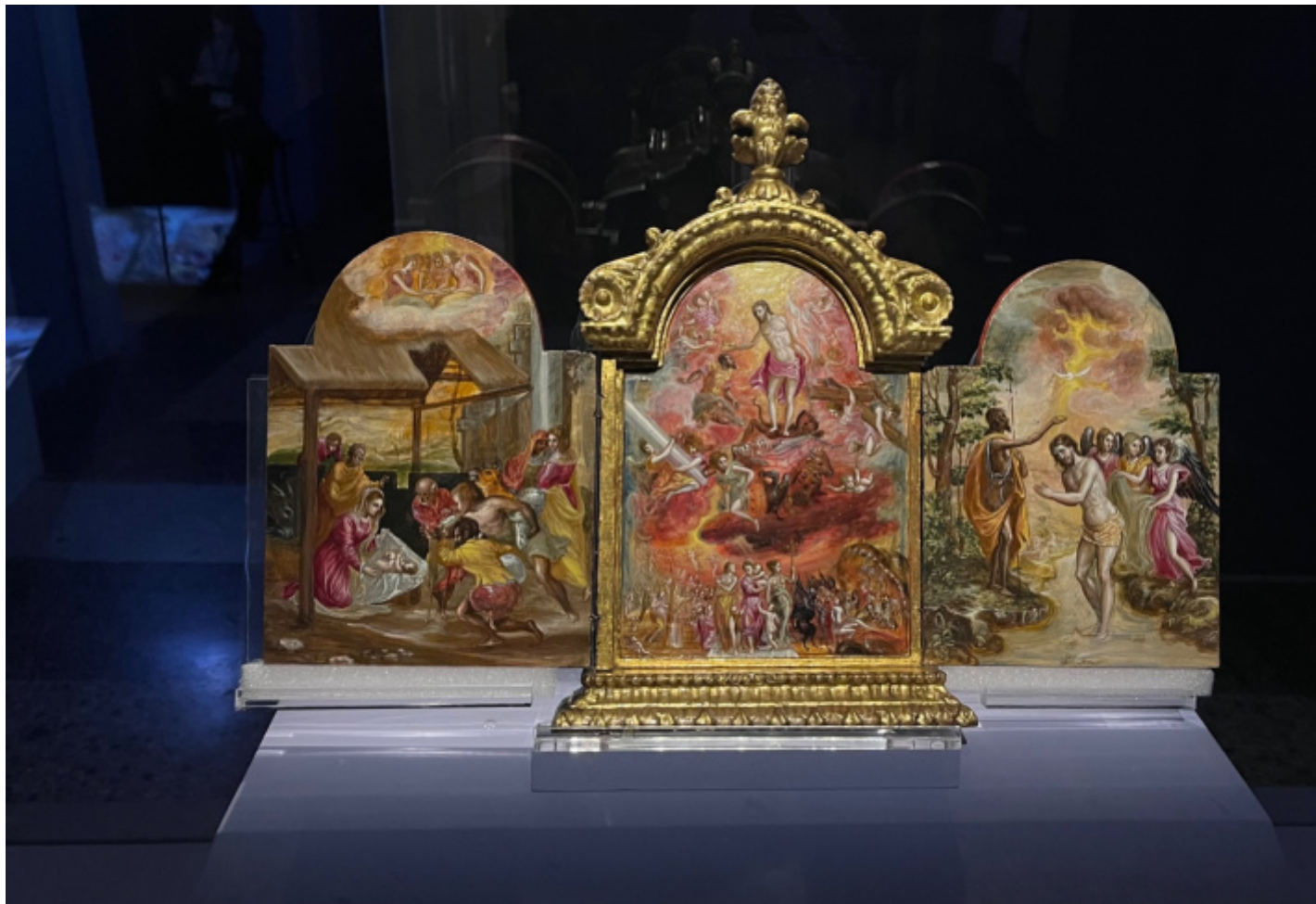
Trittico di Modena , 1567-69 circa. Modena, Galleria estense.

A Venezia frequente, sembra, l'atelier di Tiziano, ma assorbe anche la lezione di Tintoretto e Bassano (presenti in mostra con alcune opere), che poi integra con la conoscenza del contesto romano, dove, invitato nel 1570 da Giulio Clovio e presentato come dotato ritrattista (subito riconosciuto come tale anche quando si trasferirà in Spagna, dove il suo più grande ammiratore sarà nientemeno che Velázquez), viene accolto da uno dei più grandi collezionisti del tempo, il cardinal Farnese.