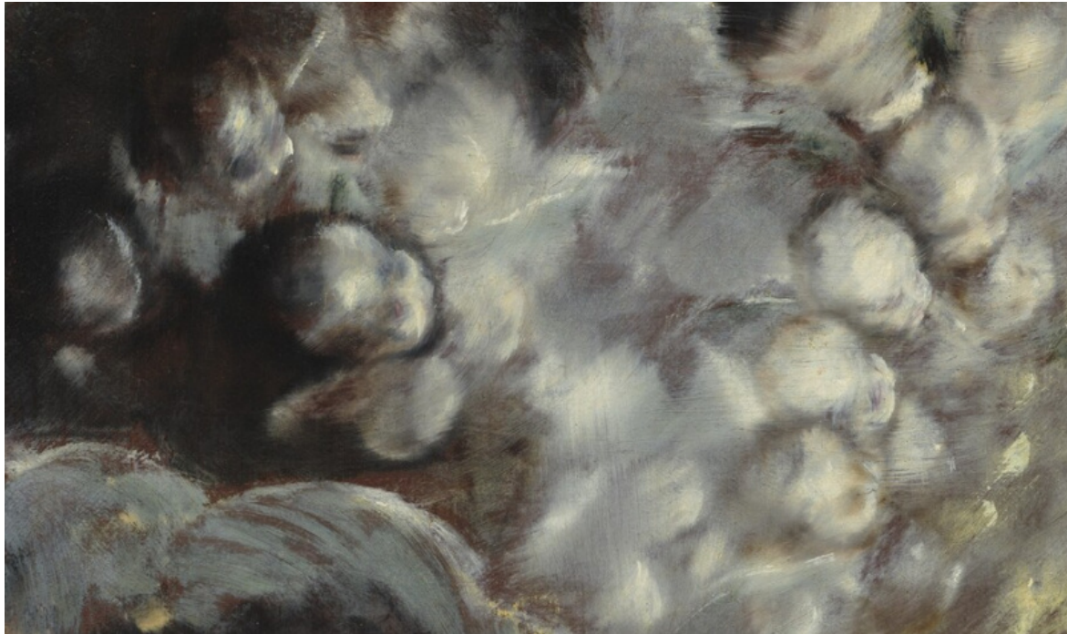
Madonna con il Bambino e le sante Martina e Agnese, Dett. 1597-99. Washington, National Gallery of Art

masse in vorticoso movimento, con gli abiti coloratissimi capolavori dell'atelier celeste al suo massimo fulgore, o mentre si addensano a migliaia e si confondono fino a non distinguersi più l'uno dall'altro e a dissolversi, vaporosi e informi come nubi, quasi che tutta l'aria non fosse composta che di loro, un infinito pulviscolo angelico che satura l'atmosfera e che noi stessi, senza saperlo, forse respiriamo.