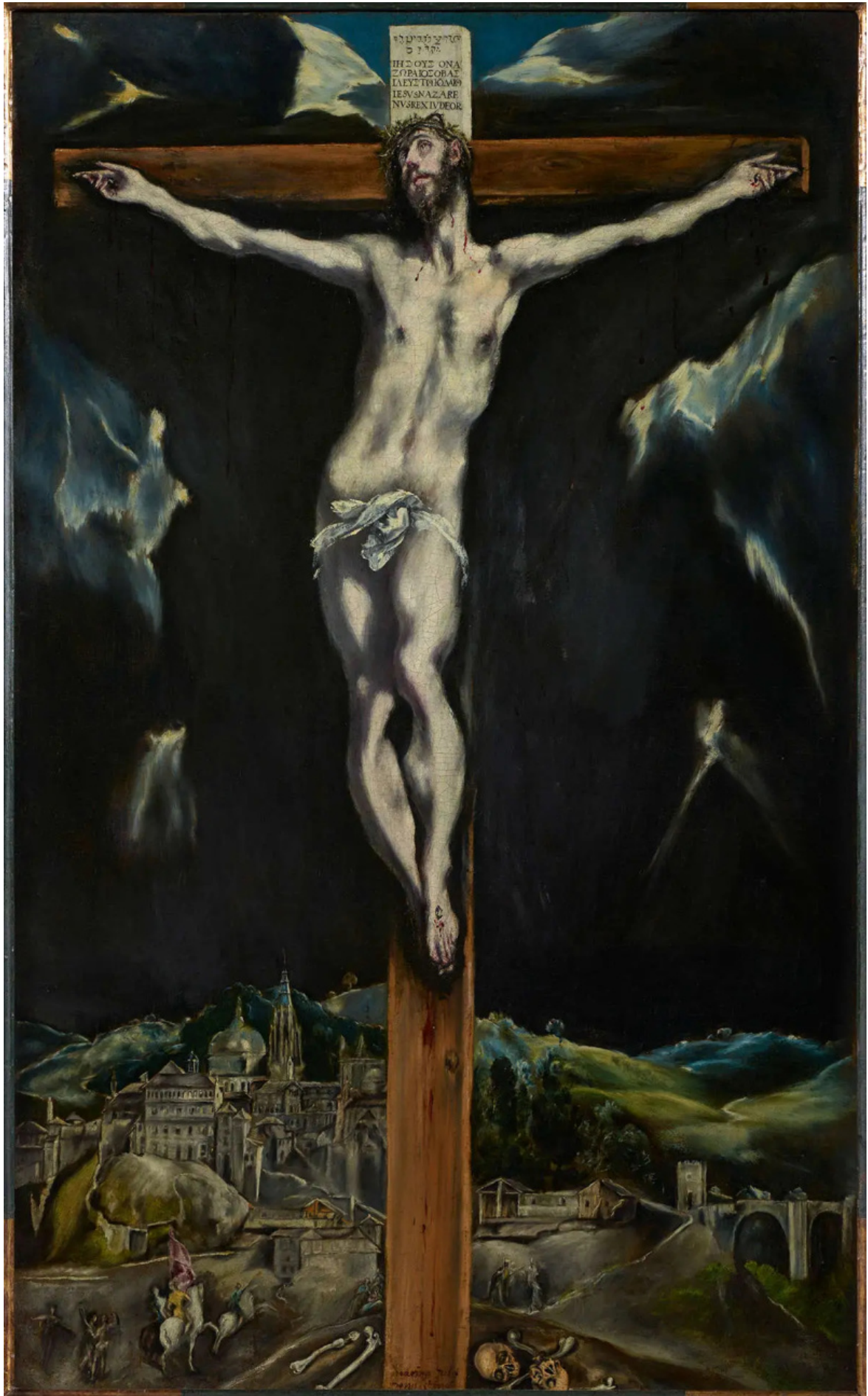
Cristo agonizzante con Toledo sullo sfondo, 1604-1614 circa. Colección Banco Santander.