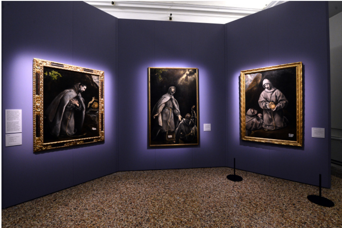
Foto allestimento con 3 quadri di San Francesco.

Non si contano gli occhi umidi rivolti al cielo, i nasi arrossati (oppure dritti e sottili, che a furia di essere rivolti in alto si appuntiscono come di tanti incipienti Pinocchietti), le palpebre gonfie, le labbra socchiuse spesso ridotte a uno sbaffo informe di carminio, e le mani contorte o atteggiare nei modi più espressivi, dove ciò che conta sono appunto solo il gesto e la postura, non la fedeltà della loro rappresentazione, che anzi spesso è volutamente approssimativa, non naturalistica, ridotta a segni affusolati senza articolazioni, a lunghe tracce di pennellate pure.