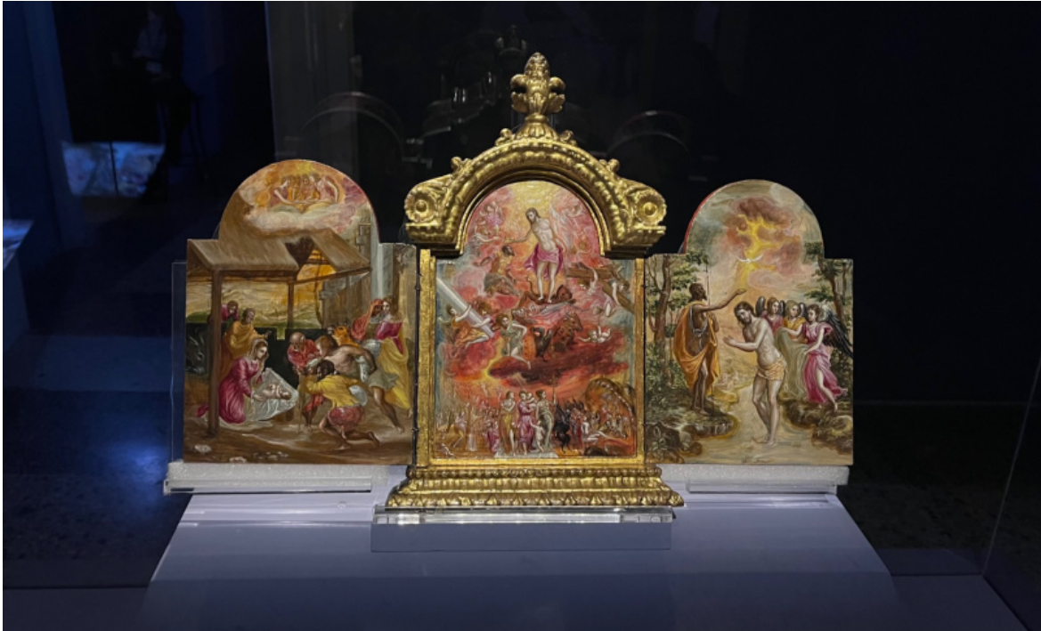
Trittico di Modena, 1567-69 circa. Modena, Galleria estense.

A Venezia frequenta, sembra, l'atelier di Tiziano, ma assorbe anche la lezione di Tintoretto e Bassano (presenti in mostra con alcune opere), che poi integra con la conoscenza del contesto romano, dove, invitato nel 1570 da Giulio Clovio e presentato come dotato ritrattista (subito riconosciuto come tale anche quando si trasferirà in Spagna, dove il suo più grande ammiratore sarà nientemeno che Velázquez), viene accolto da uno dei più grandi collezionisti del tempo, il cardinal Farnese.