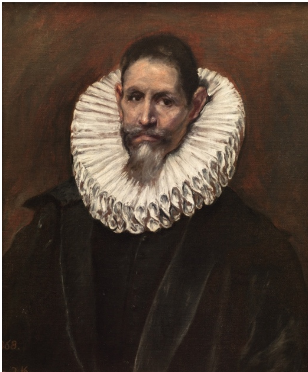
Ritratto di Jerónimo de Cevallos , 1613 circa, Madrid, Museu Nacional del Prado.

San Luca , 1602-1605 circa. Toledo, Cattedrale primaziale.