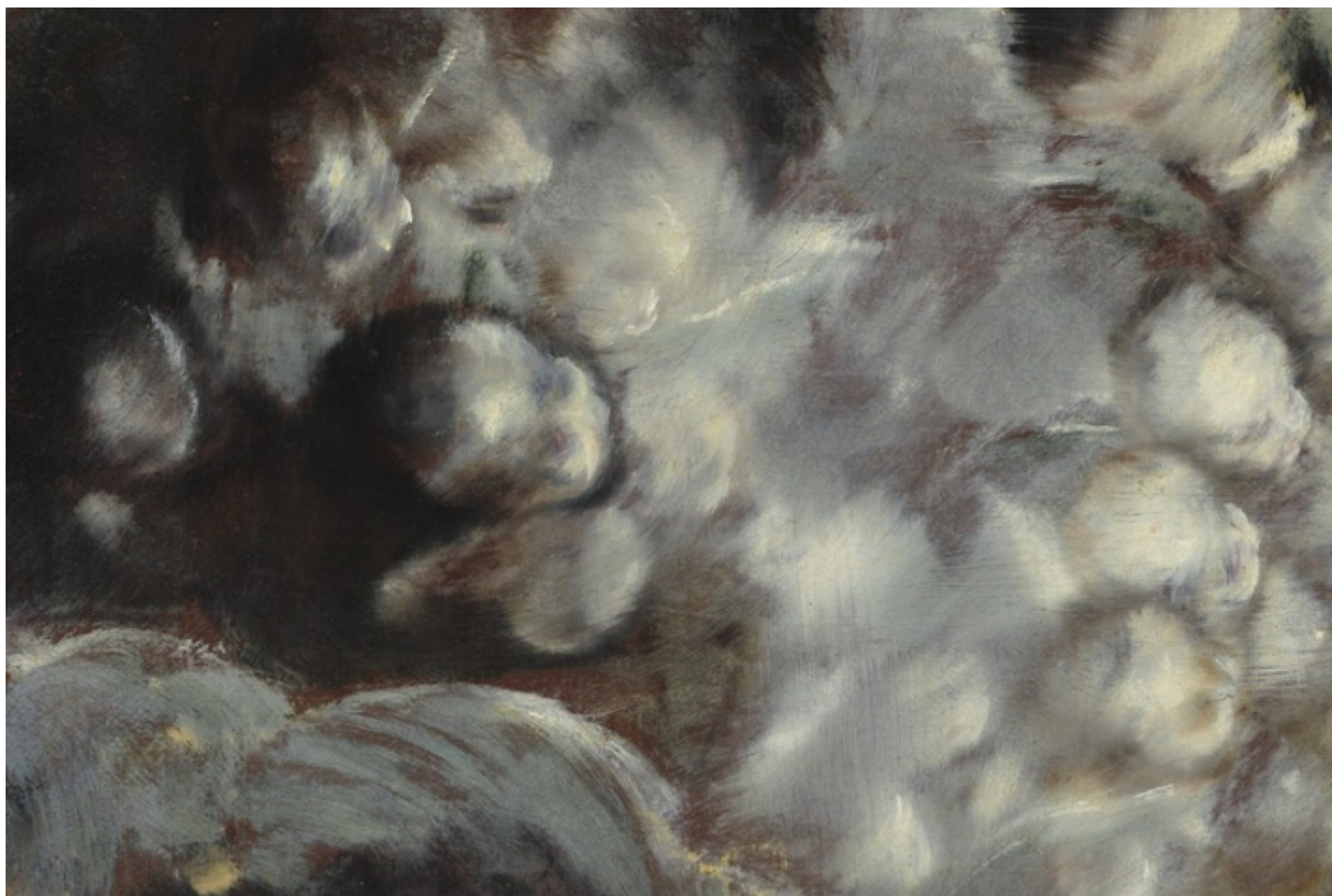
Madonna con il Bambino e le sante Martina e Agnese, Dett. 1597-99. Washington, National Gallery of Art