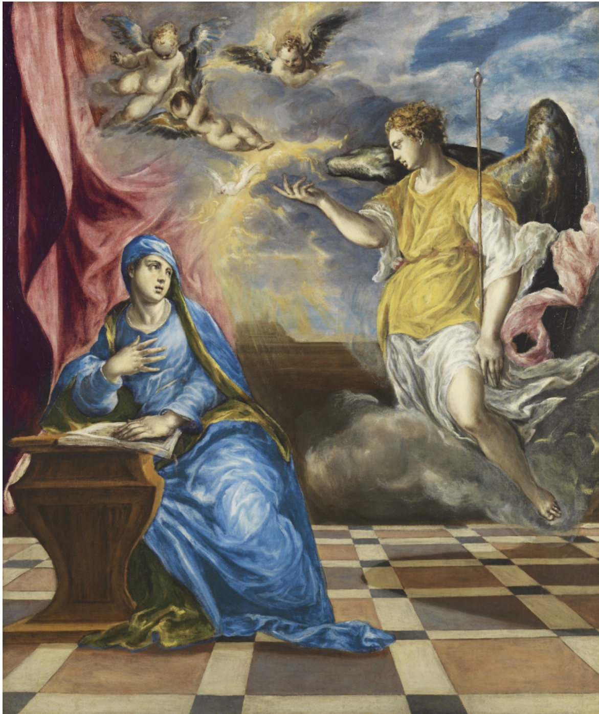
Annunciazione, 1576 circa. Madrid, Museu Nacional Thyssen-Bornemisza.

coltiverà in Spagna, dopo il suo trasferimento nel 1577, tra le quali va ricordata quella con Hortensio Paravicino, grande intellettuale e oratore suo amico intimo, che gli dedicò alcune poesie, e a cui fece un ritratto bellissimo, e soprattutto le numerosissime note da lui apposte a un'edizione di Vitruvio e alle Vite del Vasari, che mostreranno la sua avversione alla dominante concezione fiorentina e la sua preparazione anche teorica, non bastassero le opere a suggerirla.