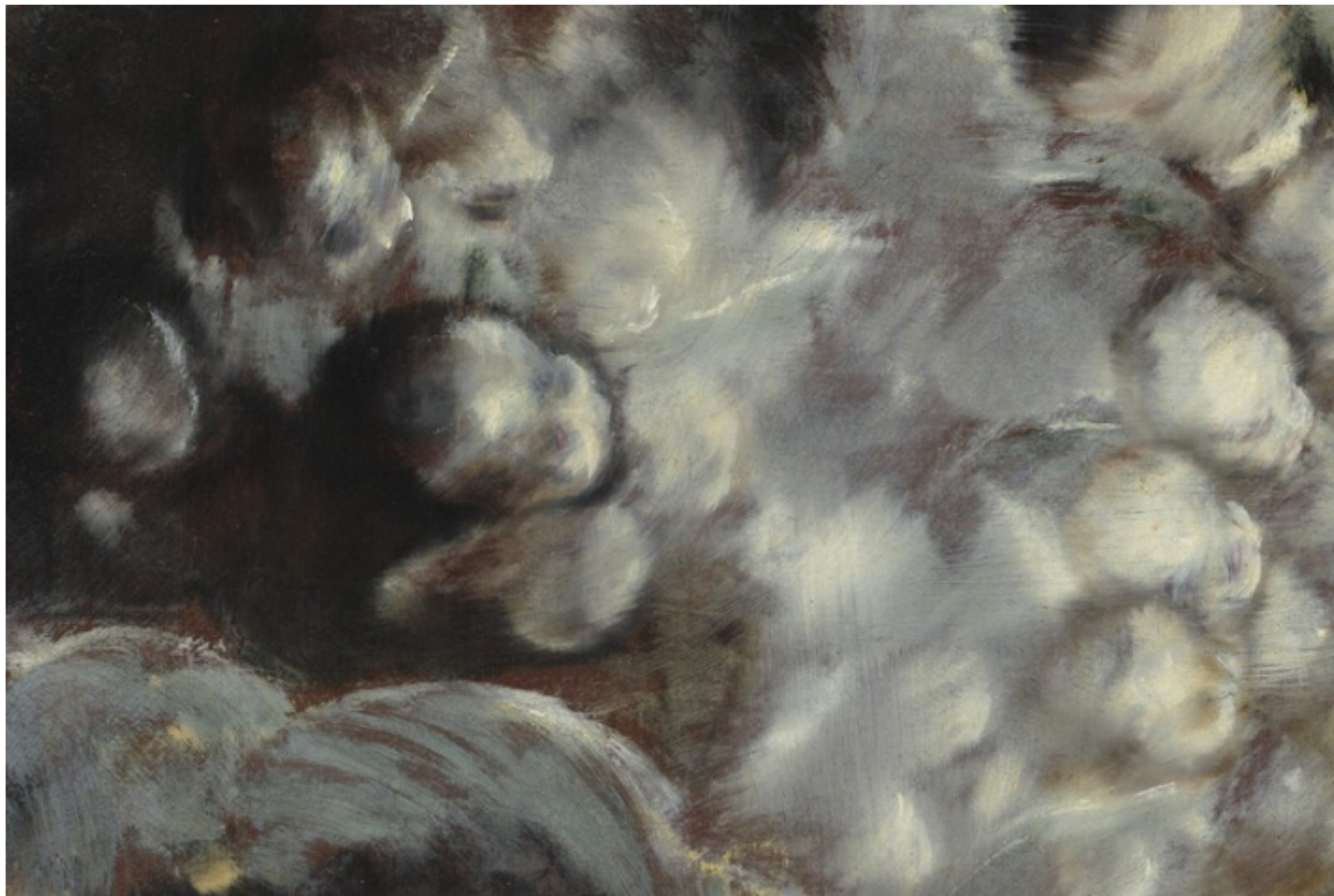
Madonna con il Bambino e le sante Martina e Agnese, Dett. 1597-99. Washington, National Gallery of Art