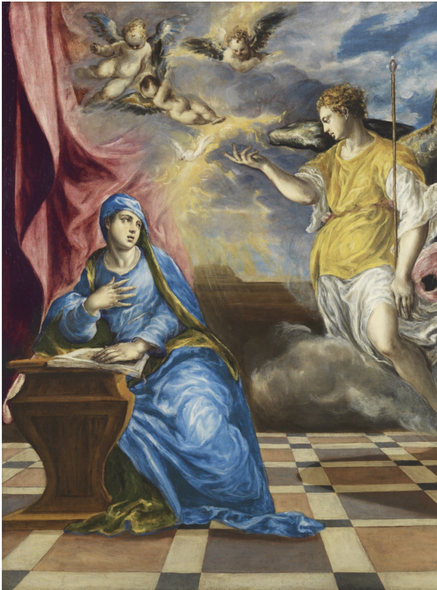
Annunciazione , 1576 circa. Madrid, Museu Nacional Thyssen-Bornemisza.