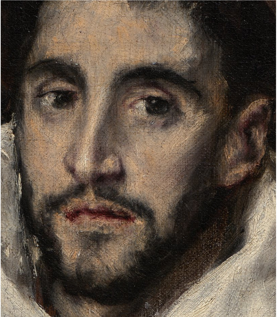
Ritratto di Hortensio Paravicino (dett.), 1609 Boston, Museum of Fine Arts.