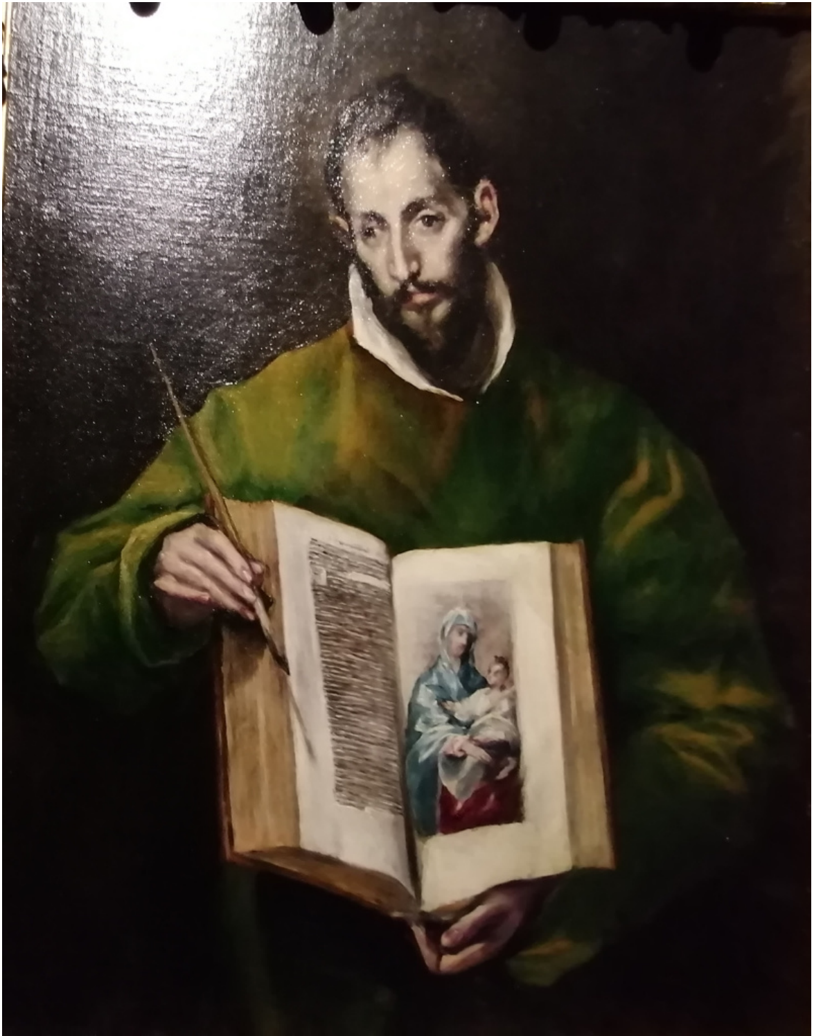
San Luca, 1602-1605 circa. Toledo, Cattedrale primaziale.