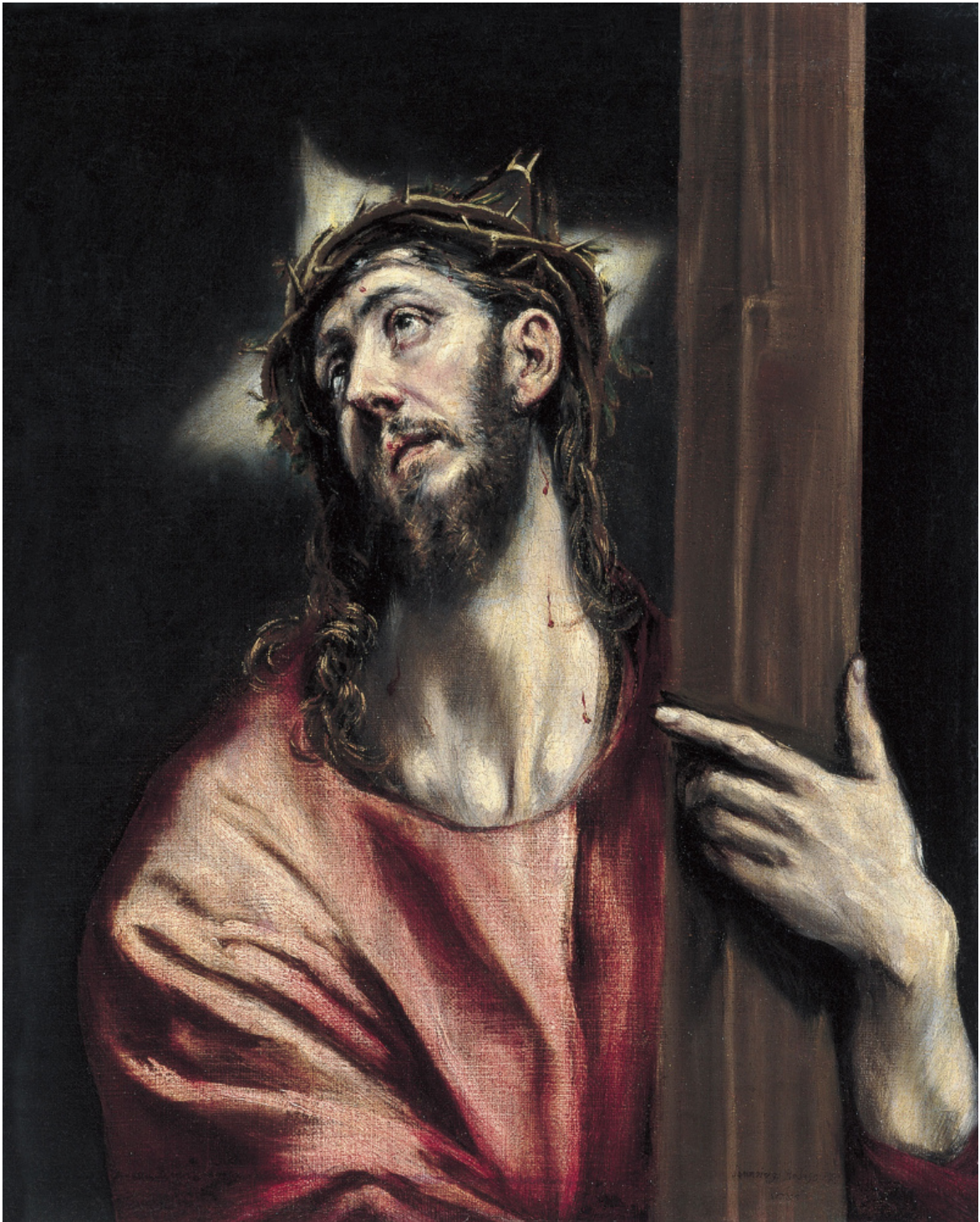
Cristo che porta la croce, 1585-1590 circa. Barcellona, collezione privata.