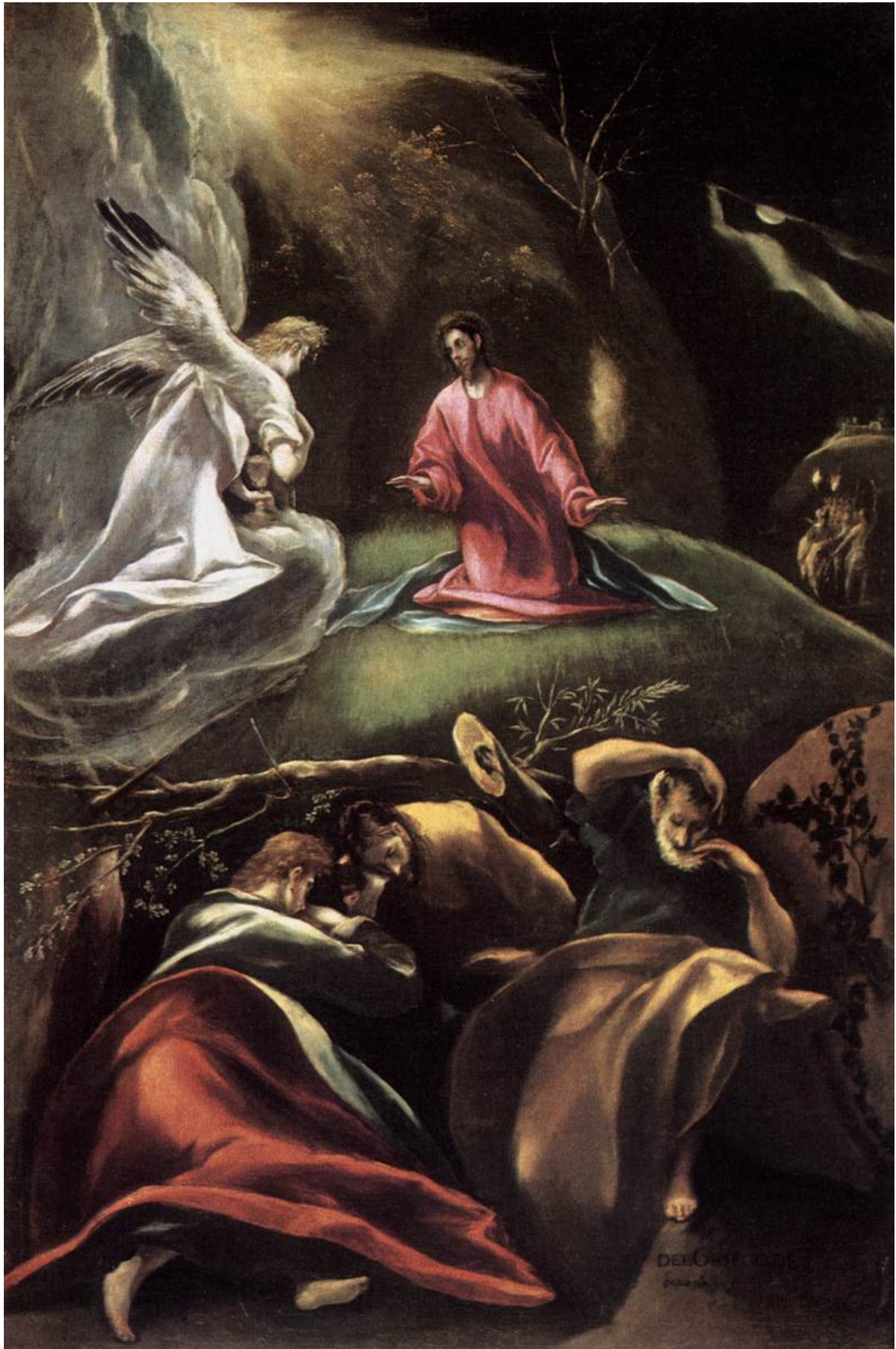
Adorazione dei pastori (dett.), 1605 circa. Valencia Museo del Patriarca.

In alto invece i cieli sono invasi da tutto un cosmo angelico, che segue le correnti ascensionali celesti e poi si installa tra le nubi a suonare, volteggiare e divertirsi