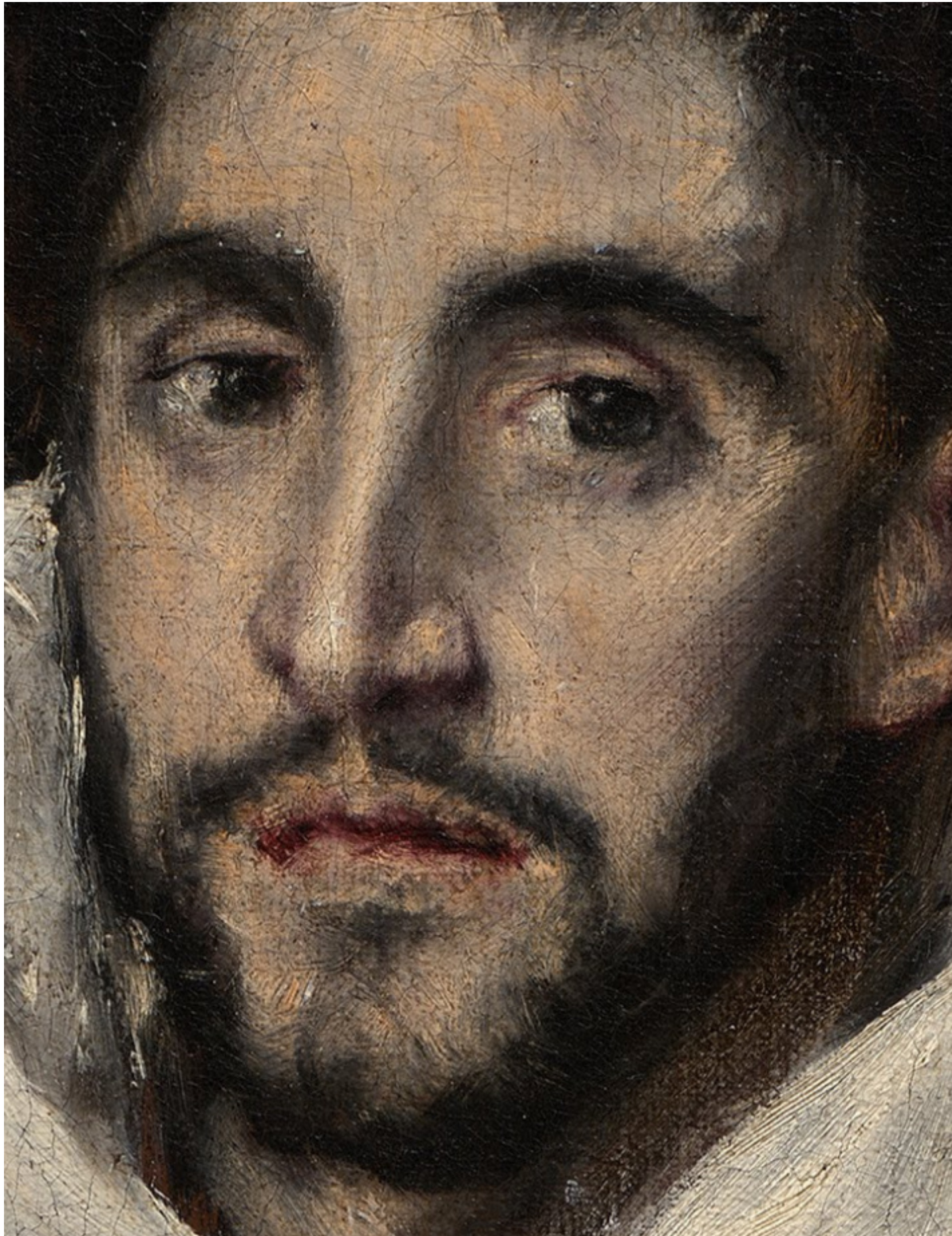
Ritratto di Hortensio Paravicino (dett.), 1609 Boston, Museum of Fine Arts.