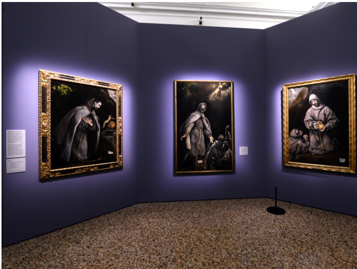
Foto allestimento con 3 quadri di San Francesco.

Cristo che porta la croce , 1585-1590 circa. Barcellona, collezione privata.