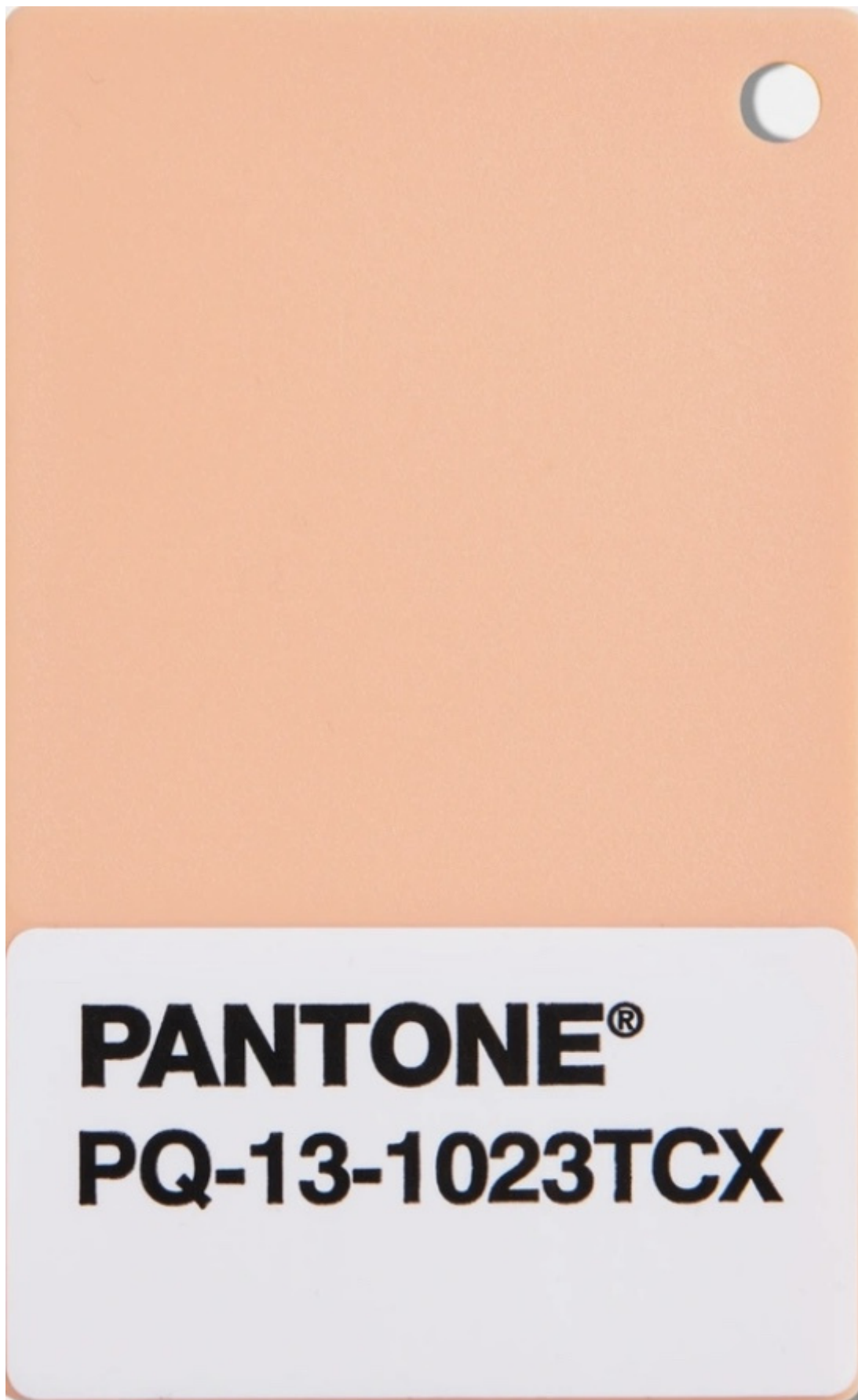
Peach Fuzz 13-1023.

La proposta del colore dell'anno da parte della ditta di colori Pantone.Inc, fondata negli anni Sessanta negli Stati Uniti ( ne abbiamo parlato per il Greenery del 2017 ), determina una serie di scelte non solo nelle aziende partner ufficiali dell'azienda per il 2024 – nel campo del design Motorola, dei cosmetici Shades By Shan, dei