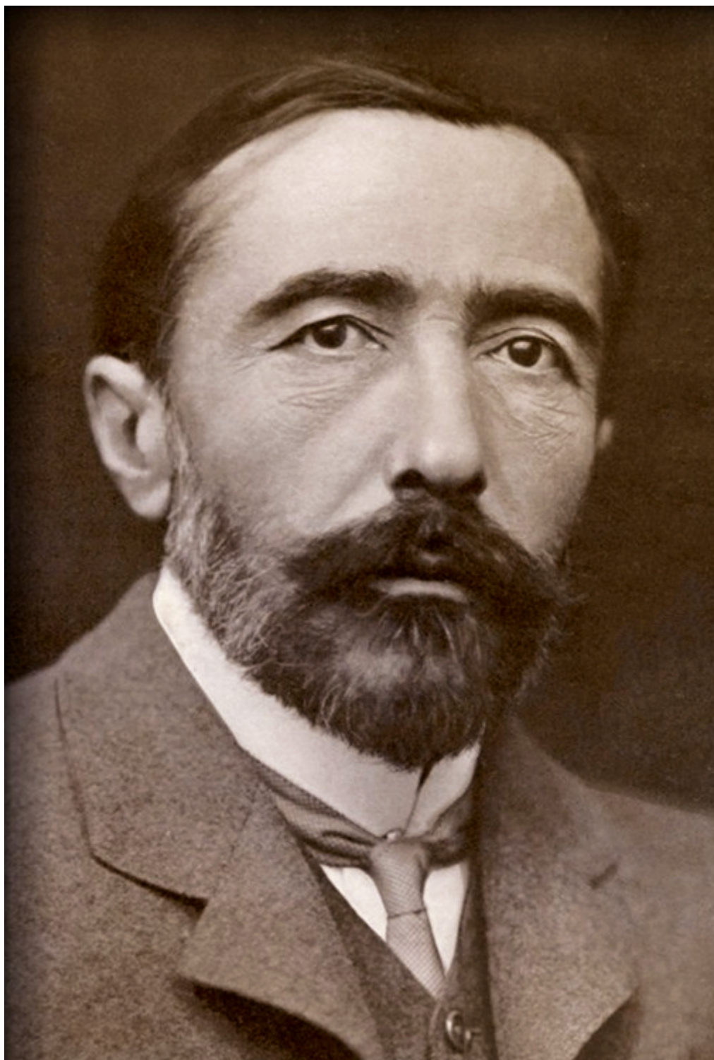
Joseph Conrad 1904