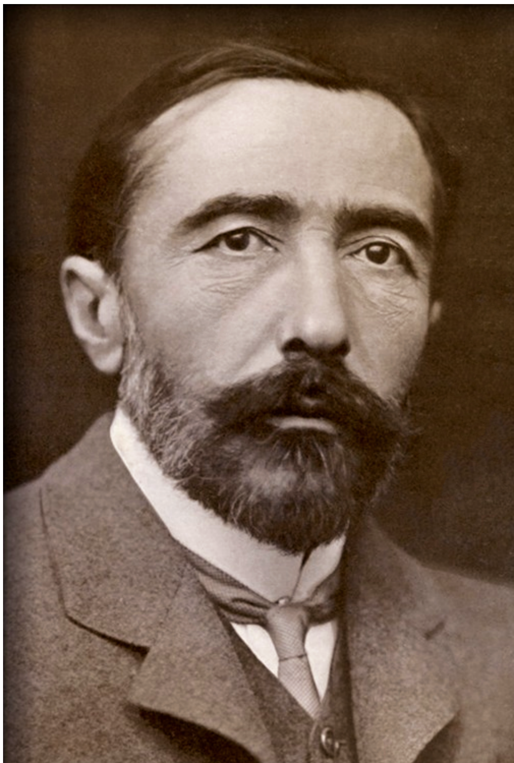
Joseph Conrad 1904