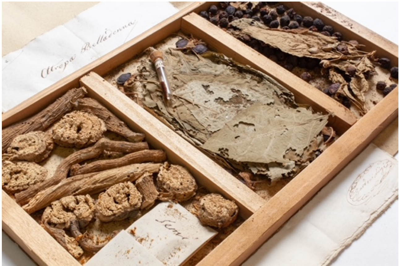
Luigi Gardoni, Erbario.

La mostra, (Catalogo ETS) che nasce dall'Orto botanico locale, è articolata in dieci sezioni che raccontano la rappresentazione del mondo vegetale nell'Europa moderna prima e dopo l'avvento della fotografia. 'Sense of wonder', stupore e meraviglia, è la definizione più esatta dell'emozione vissuta dallo spettatore confrontato alle oltre duecento immagini scientifiche tese a contrastare la 'plant blindness' che caratterizza la nostra cultura da secoli: in queste sale possiamo, come Galileo, risvegliarci dalla nostra cecità, girare le lenti del binocolo e osservare ad esempio come reagisce chimicamente all'interno una pianta quando viene attaccata da un bruco. Preziose tavole disegnate in ocre ci mostrano tutto ciò che va oltre l'aspetto fenomenico dell'albero, ovvero il suo poderoso impianto radicale, che costituisce la sua nascosta sostanza.