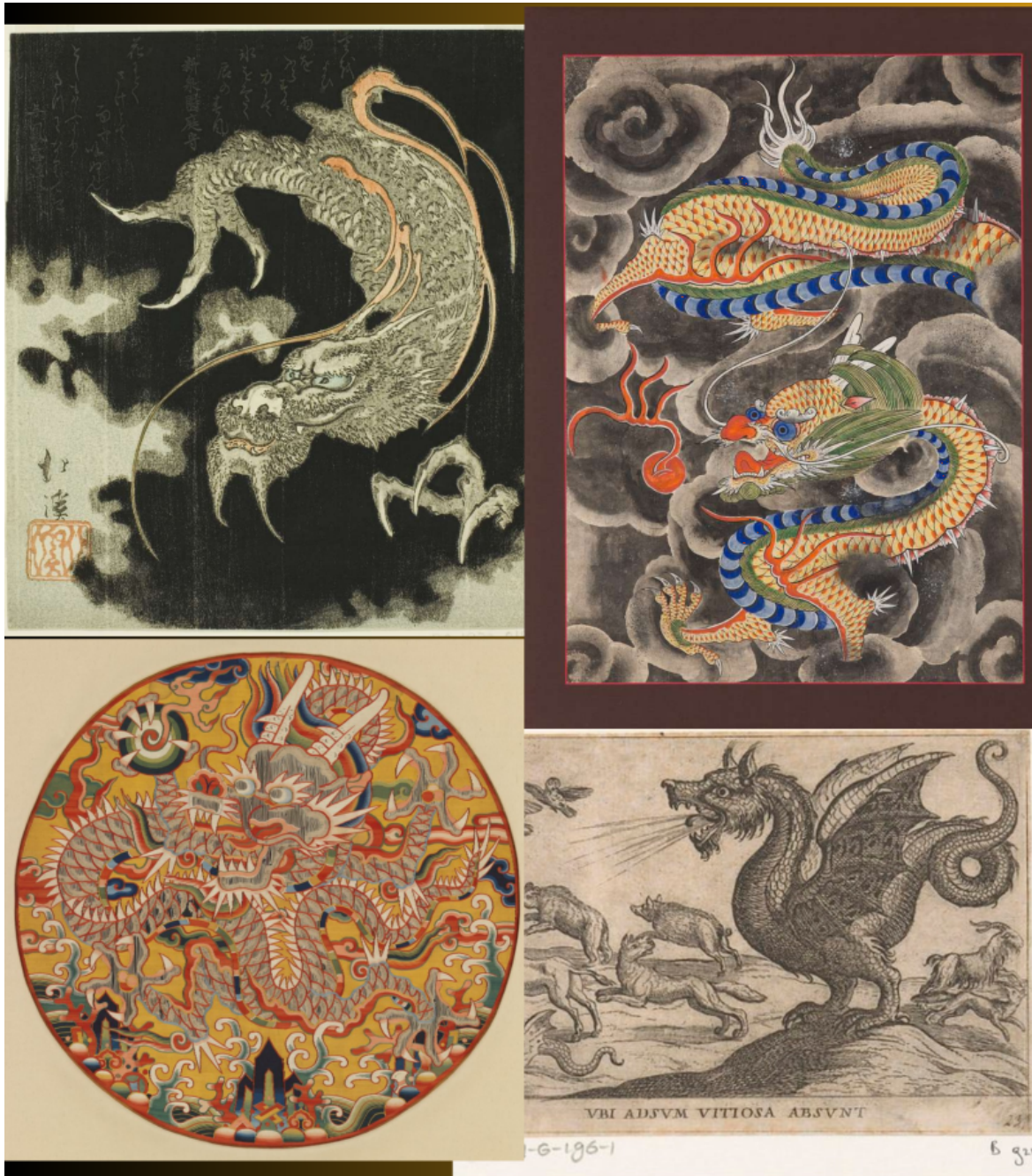
In alto, da sx: drago giapponese, coreano. In basso, da sx, drago cinese, europeo.

privilegiando un tipo di giacca tradizionale dal nome significativo Longzhuang (cinese: 龙装 = vestito del drago), o utilizzando tratti riconoscibili come una parte della tomaia delle sneakers simile alle squame, il manico di una borsa somigliante alla coda, oppure, più semplicemente il solo colore rosso, o, ancora, elementi di grande rilievo per la cultura cinese come la giada, una pietra-ancora spirituale dal multiforme aspetto.