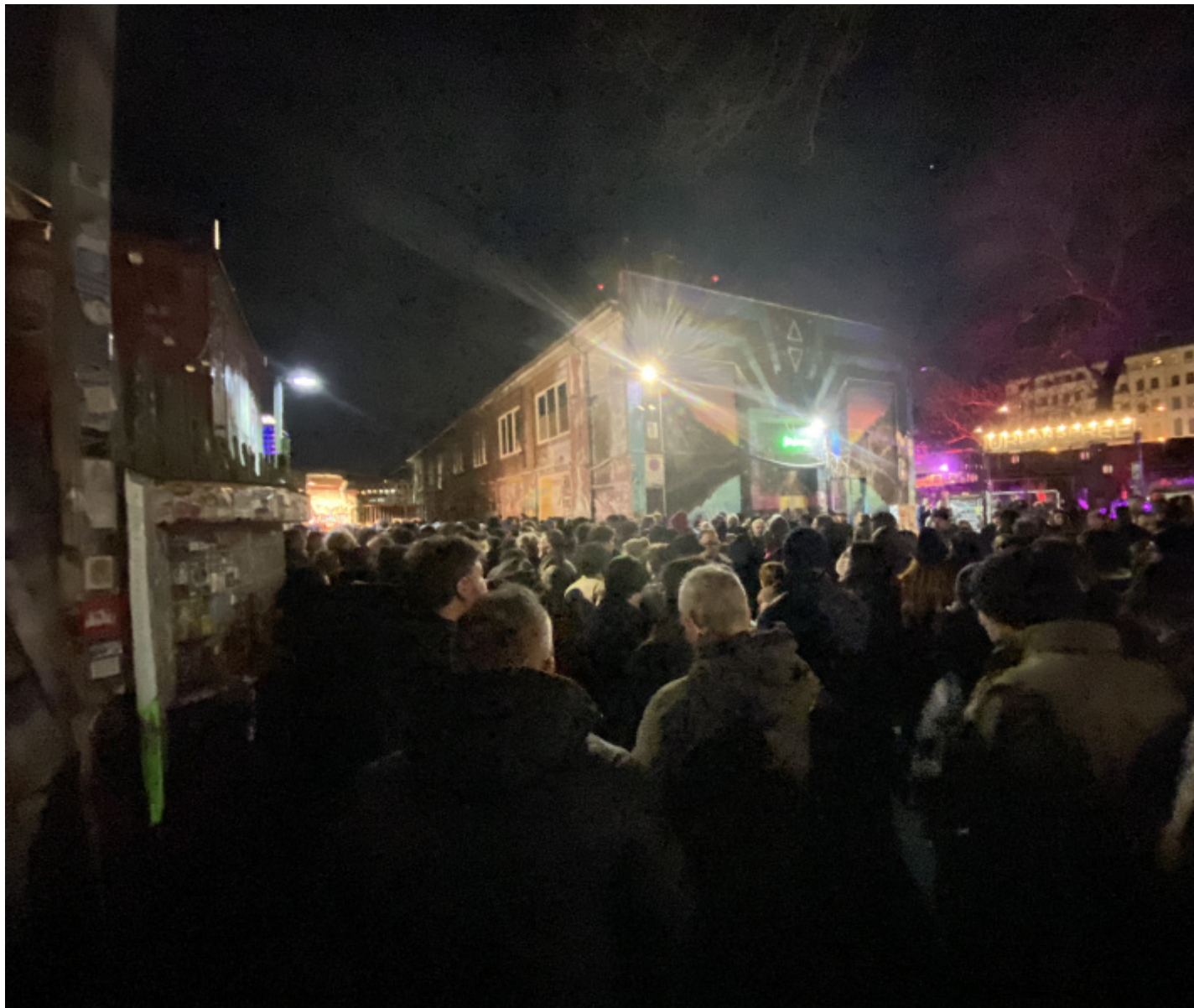
La coda per l'ingresso

Il benvenuto in DDR, nella ex casa della cultura Astra , è stato dato da una serie di lampadari “smantellati” (anche loro) proprio da quel Palazzo della Repubblica a cui si accennava in precedenza.