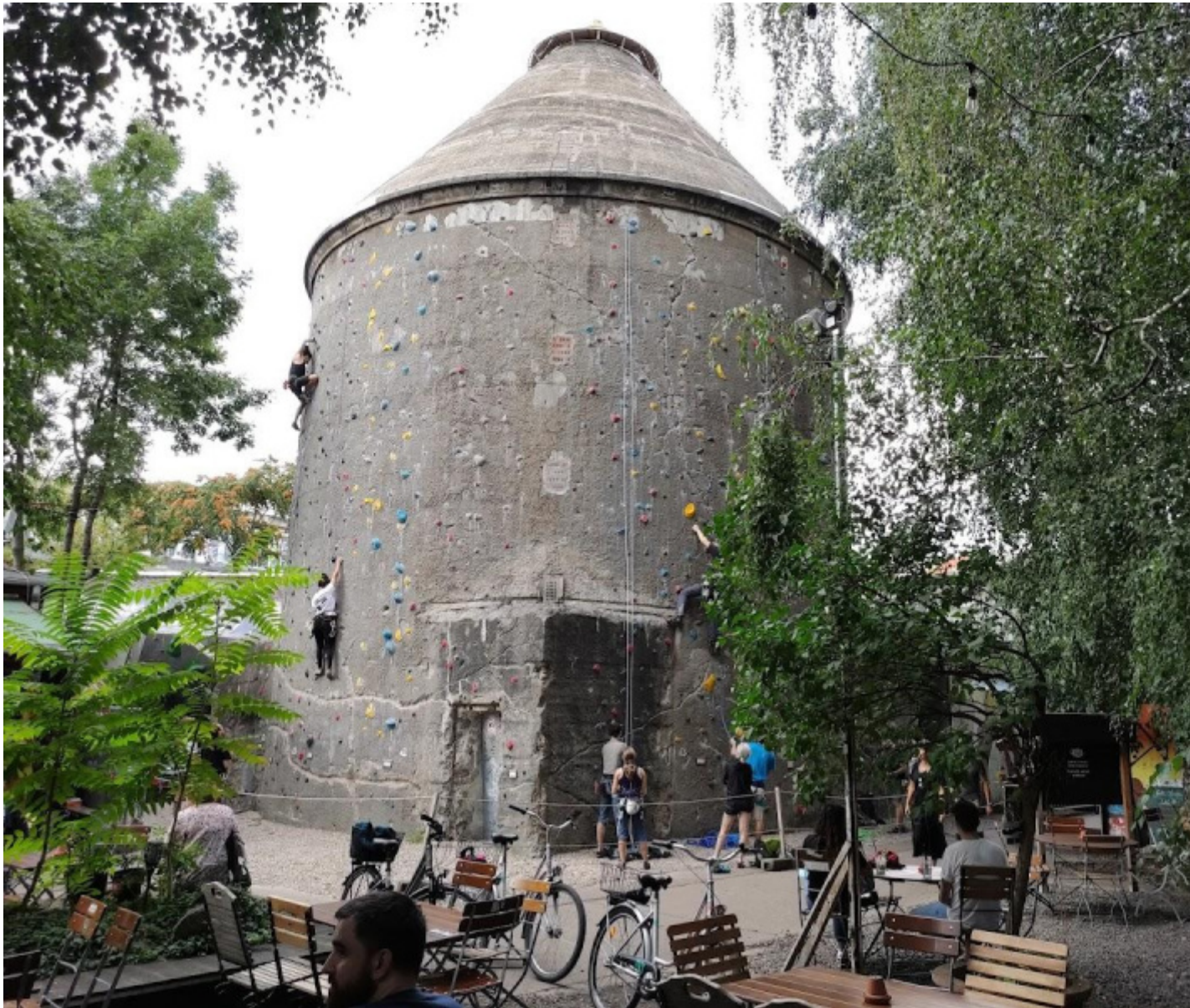
L’ex bunker trasformato in “cono da arrampicata”.

gentrificazione (la Torre di Amazon già svetta con i suoi 35 piani sul vistoso centro commerciale East Side) che mantiene, proprio sul territorio di un ex scalo ferroviario, una discreta aura di ruspante autenticità punk-proletaria. RAW, ennesima sigla, sta per Reichsbahnausbesserungswerk , una delle terribili parole composte tedesche: officina di riparazioni delle ferrovie del Reich. Fu operativa dal 1867, sopravvisse, pur con distruzioni, a due guerre mondiali. Il 31 ottobre 1991 ne fu annunciata la chiusura graduale, che durò fino al 1995, a causa della sua “alta capacità di riparazione e manutenzione nella Germania riunificata”. La prima presenza di artisti sul territorio risale al 1999. Il sito RAW è l’ultimo grande territorio industriale semi-abbandonato a Friedrichshain. Oggi la maggior parte dell’area è dedicata a strutture culturali e sportive, sale da concerto, studi e gallerie, club, punti di ristoro. Non manca un mercato delle pulci e persino un mercatino natalizio (ovviamente un sacco alternativo). Molti degli edifici sono sotto la protezione delle belle arti, compreso il famoso “cono da arrampicata”, uno dei 200 ex bunker costruiti in Germania tra le due guerre mondiali.