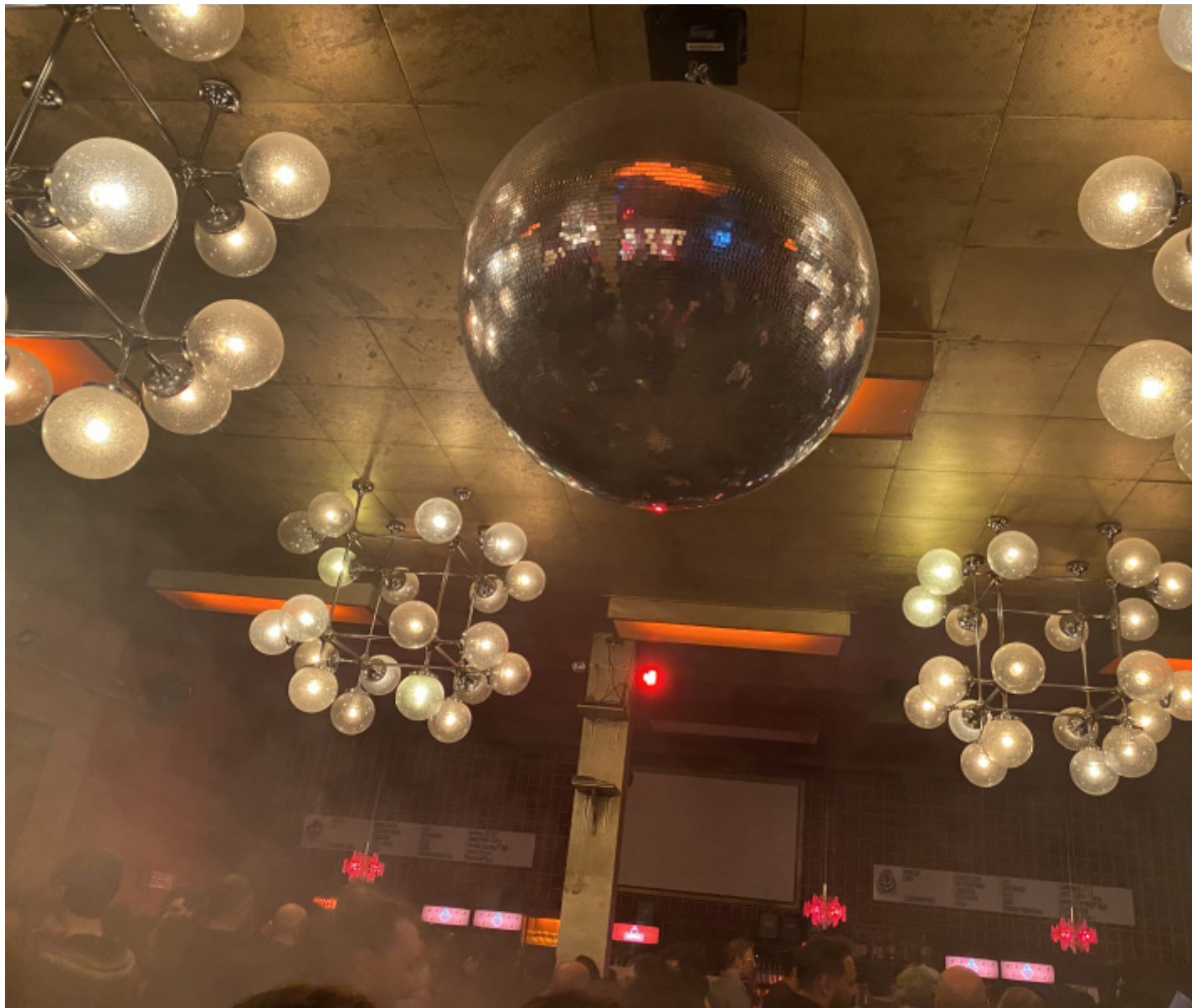
I lampadari DDR al club Astra.