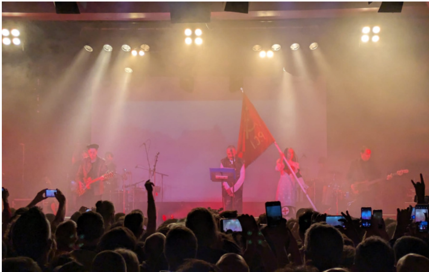
Annarella che brandisce una bandiera del PCI.

All'improvviso appare l'annunciato (e paventato) Andrea Scanzi. Bordate di fischi ininterrotti costellano il suo breve e incomprensibile (tra musica e urla dalla platea) monologo. Con ammirevole aplomb portato fino in fondo nonostante l'evidente non gradimento da parte del pubblico. Ferretti commenta recitando: "quanta voglia di poter odiare qualcuno perché ti sta sui coglioni, e lui sta qua, perché vi sta sui coglioni... non sono come tu mi vuoi, non sono come tu mi vuoi". E mostra il dito medio.