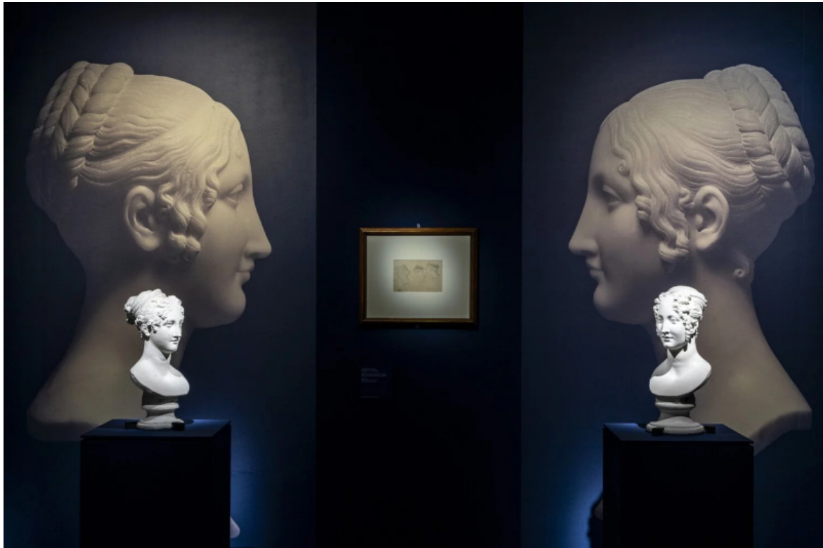
Gallerie d'Italia, Le Trecce di Faustina, Immagini di allestimento a cura di Marco Zorzanello.

forma 'a boccolo' di questa mostra, al termine della quale la Chioma di Berenice (1803) torna a parlare nei versi di Foscolo e prende corpo in alcune teste di Canova, piene di ricci inanellati in cui già s'intravedono gli intrecci delle Grazie . A guidarci lungo il percorso espositivo sono insomma le traiettorie dei capelli: fra alto e basso, spirito e materia, antico e moderno, simulacri e donne in carne e ossa.