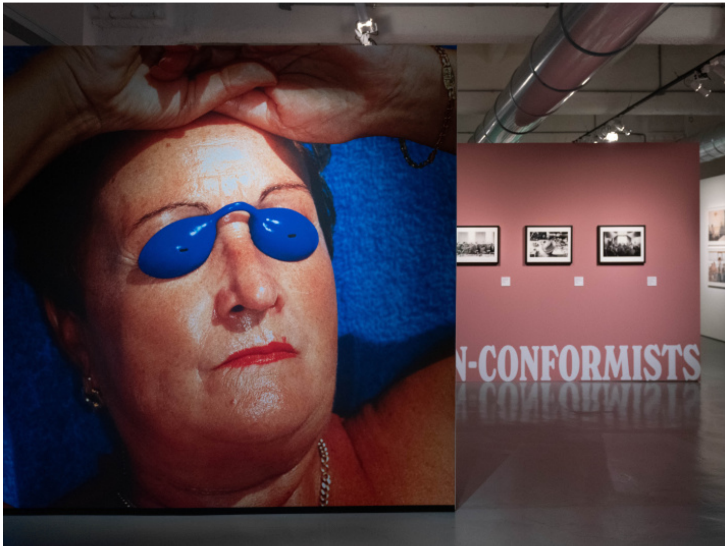
Martin Parr, Short & Sweet, MuDEC, © Carlotta Coppo.