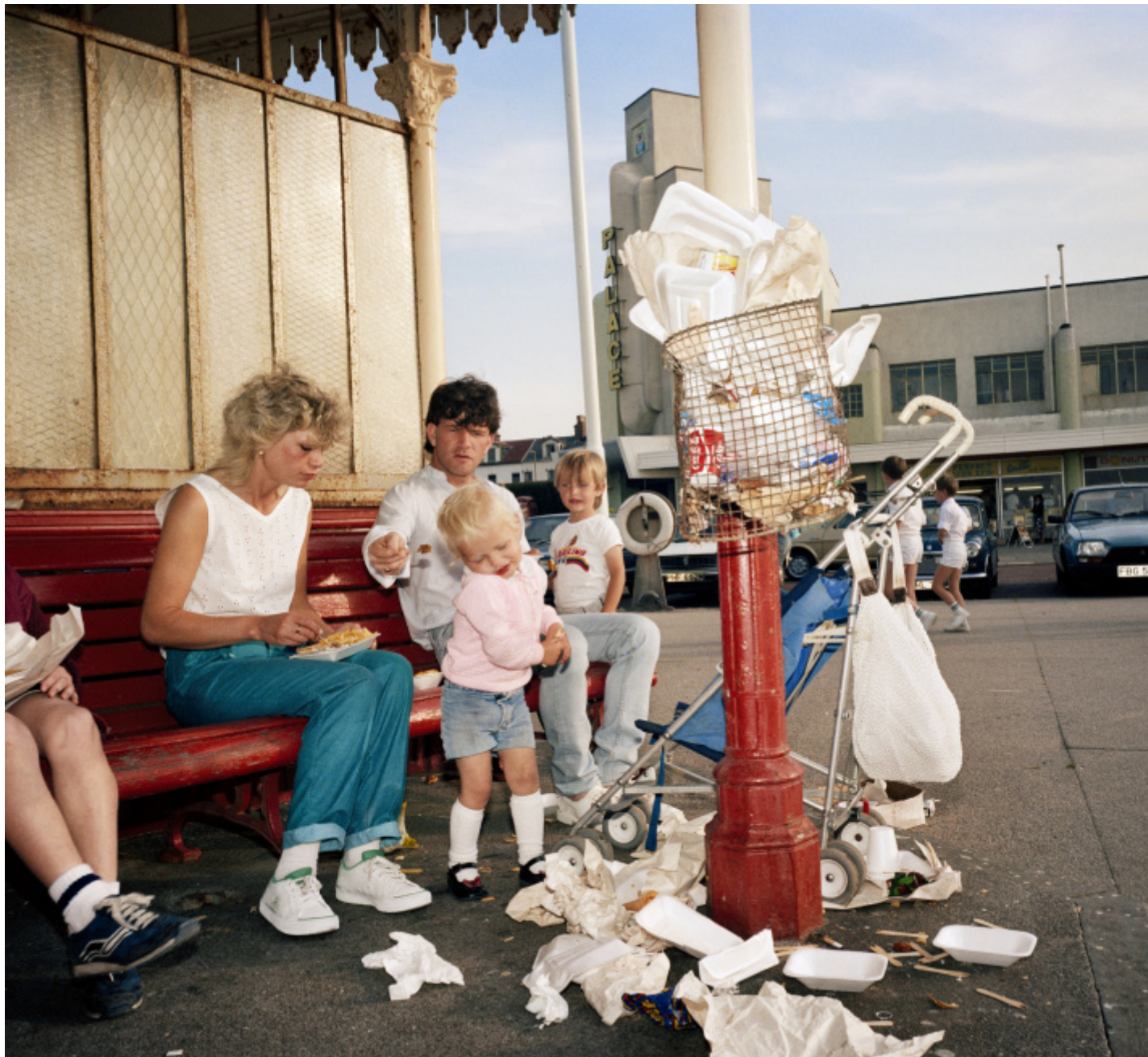
Martin Parr, New Brighton, 1983-85, da "The Last Resort" , ©Martin Parr/Magnum Photos.

Il successo sopraggiunge invece, senza più riserve, con Small World (1989–2012,) dedicato al turismo di massa cui nessuno prima di lui sembrava aver fatto caso. Un turismo basato sul principio fondamentale di andare tutti a vedere gli stessi luoghi "cinque stelle" sparsi per il mondo e abbondantemente pubblicizzati come tali; poi comprare valanghe di souvenir che li rappresentino su strofinacci e magliette; e soprattutto fare un'orgia di fotografie che immortalino parenti, amici e se stessi davanti ai più celebri monumenti. A piazza San Marco una signora impavida inquadra chissà cosa con la sua fotocamera mentre è letteralmente assalita da ben quattro piccioni che sembrano apprezzare soprattutto la sua testa. Riuscirà mai nel miracolo di vedere qualcosa al di là delle zampe di questi sfacciati volatili? Al Parco Güell di Barcellona una folla si accalca e si autofotografa mentre tocca un mosaico come se fosse un portafortuna; ma di guardare con un minimo di attenzione l'opera grandiosa del povero Antoni Gaudí non se ne parla neppure. Per disgrazia ho avuto anch'io l'occasione di visitare il Parco Güell intruppata in un gruppo di turisti. Stavo iniziando a osservarlo con ammirazione ed ecco partire un bel colpo di fischiello e via, tutti subito sul pullman soddissfatti, tranne me semplicemente furibonda.