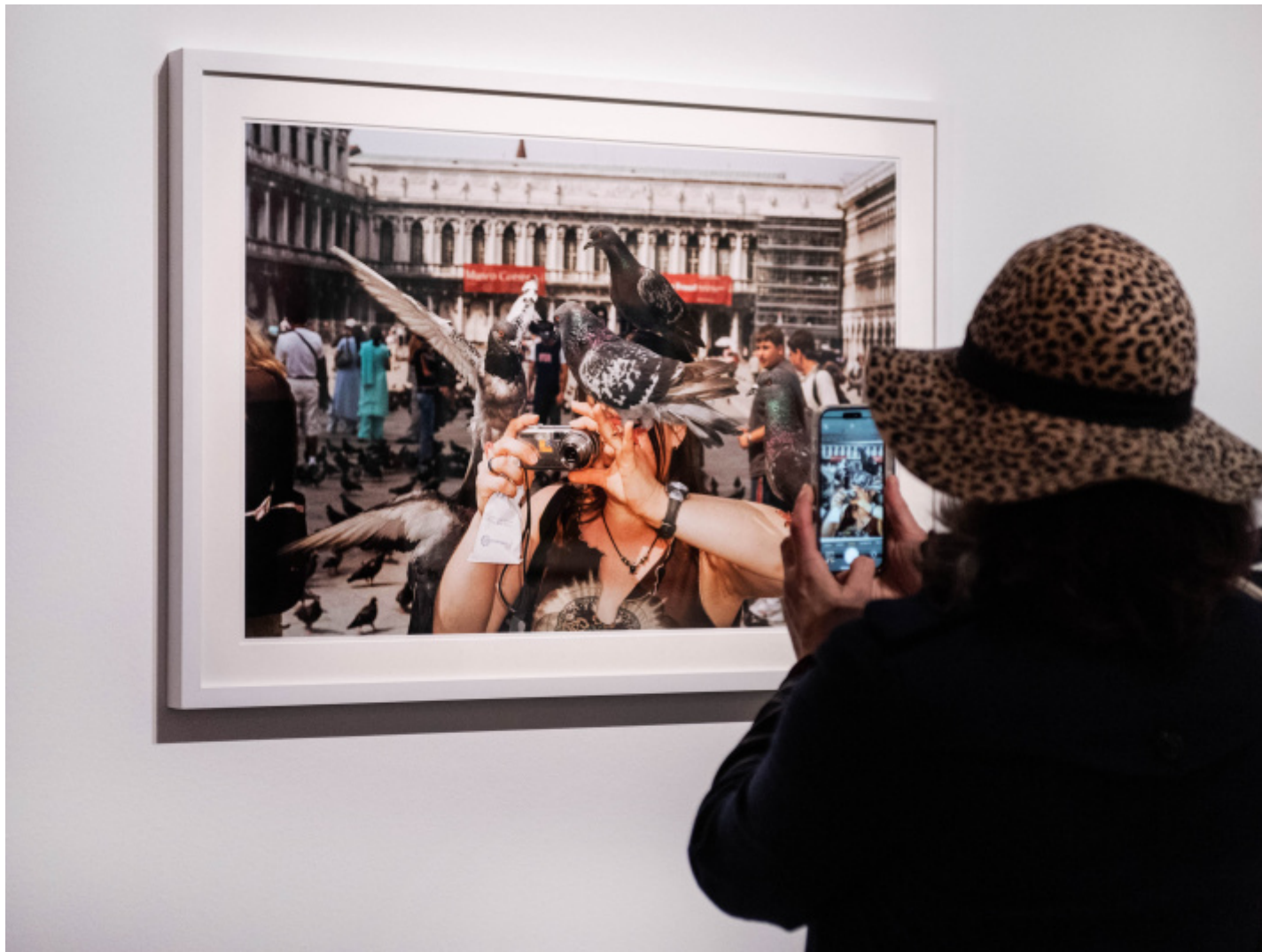
Martin Parr, Mudec, © Carlotta Coppo.