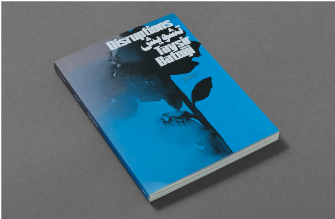
Disruptions , © Taysir Batniji 2024 courtesy Loose Joints.