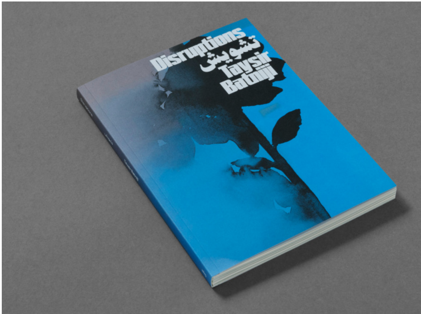
Disruptions, © Taysir Batniji 2024 courtesy Loose Joints.