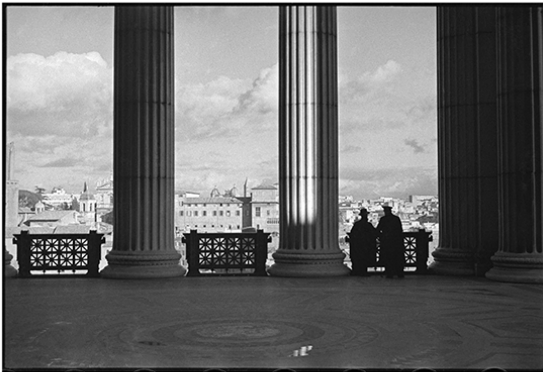
Roma, Terrazza del Monumento a Vittorio Emanuele II, 1935/1938.

Un dialogo tra uomo e paesaggio che contiene una malinconia. Come i due uomini affacciati alla terrazza del Monumento a Vittorio Emanuele II. Da lì guardano Roma, di schiena, parlano di quanto la città stia cambiando, dei tempi, chissà. La diversa forma dei loro cappelli dice la distanza tra le rispettive opinioni. Due uomini con una posizione, forse un qualche potere. Ma le sagome nere ingrossate dal pastrano sono niente rispetto alle maestose colonne del loggiato. C'è troppa calma. Qualcosa si prepara altrove, mentre la luce pare quella di sempre. Uno dei due chiede all'altro: la senti anche tu una cosa che incombe?