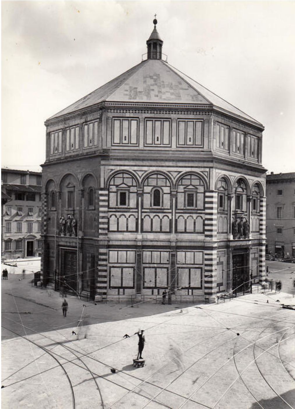
Firenze, Battistero di San Giovanni, 1939/1943.

pubblicazioni sulla scultura rinascimentale e in particolare per il cosiddetto Florenzbuch , un monumentale libro mai ultimato a causa della morte dello stesso Kriegbaum durante il bombardamento di Firenze nel 1943. Ma Hilde si era già fatta notare per la sua professionalità, per esempio con il progetto (anch'esso esposto in mostra) sui Castelli di Federico II nell'Italia meridionale diretto dallo storico dell'arte Leo Bruhns.