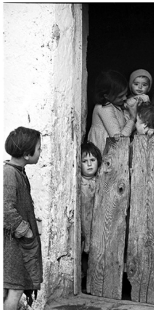
A sinistra, Firenze, cortile di Palazzo Strozzi, 1939/1943. A destra, Gruppo di bambini, 1935/1938.

La prima sezione è dedicata a riprese panoramiche, colte spesso da punti di vista inconsueti, di Firenze, Bologna, Padova, Roma. Riproduzioni di edifici, elementi architettonici e dettagli di sculture e bassorilievi. E ancora, linee dal gusto grafico, come il profilo di una scalinata o l'ombra di colonne su altre colonne. È una fotografia al servizio della storia dell'arte, in cui si nota un flusso di lavoro disciplinato e una profonda conoscenza delle opere. Una "giusta distanza" rende le immagini neutre, funzionali all'intento documentario. Al contempo, sottilmente, si riconosce una mano – un occhio – esperti, uno stile. Hilde Lotz-Bauer, funambola di talento, si mantiene in bilico tra il rispetto dei ruoli e l'inevitabile reinterpretazione personale di linee, colori e forme. Sa che la corretta fotografia di architettura è la restituzione fotografica del disegno di una prospettiva, la riproduzione esatta di cosa vedrebbe l'occhio umano. Cosa non semplice, allora come oggi. Tutto dipende dalla posizione del luogo di ripresa, della focale e quindi dell'angolo di inquadratura, dalla scelta del punto di vista e dal piano della pellicola. Una sorta di funzione a più variabili di cui va trovato di volta in volta l'ottimo per evitare la distorsione delle linee o sgradevoli effetti di accelerazione prospettica.