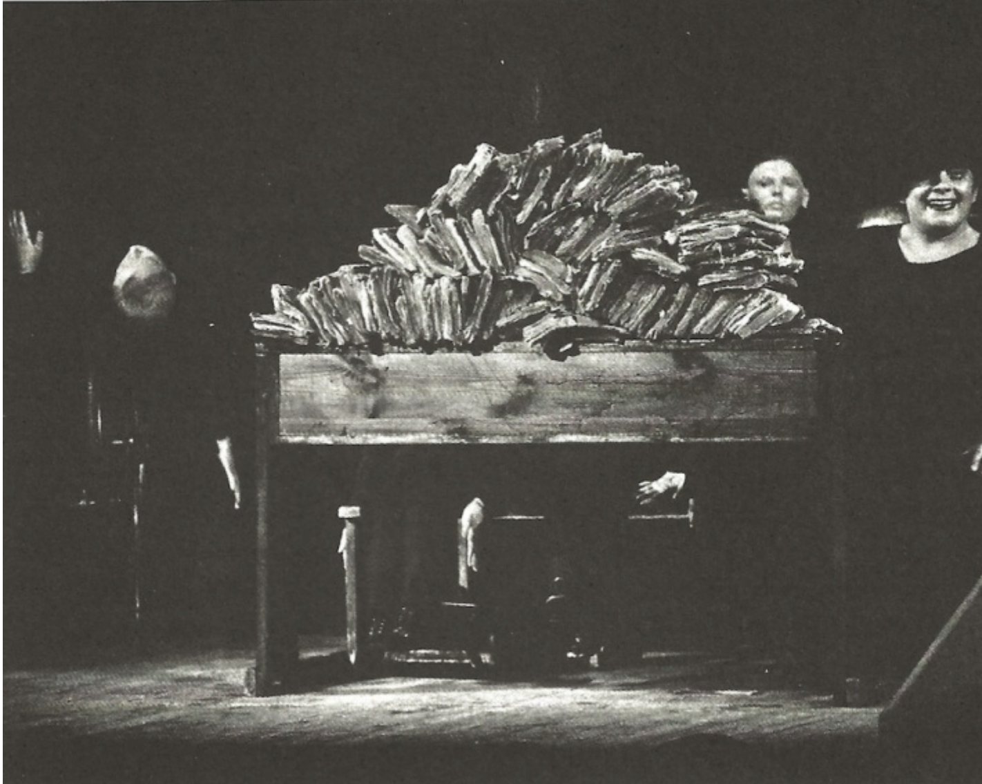
La classe morta, ph. Maurizio Buscarino.

Il suo è in definitiva un discorso sulla funzione dell’arte drammatica con un forte accento sulla storia delle arti plastiche (soprattutto le cosiddette avanguardie storiche), mentre Grotowski poneva l’accento sulla drammatica . Resta il fatto che entrambi, seppur diversamente, mettono al centro del processo l’attore, la consapevolezza che il teatro è ciò che fisicamente si ri-presenta in scena, mai la traduzione e illustrazione di istanze pedagogiche.