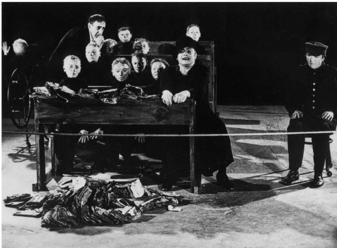
La classe morta di Tadeusz Kantor.

all'Università Cattolica, creava un altro paesaggio rispetto al Piccolo Teatro e ai teatri istituzionali, anche se il suo impegno produttivo si concentrava su una proposta della festa giudicata dal sottoscritto deleteria in quanto "avanguardia" di quella cultura di massa gratuita e di facile fruizione che sarebbe stata poi l'arma di Berlusconi e delle sue televisioni, forse non determinanti ma sicuramente complici del degrado culturale verificatosi negli anni ottanta. Le punte di diamante dell'avanguardia italiana erano troppo lontane dalla politica del CRT democristiano di allora, come lo erano dai gruppi di base e poi dal Terzo Teatro, in questo caso per ragioni vistosamente culturali, poetiche potremmo dire oggi con il distacco che al tempo mancava. Sempre nel 1978, una strada ancora diversa fu aperta dal Festival di Santarcangelo reinventato da Roberto Bacci, una esplosione di vitalità alternativa sia nei contenuti che nel modo di proporre una nuova cultura teatrale, anche se per il momento incentrata sulla promozione del Terzo Teatro, il popoloso movimento capitanato da Eugenio Barba e dal suo Odin Teatret. Pregi e limiti andavano insieme, come si vede.