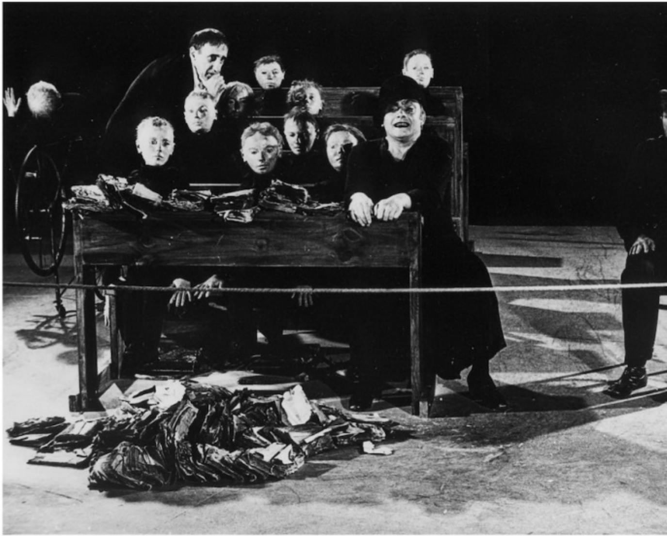
La classe morta di Tadeusz Kantor.