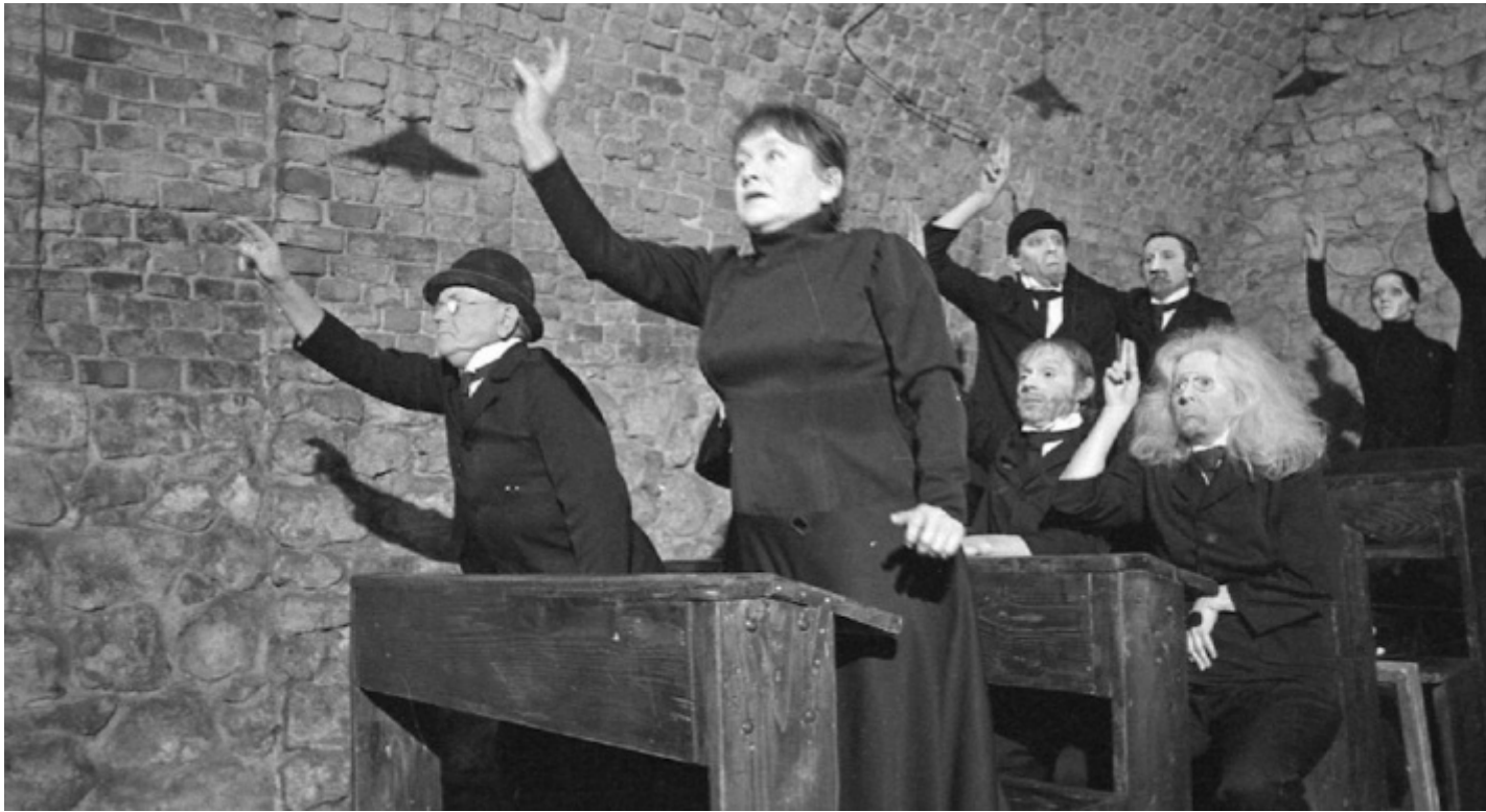
La classe morta.

Ma attenzione, quando parla di modelli Kantor non intende modelli da imitare bensì modelli da superare. La vicenda storica delle avanguardie-maestre è radicata in precise circostanze, non è storia da ripetere, è storia da sviluppare. Il teatro dev'essere inventato a ogni opera. Ad esempio, se in origine si intendeva il manichino come “manifestazione più triviale della realtà. Come un processo di infrazione, un oggetto vuoto, un messaggio di morte, un modello di attore”, oggi l'idea di sostituire all'attore vivente un manichino “è fuori luogo”, occorre piuttosto pensare alla scena come montaggio di elementi della “realtà pronta” ( objets trouvés ) e riconoscere il “ruolo del CASO” nella creazione.