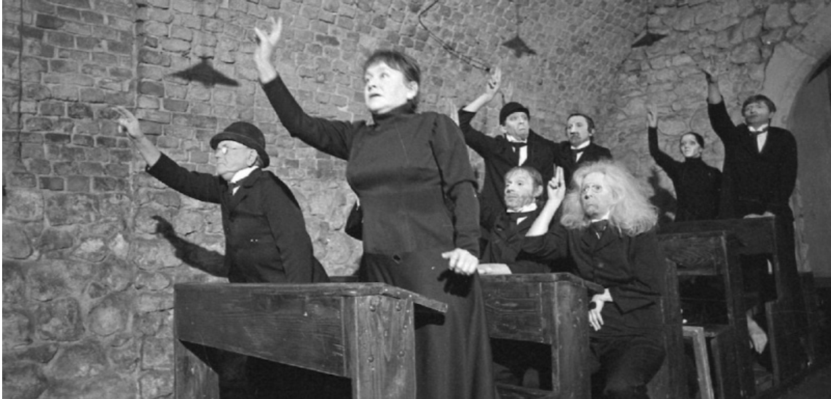
La classe morta.

si sviluppava il movimento RAZIONALISTA o addirittura MATERIALISTA – sempre più indipendente e sempre più pericolosamente separato dalla naturale tendenza verso un ‘MONDO SENZA OGGETTO’, verso il COSTRUTTIVISMO, il FUNZIONALISMO, il MACCHINISMO, l’ASTRAZIONE e, finalmente, il VISUALISMO PURISTA che riconosce semplicemente la ‘presenza fisica’ di un’opera d’arte”.