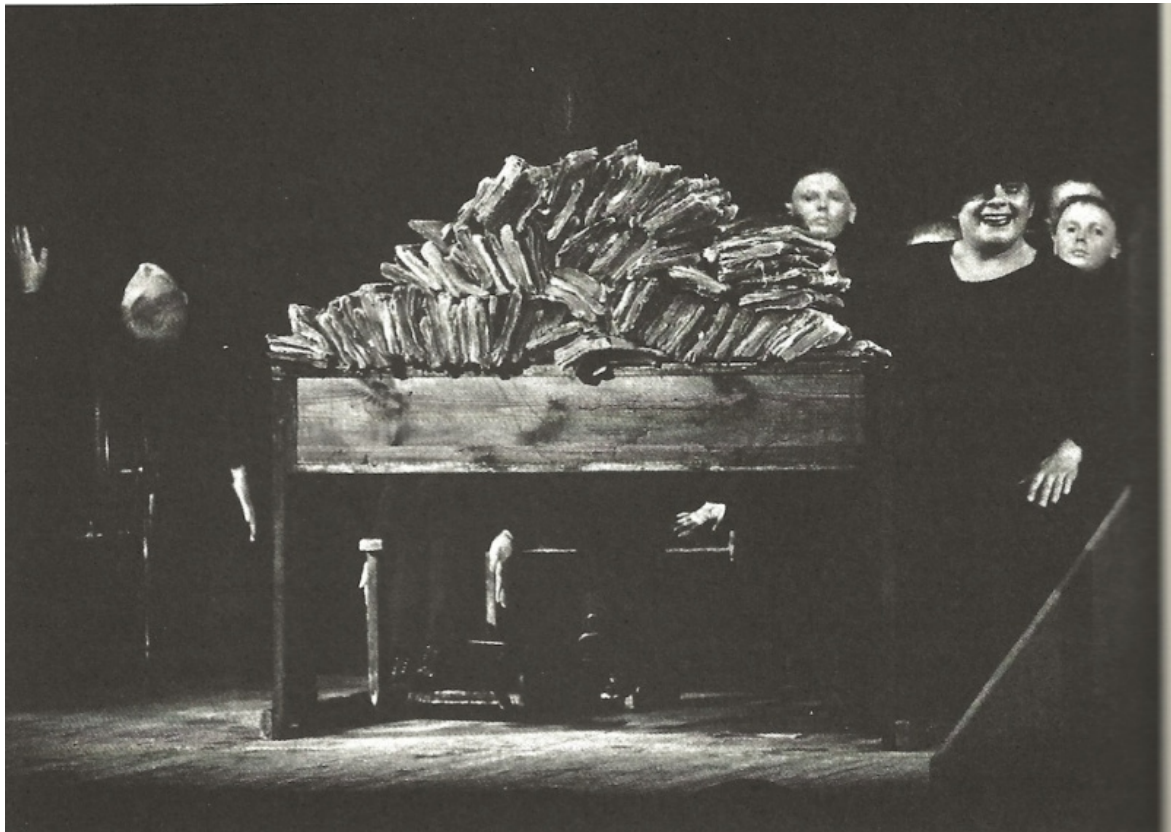
La classe morta, ph. Maurizio Buscarino.

Una questione interessante che qui non possiamo approfondire è quella dei rapporti tra Tadeusz Kantor e Jerzy Grotowski, una distanza polemica, a detta di tutti. Fatto sta che i due individuano nel “teatro povero” un imprescindibile punto di partenza. Però utilizzano parole diverse per dire povero: per Kantor è teatr biedny , mentre per Grotowski è teatr ubogi . Il termine scelto da Kantor ha una connotazione più materiale e rimanda anzitutto a una composizione scenica basata sugli objets trouvés ; quello utilizzato da Grotowski allude a un teatro che rinuncia agli apparati scenici e soprattutto è focalizzato sull’attore. Resta il fatto che entrambi sono sostenitori di un’arte drammatica fedele alla propria origine. Impressionante è anche un’altra analogia tra i due. Come s’è detto, Grotowski sosteneva che il teatro è nient’altro che il rapporto tra attore e spettatore, al di qua e al di là di ogni artificio scenico, e Kantor, sempre nel Teatro della morte , dice qualcosa che in un certo senso sembra approfondire quell’idea, ovvero: “Dobbiamo attribuire alla relazione SPETTATORE/ATTORE il suo significato essenziale”; e definisce l’attore un essere “RASSOMIGLIANTE A CIASCUNO DI NOI EPPURE INFINITAMENTE STRANIERO AL DI LÀ DI QUESTA BARRIERA CHE NON PUÒ ESSERE SUPERATA”.