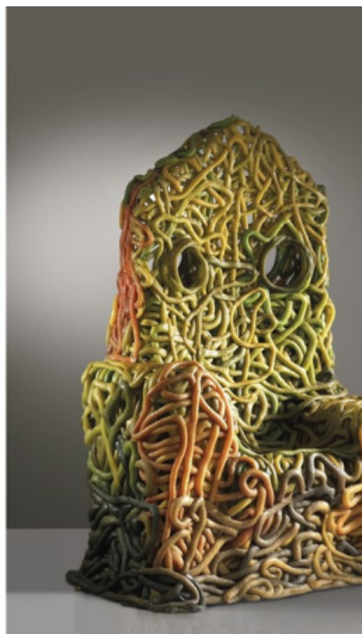
Gaetano Pesce, Gioielli della serie Fish design , New York, dal 1990; Trono , Modello senza fine unica, in PVC policromo nei toni del verde, beige e rosso, Produzione Meritalia, Italia, 2011.

Chi di noi non ricorda lo scherzo che fece scalpore sul web, quando, nel 2016 fu data la notizia della morte dell’artista? Per una notte tutti ne fummo convinti e, ovviamente, dispiaciuti. Per fortuna si trattava solo di una fake news . Ma come era nato il tutto? Così lo ha raccontato lo stesso Gaetano Pesce: