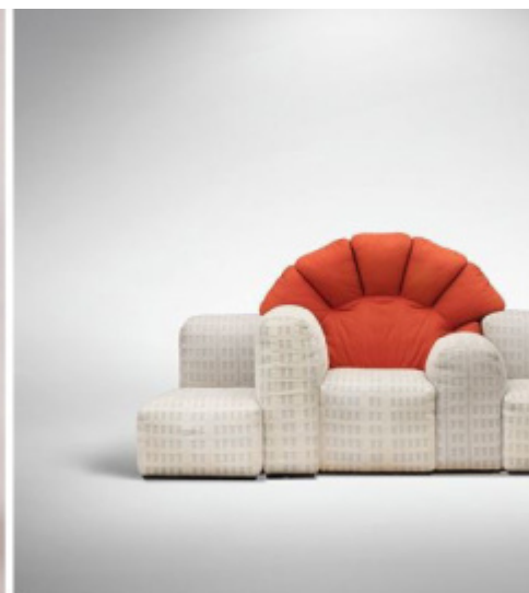
Gaetano Pesce, Poltrona e pouf Up5 6 in schiuma poliuretanicca 1969 per C&B Italia; Tramonto a New York , 1980, per Cassina.

Così ha dichiarato lo stesso Pesce in un'intervista a proposito della sua poltrona Up : "Agisco senza gabbie, creando oggetti che non svolgono solo funzioni pratiche, ma stimolano l'intelletto. Fanno riflettere. UP è stata e continua a essere una bomba" sorride fiero. "L'ho pensata senza nessuna struttura rigida. Le prime, in schiuma di poliuretano a iniezione rivestite da un tessuto elastico, venivano vendute sottovuoto. Si scartavano come un pacchetto di sigarette e si gonfiavano come le curve femminili. Volevo denunciare la