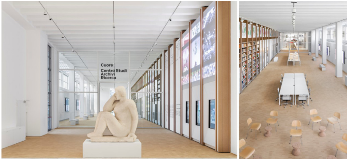
Milano, Palazzo dell'Arte, la nuova sede degli Archivi della Triennale, denominati Cuore - Centro studi, Archivi, Ricerca .

È proprio dagli Archivi della Triennale che sono stati tratti i documenti che hanno permesso ai loro autori di scrivere due libri da poco pubblicati per celebrarne i cento anni: