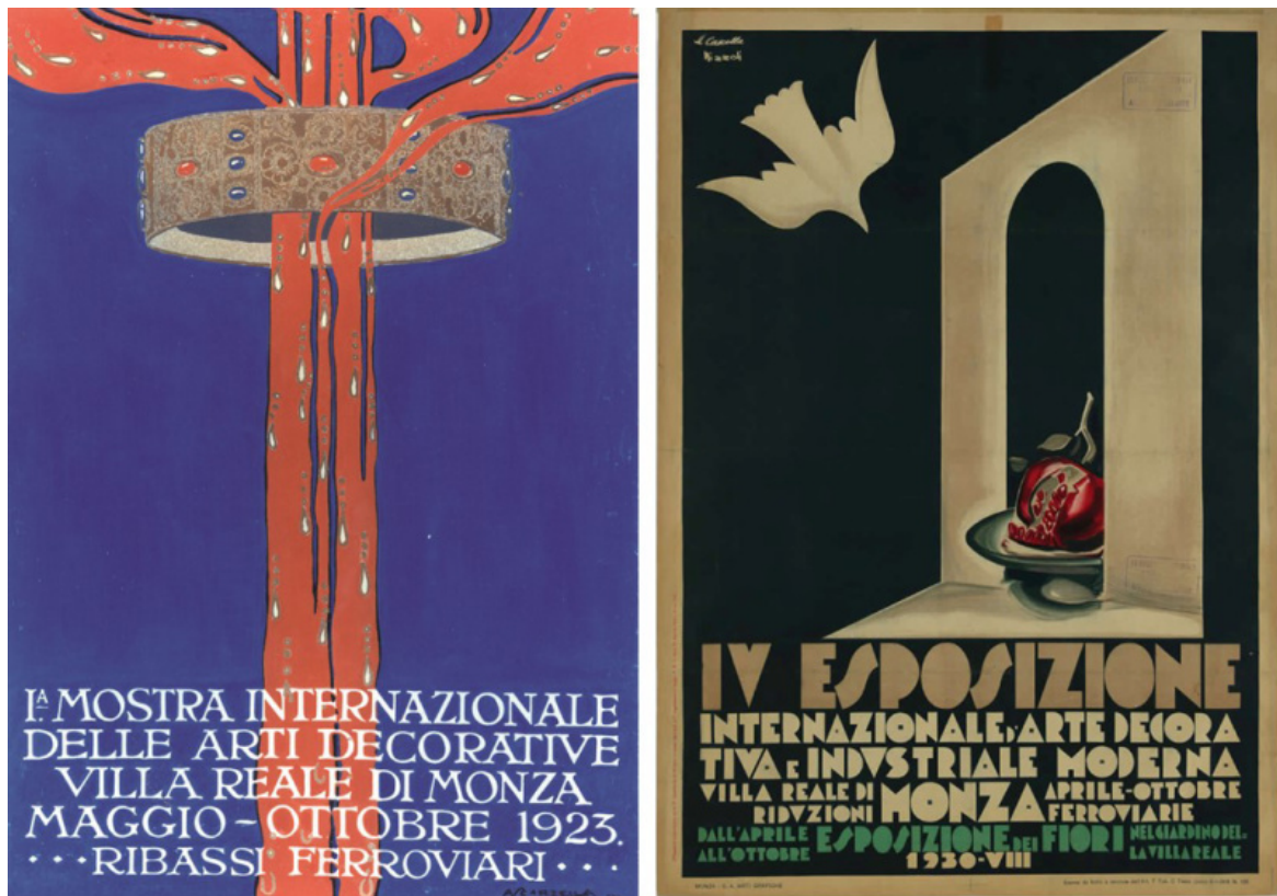
Aldo Scarzella, manifesto della I Biennale delle Arti Decorative, Monza 1923. Michele Cascella e Marcello Nizzoli, manifesto della IV Biennale di Arti Decorative, Monza, 1930.

Come scrive Piazza nel suo saggio introduttivo, a partire dai ventitré manifesti delle esposizioni, di cui sono icone ufficiali "è possibile delineare un racconto storico dell'evoluzione della progettazione grafica, del modificarsi del gusto, dell'introduzione di tecnologie che ammodernano i processi progettuali e realizzativi."