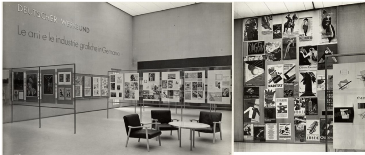
V Triennale, 1933, vedute della mostra della Sezione della Germania, organizzata dalla Deutscher Werkbund di Berlino e dedicata all'arte grafica industriale.