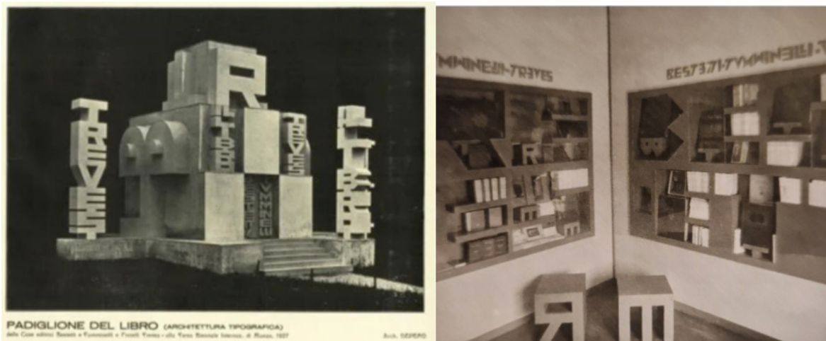
Fortunato Depero, Architettura Tipografica , Padiglione del libro Treves e Bestetti Tuminelli , III Biennale (1927).

Che dire, poi, della Architettura Tipografica di Fortunato Depero? Si tratta del Padiglione del libro Treves e Bestetti Tuminelli , un' architettura pubblicitaria da lui realizzata nel Parco di Monza in occasione della III Biennale (1927), in cui l'artista futurista ha "inventato" un alfabeto tridimensionale che da logo si faceva totem e le cui lettere diventavano addirittura complementi d'arredo.