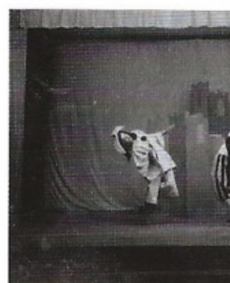
Marcel Marceau nei panni di Pierrot in uno dei suoi primi mimodrammi, La Tour d'amour , 1945.

Intanto, mentre a poco a poco matura la coscienza teatrale, continua la vita, sconvolta dalle deportazioni di massa e schierata, seppure in posizione defilata, al fianco della resistenza. L'autobiografia si dipana tra questi differenti piani, fino al trauma della cattura del padre.