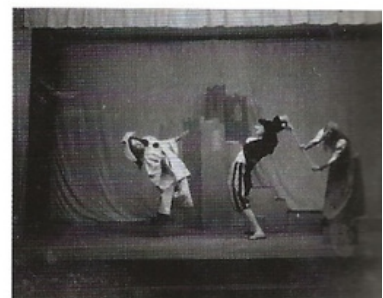
Marcel Marceau nei panni di Pierrot in uno dei suoi primi mimodrammi, La Tour d'amour , 1945.

Intanto, mentre a poco a poco matura la coscienza teatrale, continua la vita, sconvolta dalle deportazioni di massa e schierata, seppure in posizione defilata, al fianco della resistenza. L'autobiografia si dipana tra questi differenti piani, fino al trauma della cattura del padre.