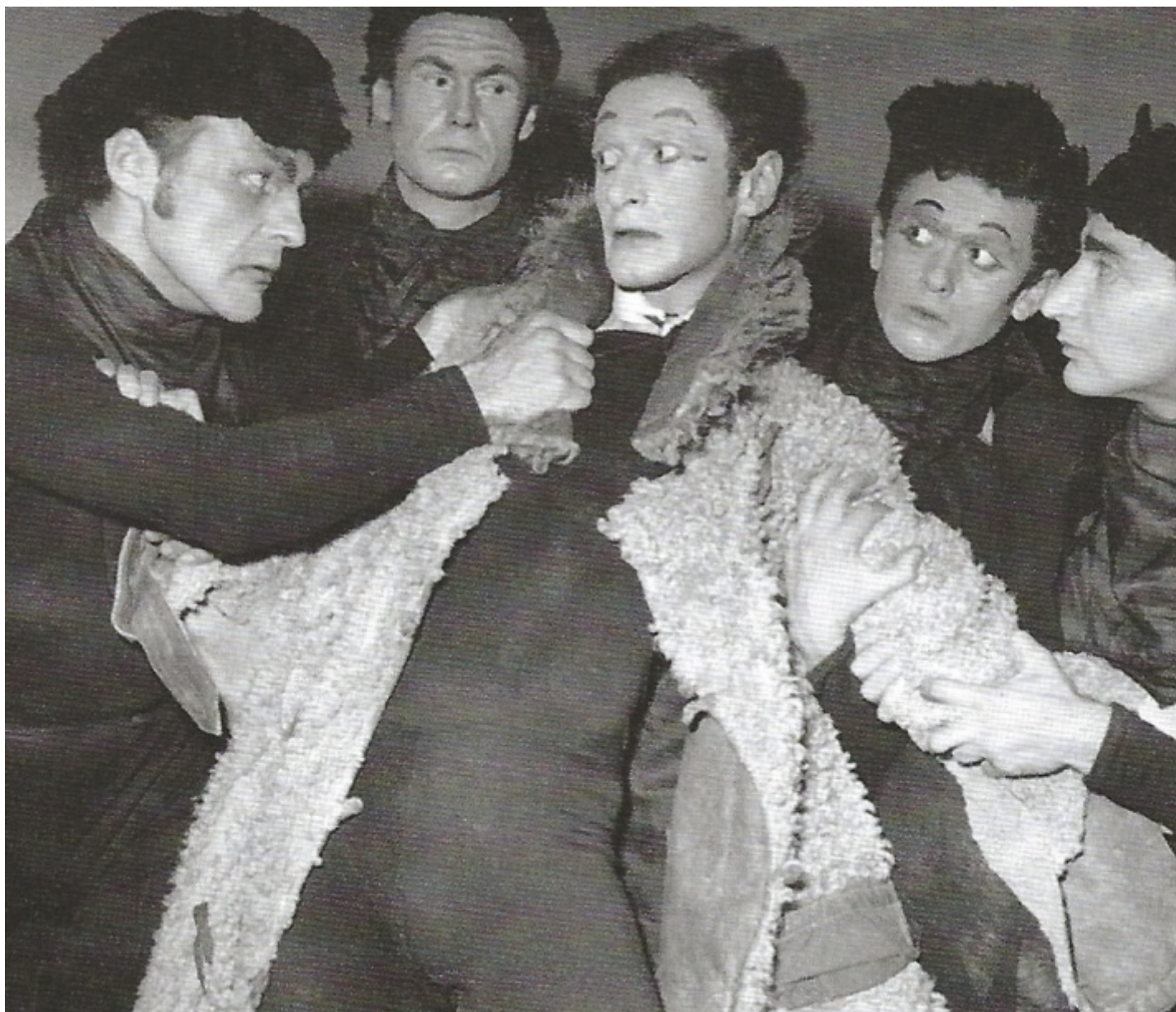
Una scena del Cappotto .

L'autobiografia non arriva a questo punto, anche se in appendice troviamo una Cronologia biografica , accompagnata da immagini degli anni successivi a quelli narrati. Si chiude con la messa in scena del Cappotto , nel 1952. Sostanzialmente ci mostra le ispirazioni di uno dei protagonisti della scena del Novecento, penetrando nelle sue vicende personali più intime, legate alle grandi tragedie dell'epoca. Narra la voglia di cercare bellezza, in certi momenti magari una bellezza facile, messa in movimento però dal desiderio di uscire dalle macerie e di guardare con uno spirito diverso all'essere umano.