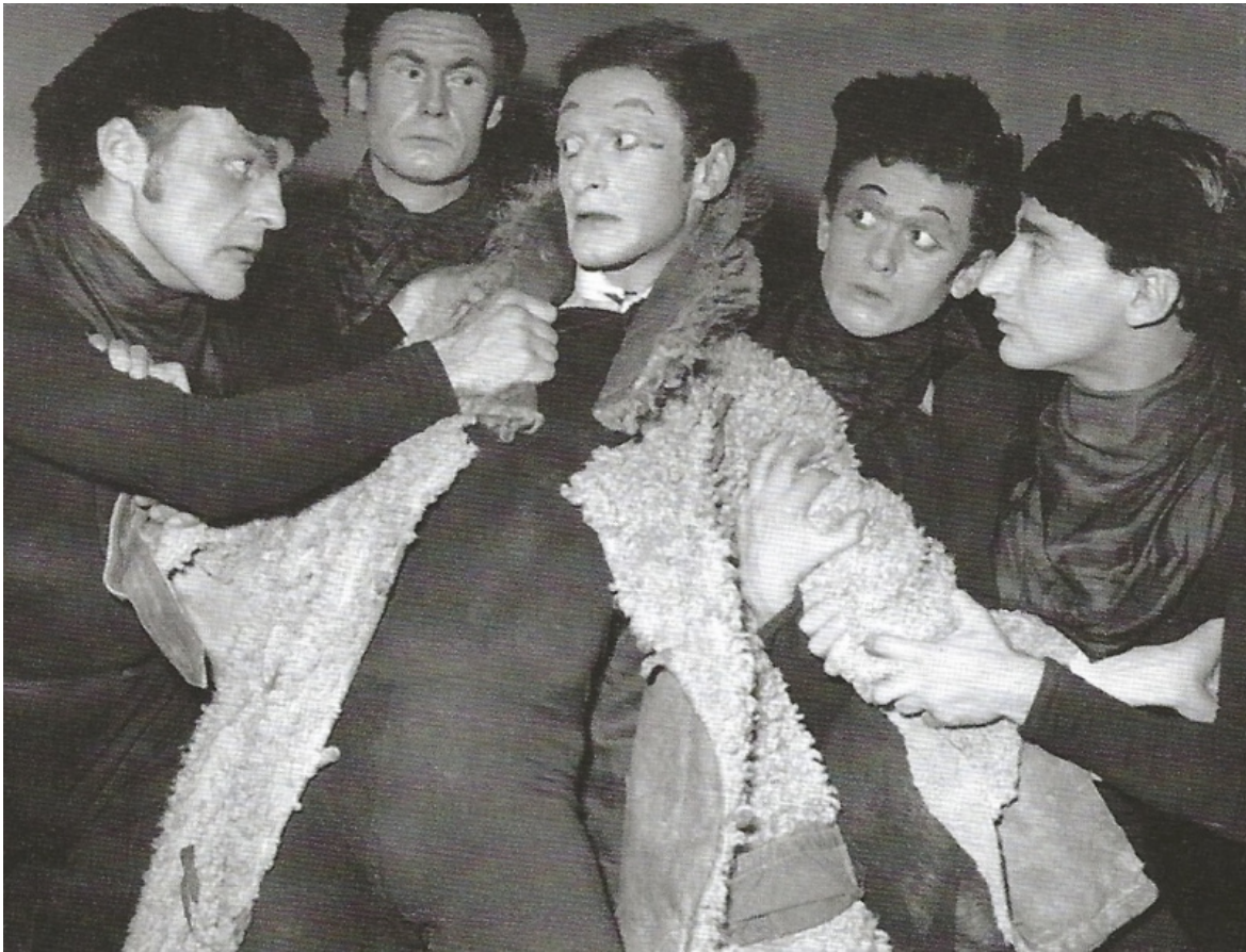
Una scena del Cappotto .

L'autobiografia non arriva a questo punto, anche se in appendice troviamo una Cronologia biografica , accompagnata da immagini degli anni successivi a quelli narrati. Si chiude con la messa in scena del Cappotto , nel 1952. Sostanzialmente ci mostra le ispirazioni di uno dei protagonisti della scena del Novecento, penetrando nelle sue vicende personali più intime, legate alle grandi tragedie dell'epoca. Narra la voglia di cercare bellezza, in certi momenti magari una bellezza facile, messa in movimento però dal desiderio di uscire dalle macerie e di guardare con uno spirito diverso all'essere umano.