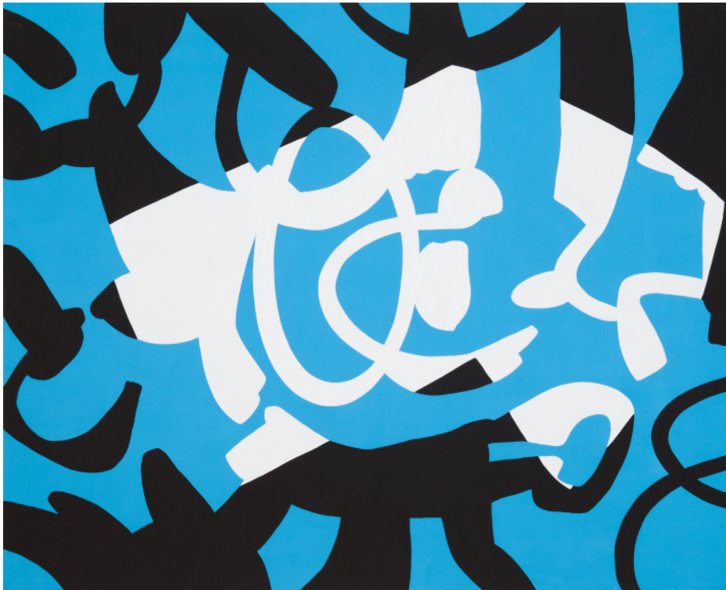
Imbucare i misteri, 2014, vinilico su tela, cm 130 x 180, Collezione privata.

Carla Accardi , Roma, Palazzo delle Esposizioni fino al 9 giugno 2024