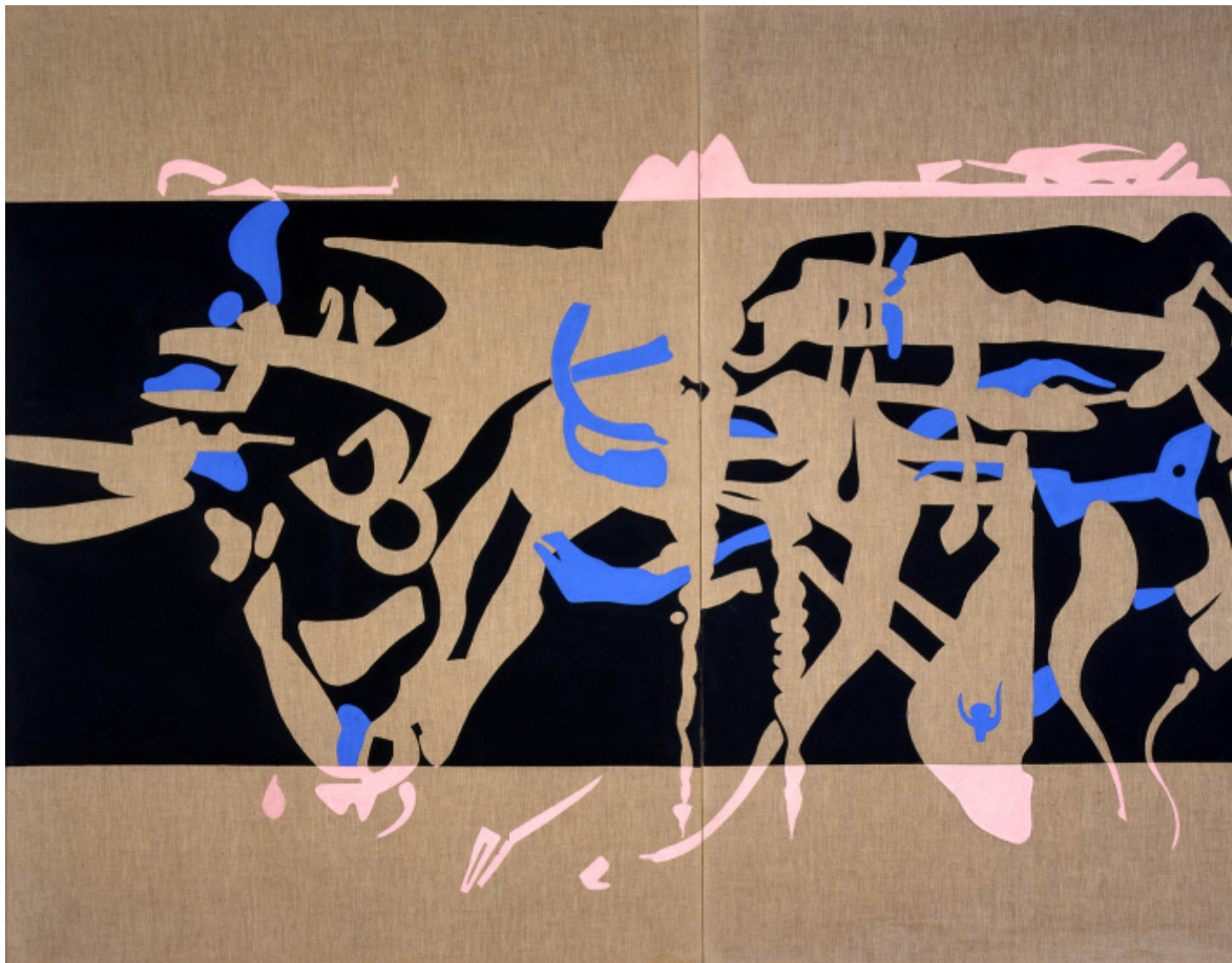
Animale immaginario 1, 1987, vinilico su tela, dittico, cm 220 x 320, Collezione privata, Foto © Roberto Marossi by SIAE 2024.

probabilmente, risente delle reminiscenze calligrafiche arabe. Un ritmo fatto dal pulsare della luce, dai colori fluorescenti (spesso ottenuti dalla tempera alla caseina), che, in una forma intima e personale, indicano il contatto con la vita e il suo incessante fluire.