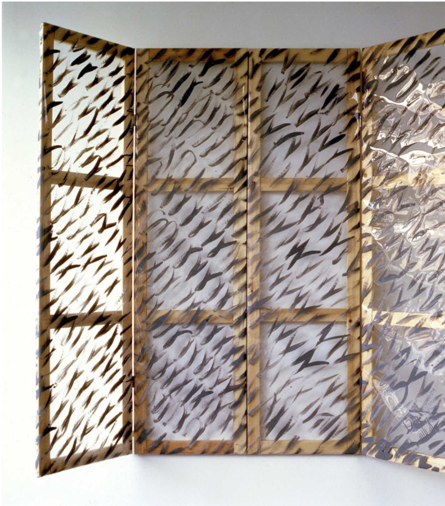
A Gent abbiamo aperto una finestra, 1971-1986, vernice su sicofoil e telaio di legno, cm 181 x 147 x 47, Collezione S.M.A.K., Stedelijk Museum voor Actuele Kunst, Gent.