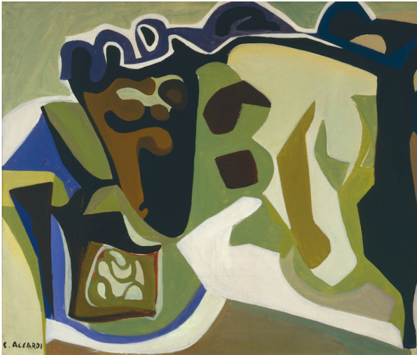
Verde ble, 1949, olio su tela, cm 60 x 80, Collezione privata Ca.Sa.

Una pittura, quella tradizionale, figurativa, che, per Accardi, tiene ancora fortemente conto delle istanze patriarcali, di quell'iconografia fissata dall'universo maschile. Contro questi canoni, risponde con una pittura che rinnega il figurativo, le sfumature, con toni a contrasto, adottando quella pratica che l'ha non solo contraddistinta, ma resa celebre: il segno astratto. La passione per la pittura affonda le sue radici già in tenera età, si manifesta sin da bambina. L'artista racconta, infatti, che, prima di recarsi a scuola, usciva tutti i giorni alle sette del mattino per andare a disegnare, realizzando ritratti a parenti e amici. Supportata e assecondata dal padre, che amava molto il suo talento, dopo gli studi classici, intraprese quelli dell'Accademia di Belle Arti. Dapprima a Palermo, per poi andare a Firenze. Ma, a causa di un'atmosfera culturale per lei poco stimolante, perché ancora fortemente influenzata da Morandi e Rosai, quando, invece, era già "interessata a Matisse, a Picasso, agli artisti dell'avanguardia europea" , su suggerimento di Antonio Sanfilippo, si trasferì nella Capitale "ché a Roma ci sono degli artisti che stanno facendo una situazione molto interessante" .