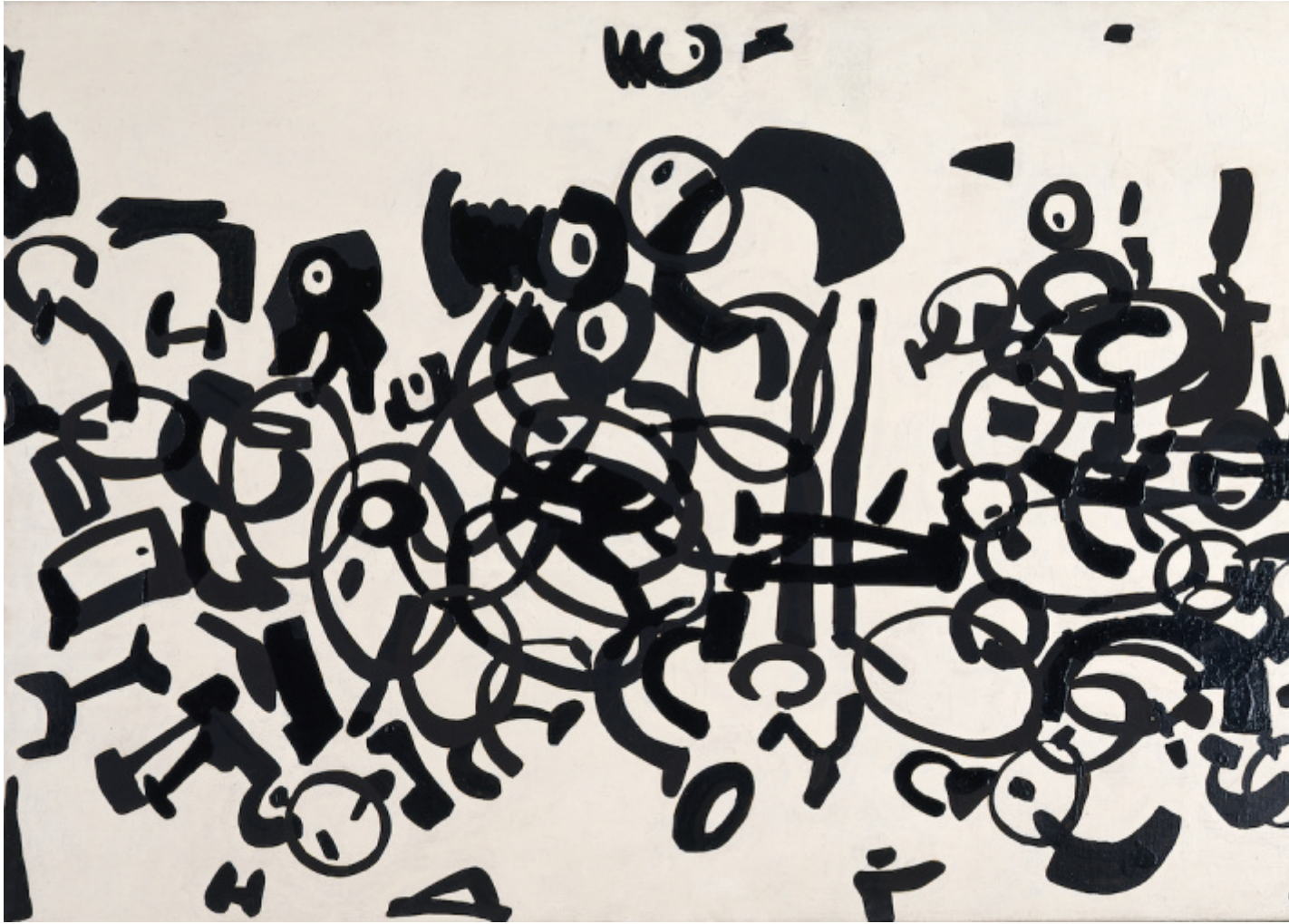
Arciere su bianco, 1955,tempera alla caseina su tela, cm 73 x 116, Collezione Fondazione per l'Arte Moderna e Contemporanea CRT - in comodato presso la GAM - Galleria Civica d'Arte Moderna e Contemporanea di Torino, Su concessione della Fondazione Torino Musei, 2003.

Ci proclamiamo formalisti e marxisti, convinti che i termini marxismo e formalismo non siano inconciliabili", e continuava affermando che "la forma è mezzo e fine. il quadro deve poter servire anche come complemento decorativo di una parete nuda, la scultura anche come arredamento di una stanza; il fine dell'opera d'arte è l'utilità, la bellezza armoniosa".