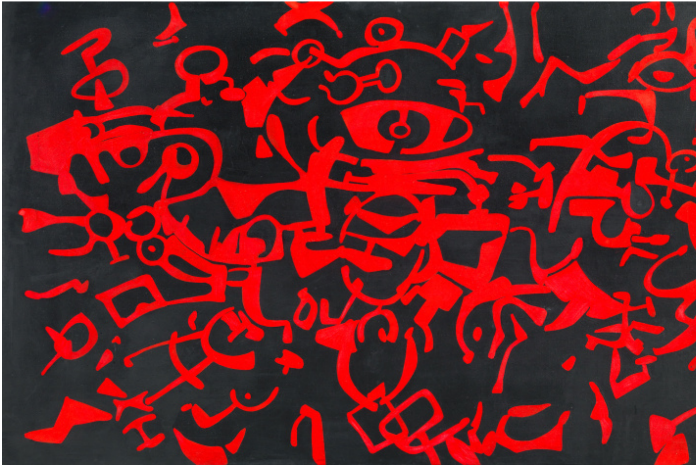
Assedio rosso n. 3, 1956, tempera alla caseina e smalto su tela, cm 97 x 162, Collezione privata, Firenze.

risente della lezione di Picasso e predomina il colore (quello dei Fauves), ben presto inizia a realizzare i suoi primi disegni e quadri bianco su nero (1954 – anno in cui avviene anche un incontro fondamentale per l'artista: la conoscenza di Michel Tapié, che le apre le porte delle gallerie parigine, in particolare con la galleria Stadler). Una tappa, questa, che è fondamentale, perché, per Carla Accardi, segna un netto taglio col passato.