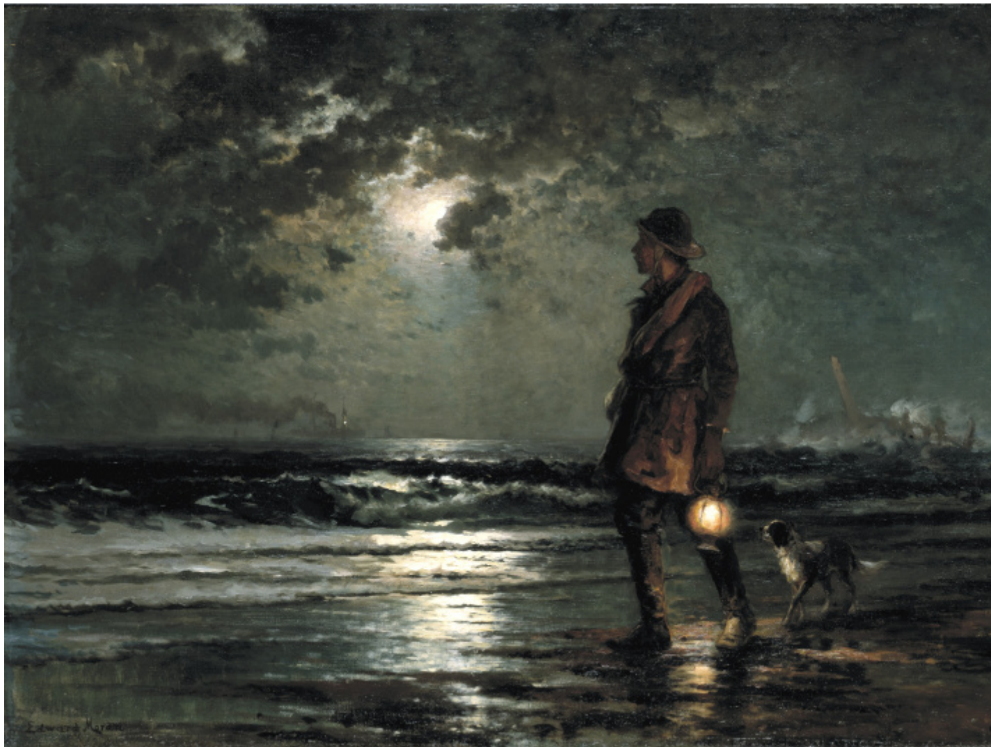
Smithsonian American Art Museum, Bequest of Clara L. Tuckerman.

Traendo spunto da racconti di sopravvissute al trauma dell'abuso, Herman conclude che le scuse, “quando vengono avanzate e accolte, quando sono autentiche, generano nel corpo una dissoluzione alchemica, fisica, psicologica e spirituale della ferita, del rancore, dell'amarezza, del bisogno di vendetta e dell'odio. È così che è fatto il sentimento del perdono” .