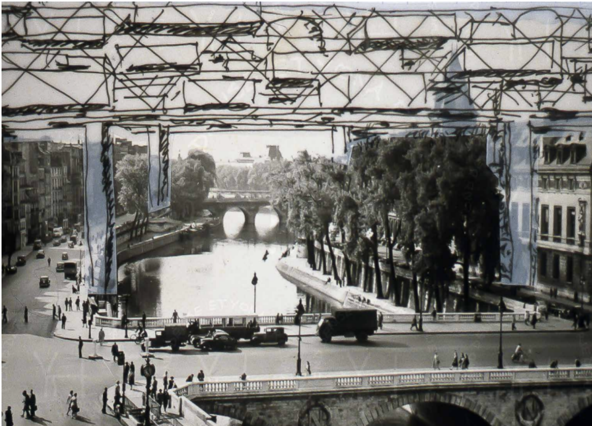
Paris spatial, disegni e fotomontaggio, Fondo Denise e Yona Friedman.

Per esplicitare meglio il suo agire l'architetto ungherese disegna schematicamente le varie possibilità in cui l'abitante può autopianificare la sua casa, partendo da una struttura esistente e iniziando a bucarla per ottenere il soleggiamento o utilizzare gli spazi vuoti come terrazze-giardino e poi dopo la scelta tecnica, imparare il linguaggio. Linguaggio che per Friedman significa pareti mobili, i soffitti appesi ai solai, e le strutture formate da un tetto al di sotto del quale l'abitante può organizzare liberamente lo spazio. "E la farete [l'autopianificazione] senza pianificatori paternalisti - scrive Friedman - che vogliono educarvi per fare di voi qualcun altro".