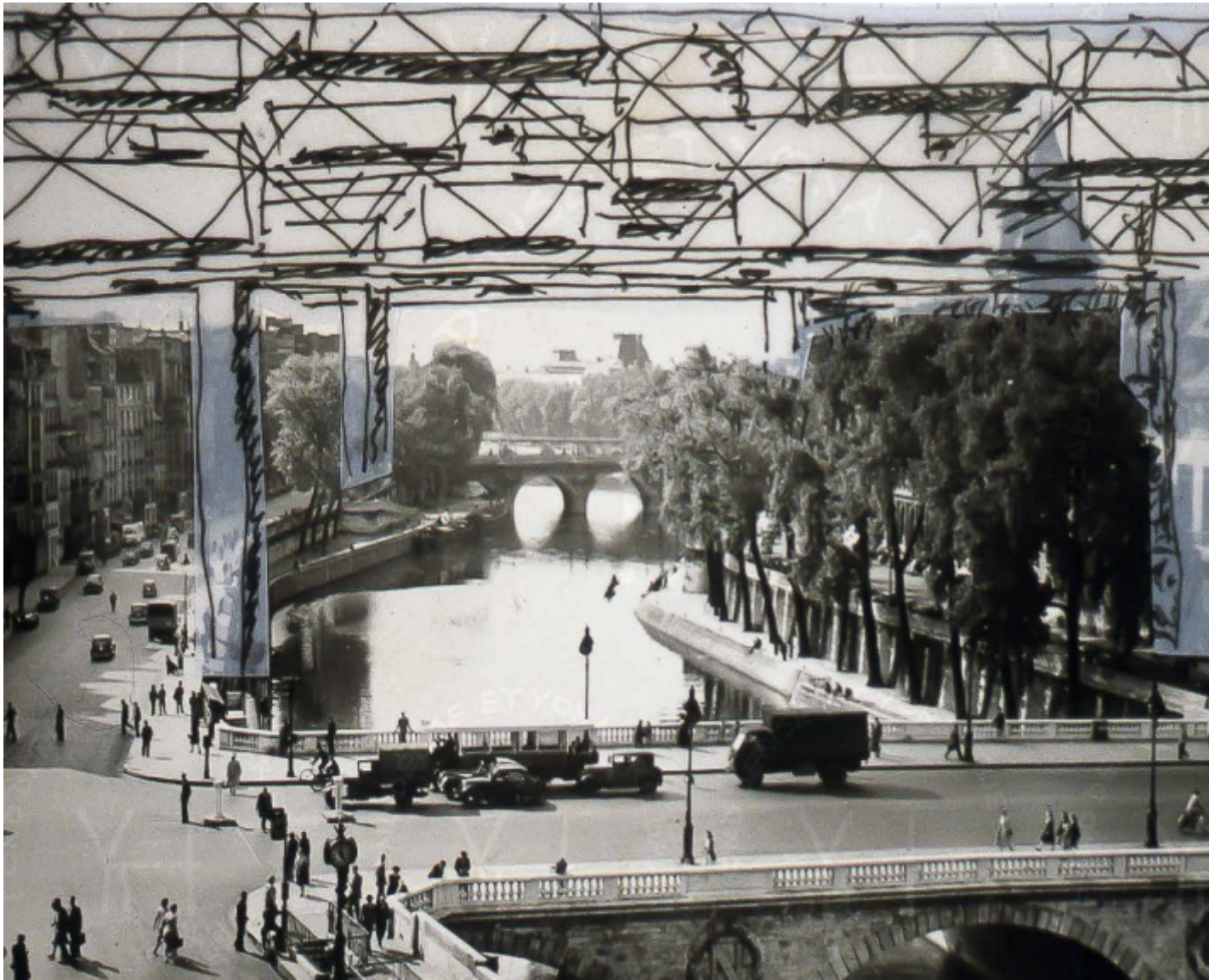
Paris spatial, dessins et photomontage.

un'idea micro di aggregazione sociale, ben distinta dalla città e dalla metropoli. Oggi si potrebbe dire che i paesi possono assumere quella dimensione fisica a cui si riferisce Friedman, dove l'unione di pochi rinsalda prima di ogni altra cosa i legami sociali. È questo a cui tende il manifesto politico che lui propone, un ribaltamento del punto di vista e dell'azione dell'abitante autonomo, without architects .