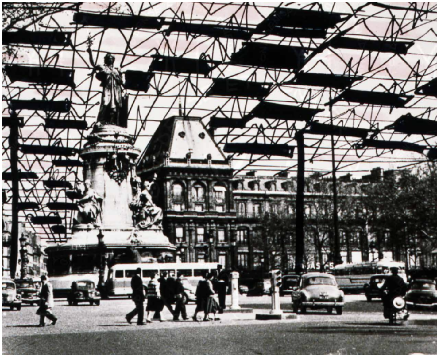
Paris spatial, dessins et photomontage, Fond Denise et Yona Friedman.

In Italia uno degli artefici della partecipazione è l'architetto Giancarlo De Carlo che la adotta nel 1966 quando elabora il Piano Regolatore di Urbino, nel 1969 per il Piano particolareggiato di Rimini e infine per il Villaggio Matteotti a Terni nei primi anni settanta, in cui l'architetto genovese ascolta e interpreta i desideri degli abitanti per trasformarli in architettura. Diversamente Friedman propone che l'abitante sia il fautore dell'oggetto architettonico senza l'aiuto dell'architetto. Infatti la storia dell'abitare ci ha tramandato nei secoli case che sono state costruite dai loro abitanti per soddisfare i loro bisogni. Questo avviene soprattutto nei contesti poveri come quelli della cosiddetta architettura informale sia in Europa sia in Latinoamerica, archetipi da cui si sono nutriti generazioni di architetti. Nel 1964 Bernard Rudofsky cura la mostra al MoMA Architecture without Architects An introduction to a Non-Pedigreed Architecture , in cui analizza proprio le architetture senza autore. Architetture nate dalla creatività dei loro abitanti per necessità, dalle costruzioni cinesi alle case mediterranee, dalle architetture nomadi del deserto sahariano alle architetture vernacolari italiane. Friedman fin dai suoi primi disegni dell' Architecture Mobile agisce con strutture modulari e reticolari, evoluzione delle tende dei nomadi del deserto, così anche il lavoro di Rudofsky non deve essergli stato estraneo, troppe le affinità.