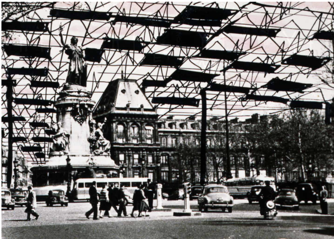
Paris spatial, dessins et photomontage, Fond Denise et Yona Friedman.

Sono domande legittime a cui Friedman tenta delle risposte che hanno certamente un fondamento ma tuttavia appaiono nel solco della non realizzabilità nel momento che presuppongono un contesto sociale e politico molto diverso. La disciplina dell'architettura stava subendo, fino dagli anni cinquanta, una crisi di identità che viene dopo la fine del movimento moderno e il rapido sviluppo globale dell'International Style. Negli anni della contestazione sessantottina la controcultura e le neo-avanguardie architettoniche radicali determinano un ulteriore allontanamento dalla tradizione dell'architetto-demiurgo. È pur vero che alla fine degli anni sessanta quando il libro di Friedman esce per la prima volta, i temi della partecipazione erano al centro del dibattito iniziato nel 1968, in cui si rivoluziona il linguaggio, dall'arte alla letteratura (Gruppo '63) per proseguire nel decennio successivo fino all'avvento del Postmodern, nella prima Biennale di Architettura a Venezia diretta da Paolo Portoghesi.