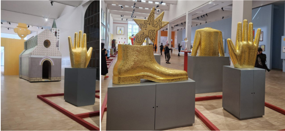
Alcuni scorci della mostra di Alessandro Mendini in Triennale, visitabile dal 13 aprile al 13 ottobre 2024.