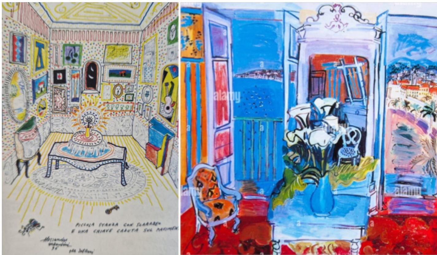
Alessandro Mendini, Piccola stanza con scarabeo e una chiave caduta sul pavimento . (1996). Raoul Dufy, Interno con finestra aperta (1927).

“La Piccola stanza con scarabeo ” ha scritto poi Irace “è l'emblema del mistero della camera chiusa: la chiave caduta sul pavimento è la perdita via d'uscita da un universo concentrazionista, dove il decoro invade mobili, pavimento, soffitto e pareti senza soluzioni di continuità.”