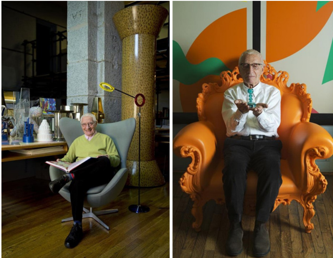
Due ritratti di Alessandro Mendini.

Dopo Dada, nulla nell'arte (e nel design) può più prescindere da Dada. E Mendini, colto, raffinato, al passo col suo tempo, lo sapeva molto bene e, nella creazione dei suoi oggetti, ha spesso fatto propria la tecnica del ready-made e quella duchampiana dei collages imprevedibili, senza rinunciare all'azzardo cromatico che ha caratterizzato l'ultimo Kandinskij, a cui ha tributato omaggio nel suo divano Kandissi (1978), e che l'allestimento della bella mostra milanese in alcuni punti acutamente riprende.