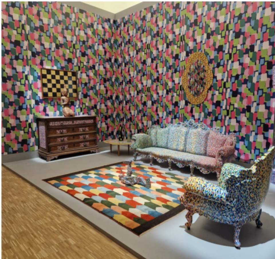
Scorci dell'allestimento della mostra. A sinistra: un evidente omaggio di Pierre Charpin all'ultimo Wassily Kandinsky. A destra una delle Stanze , in cui è massiccio il metodo Proust.

Una sala cinema ospita poi la proiezione di un video realizzato con materiali d'archivio inediti, tra cui il documentario di Muse Volevo essere Walt Disney (2016). La regia è di Francesca Molteni; il testo di Fulvio Irace; la voce narrante, invece, è quella di Sandro Lombardi di Magazzini Criminali, con cui Mendini ha collaborato.