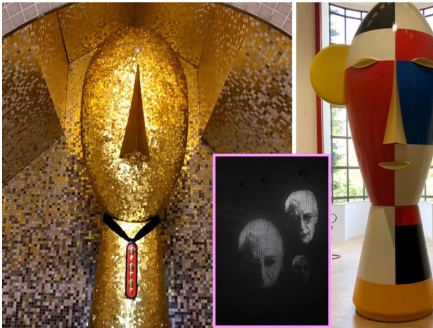
A sinistra: le Visage Arcaïque , all'interno della Petite Cathédrale (2002); a destra: la Tête Géante ; al centro fotogramma dell'istallazione che Philip Starck ha allestito nell' impluvium di Triennale.

Entrati nella mostra, ad accoglierci è un nucleo di sculture in formato fuori scala, rivestite da una preziosa livrea a mosaico con tessere in oro giallo 24K, tagliate e posate a mano. Si tratta di Giacca, Guanto, Scarpa , tutte create nel 1977 e facenti parte di una più ampia collezione dal titolo Mobili per uomo , realizzata in Limited Edition per Bisazza, “nate dalla riflessione dell'architetto secondo cui i pezzi rappresenterebbero simbolicamente quanto non può mancare in un essenziale guardaroba da uomo”, hanno scritto gli operatori di Bisazza. A quei pezzi storici, si aggiunge qui anche la scultura Stella del 2003.