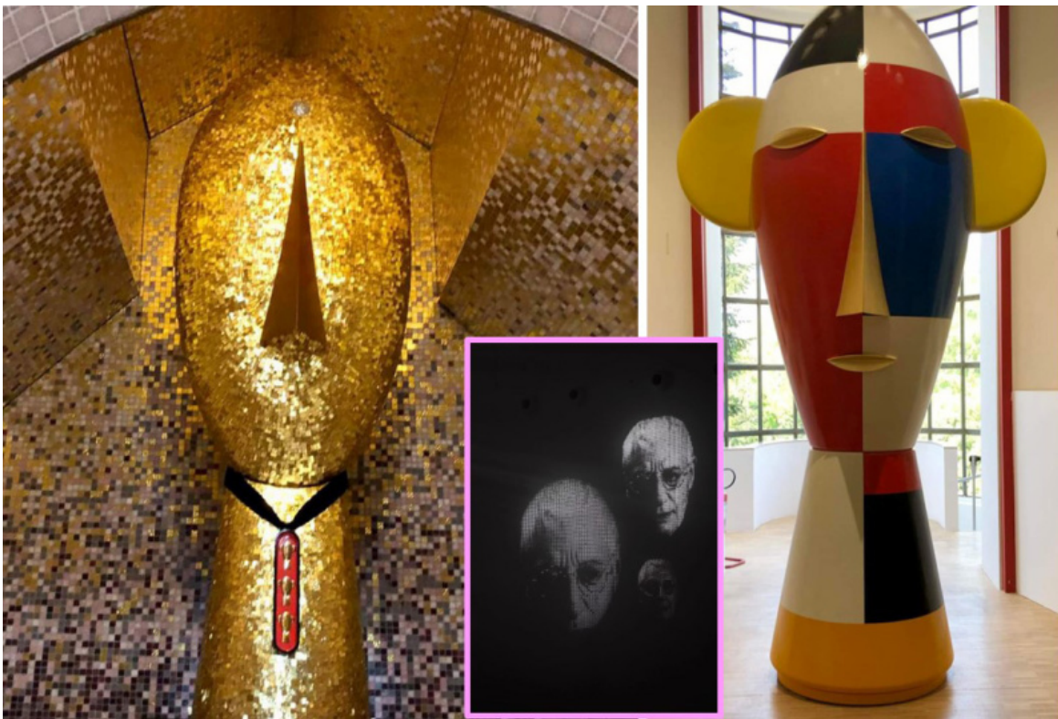
A sinistra: le Visage Arcaïque , all'interno della Petite Cathédrale (2002); a destra: la Tête Géante ; al centro fotogramma dell'installazione che Philip Starck ha allestito nell'impluvium di Triennale.

Entrati nella mostra, ad accoglierci è un nucleo di sculture in formato fuori scala, rivestite da una preziosa livrea a mosaico con tessere in oro giallo 24K, tagliate e posate a mano. Si tratta di Giacca , Guanto , Scarpa , tutte create nel 1977 e facenti parte di una più ampia collezione dal titolo Mobili per uomo , realizzata in Limited Edition per Bisazza, "nate dalla riflessione dell'architetto secondo cui i pezzi rappresenterebbero simbolicamente quanto non può mancare in un essenziale guardaroba da uomo", hanno scritto gli operatori di Bisazza. A quei pezzi storici, si aggiunge qui anche la scultura Stella del 2003.