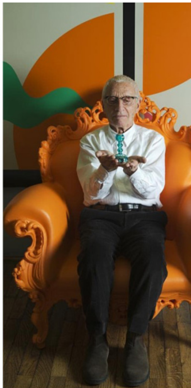
Due ritratti di Alessandro Mendini.

Dopo Dada, nulla nell'arte (e nel design) può più prescindere da Dada. E Mendini, colto, raffinato, al passo col suo tempo, lo sapeva molto bene e, nella creazione dei suoi oggetti, ha spesso fatto propria la tecnica del ready-made e quella duchampiana dei collages imprevedibili, senza rinunciare all'azzardo cromatico che ha caratterizzato l'ultimo Kandinskij, a cui ha tributato omaggio nel suo divano Kandissi (1978), e che l'allestimento della bella mostra milanese in alcuni punti acutamente riprende.