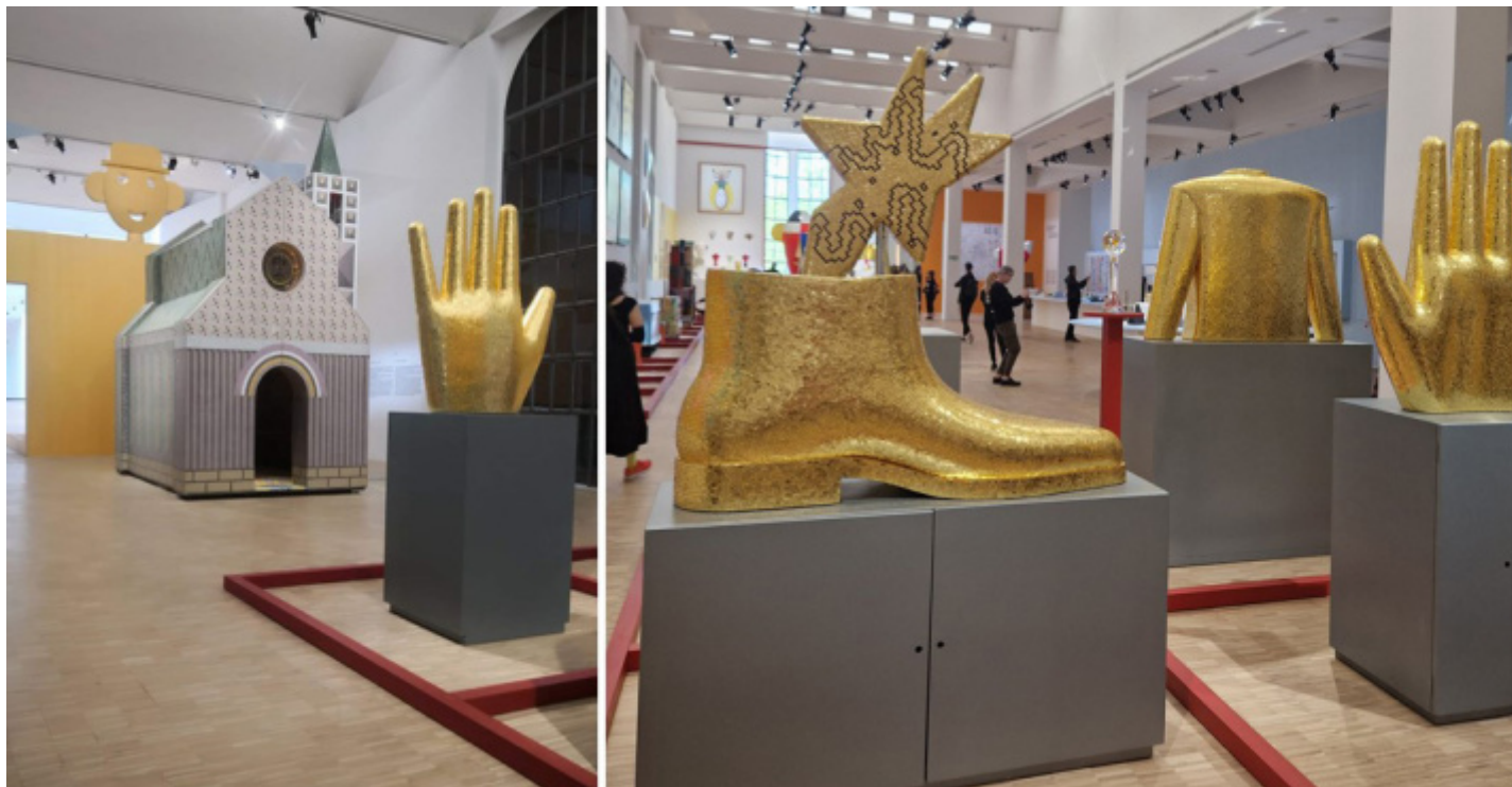
Alcuni scorci della mostra di Alessandro Mendini in Triennale, visitabile dal 13 aprile al 13 ottobre 2024.

Alle volte un'immagine è più eloquente di mille parole.