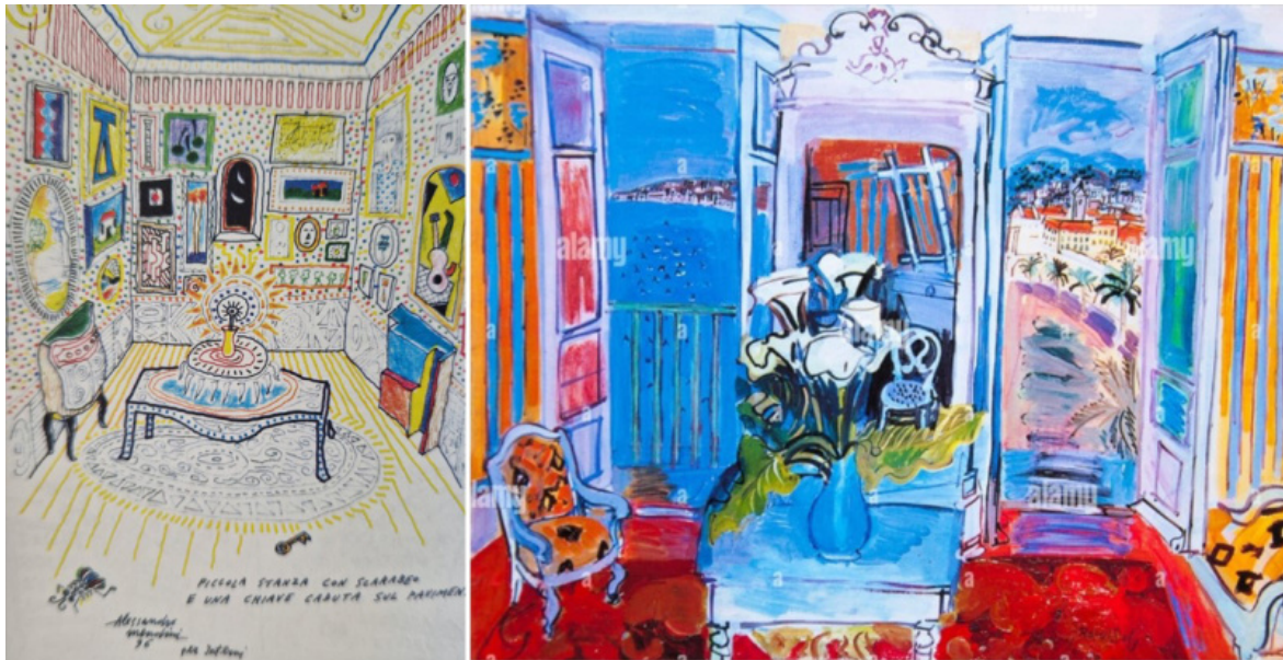
Alessandro Mendini, Piccola stanza con scarabeo e una chiave caduta sul pavimento . (1996). Raoul Dufy, Interno con finestra aperta (1927).

un universo concentrazionista, dove il decoro invade mobili, pavimento, soffitto e pareti senza soluzioni di continuità.”