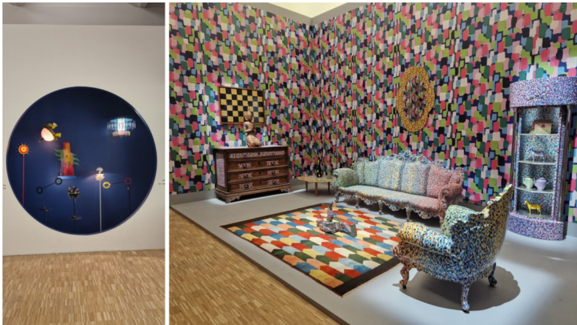
Scorci dell'allestimento della mostra. A sinistra: un evidente omaggio di Pierre Charpin all'ultimo Wassily Kandinsky. A destra una delle Stanze, in cui è massiccio il metodo Proust.

Quando Mendini progettava le sue tanto amate Stanze , nella testa gli frullavano e gli turbinavano ancora e ancora, come in un " mosaico di pezzi di vita ", le immagini delle stanze della sua infanzia, trascorsa nella casa di via Jan, 15, così sature di capolavori, ingombre di mobili e di oggetti (" dove non era mai entrato un architetto ", come ha dichiarato lui stesso), che sembrano ergersi ancora oggi a vessillo della rivincita dell' horror vacui sul less is more predicato dal razionalismo.