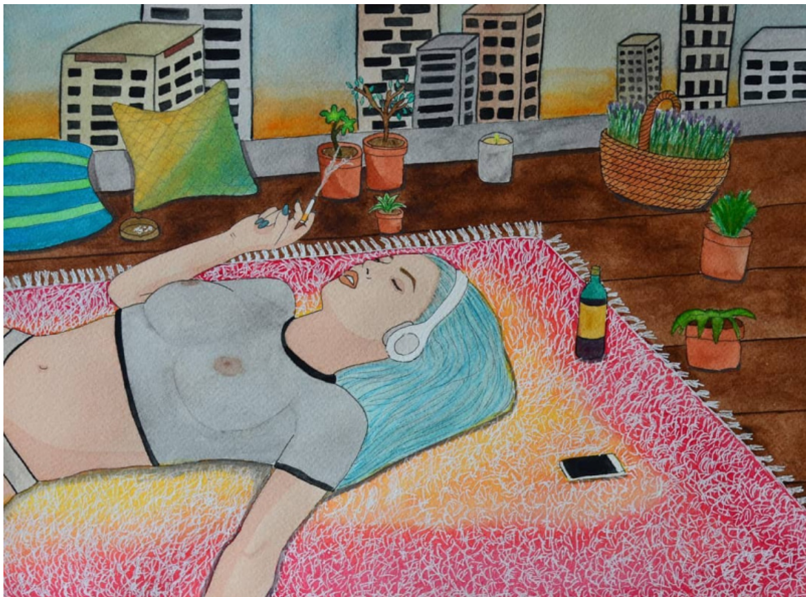
Illustrazione di Flupieland.

Pietropoli Charmet: credo che possa essere letta, questa scelta, come, da un certo punto di vista, un passo avanti rispetto ai passi prematuri della scelta anoressica. Nella scelta anoressica è in campo la fobia del corpo femminile, della femminilizzazione e dunque della sessuazione. È una risposta convincente alla paura della dipendenza dal maschio. Il no alla sessualità, che ritroviamo nella scelta dell'asessualità, autorizza a una vita molto più tranquilla, esclude l'oggetto come alterità, con una sua autonomia. Resta, come unico rapporto, quello con un oggetto riflettente, un oggetto sé. Questa terminologia si presta a dare un nome a qualcosa di fuggevole, ad ancorarsi e non attraversare alcune questioni.