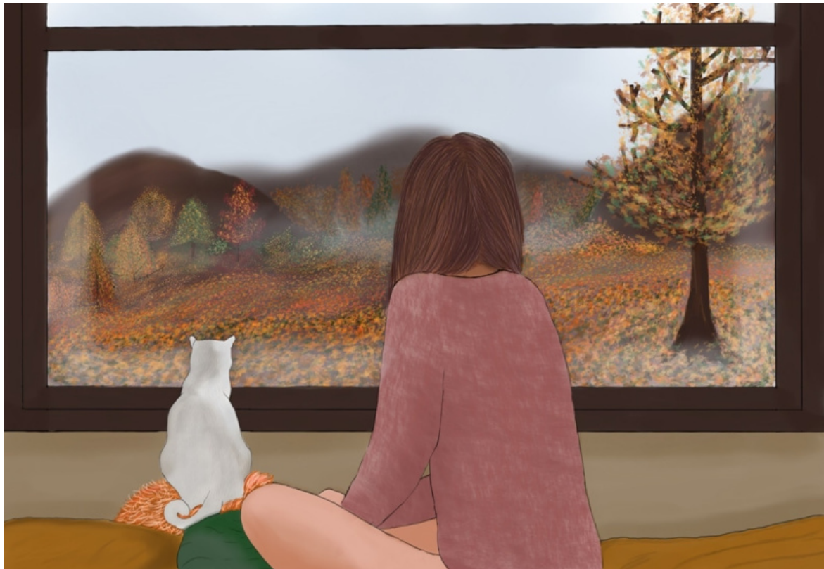
Illustrazione di Flupieland.

così: se si parla poco forse le parole le vanno a cercare da chi apparentemente non le vende. Bisognerebbe fare una riflessione su questo. Tante volte mi chiedo, ascoltando la loro musica, se hanno un rispettivo nel pensiero quotidiano, e mi pare strano, ma vale la stessa domanda per le canzoni della mia epoca: sentivamo così e la musica prestava le sue parole, in modo esagerato, a uno stato d'animo collettivo. Anche in questa musica, che non capisco, ci sarà qualcosa che li rappresenta, e, riprendendo quello che dici, preparo delle parole sofisticate ma mi accorgo che in definitiva sarebbe meglio che andassero a cercarle nella savana, pian pianino.