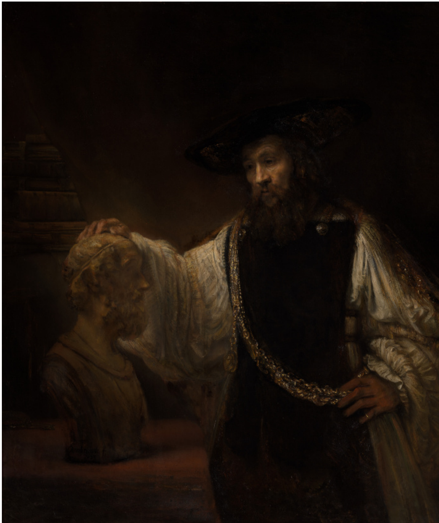
Aristotele con il busto di Omero Rembrandt, 1653.

Per mentalità storicistica Santambrogio si riferisce alla convinzione secondo cui per comprendere un problema di natura filosofica si debbano conoscere, nel modo più dettagliato possibile, tutte le sue vicende storiche, ivi inclusi i punti di vista e le peculiarità degli autori che l'hanno trattata, idealmente conoscendo la lingua originale e riuscendo a utilizzarne i termini in modo il più vicino possibile agli autori nel loro momento storico; quello che, secondo Luciano Canfora, sarebbe «lo studio storico, diacronico del pensiero filosofico incardinato nell'orizzonte storico-politico in cui sorsero e produssero effetti, reazioni, contestazioni