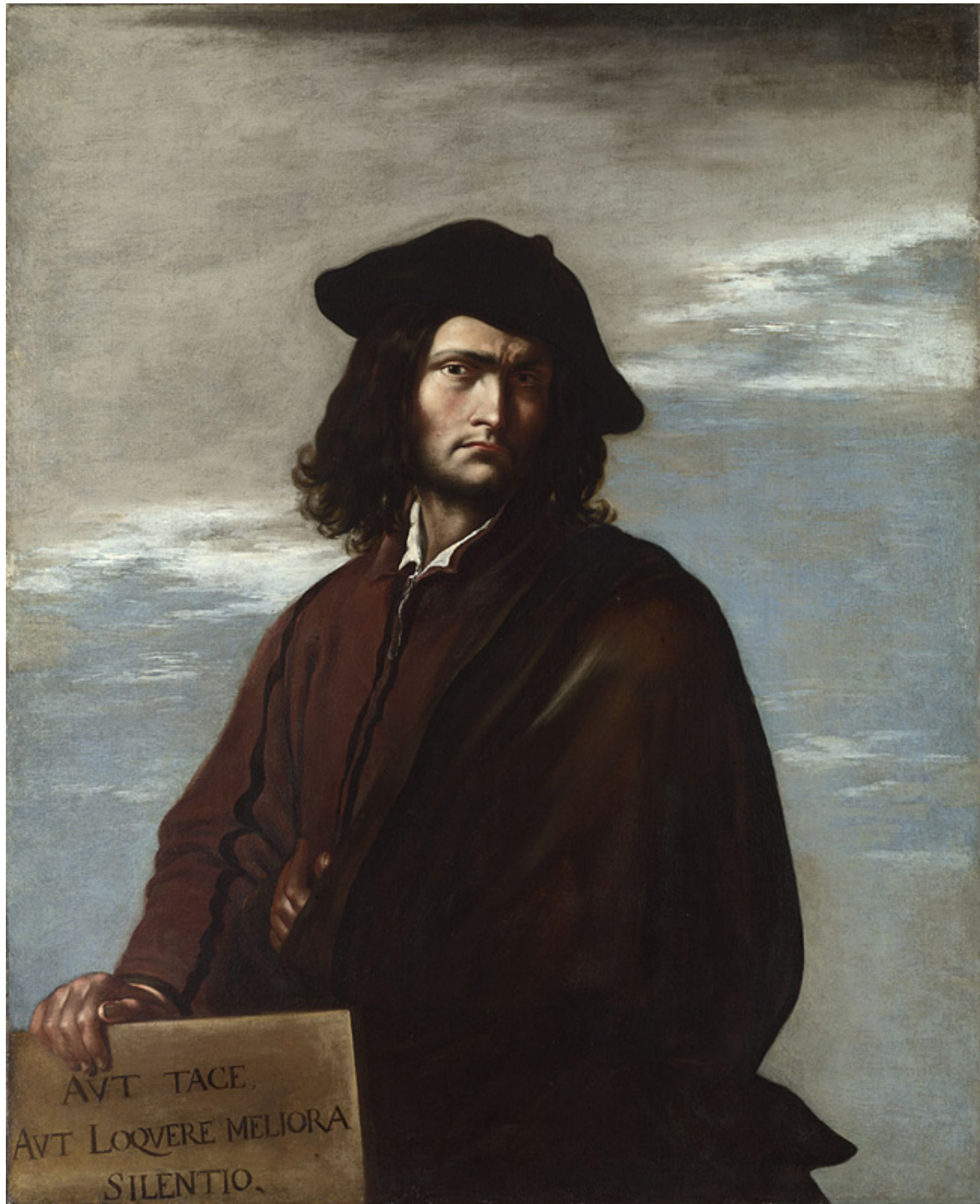
Philosophy, Salvator Rosa (1645) © The National Gallery.

una manciata di neve. La visione storicista induce al nanismo intellettuale come si sente ripetere sempre nella citazione di Bernardo di Chartres (spesso attribuita a Isaac Newton per via di una lettera dove probabilmente ironizzava sull'altezza del suo avversario Robert Hooke): «siamo nani sulle spalle dei giganti». Ma perché?