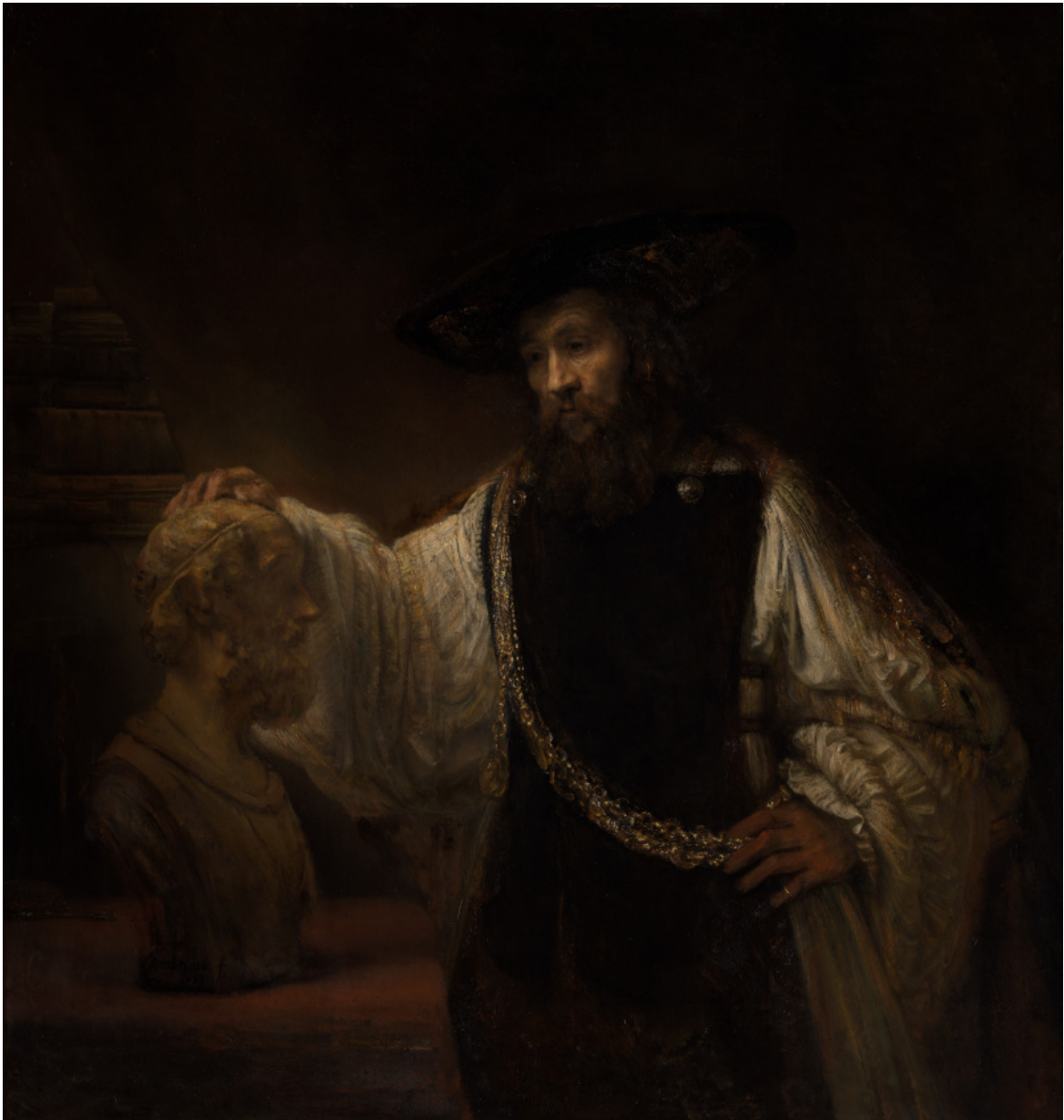
Aristotele con il busto di Omero Rembrandt, 1653.

Per mentalità storicistica Santambrogio si riferisce alla convinzione secondo cui per comprendere un problema di natura filosofica si debbano conoscere, nel modo più dettagliato possibile, tutte le sue vicende storiche, ivi inclusi i punti di vista e le peculiarità degli autori che l'hanno trattata, idealmente conoscendo la lingua originale e riuscendo a utilizzarne i termini in modo il più vicino possibile agli autori nel loro momento storico; quello che, secondo Luciano Canfora, sarebbe «lo studio storico, diacronico del pensiero filosofico incardinato nell'orizzonte storico-politico in cui sorsero e produssero effetti, reazioni, contestazioni e passi in avanti della conoscenza». Il problema è che, come fa notare Santambrogio, se così fosse, sarebbe impossibile comprendere qualsiasi idea. Nessuno ha le risorse e il tempo per ricostruire il clima culturale, la competenza semantica e la scorrevolezza linguistica di un greco dell'Atene di Pericle. Sicuramente questo tipo di competenza è indispensabile per una