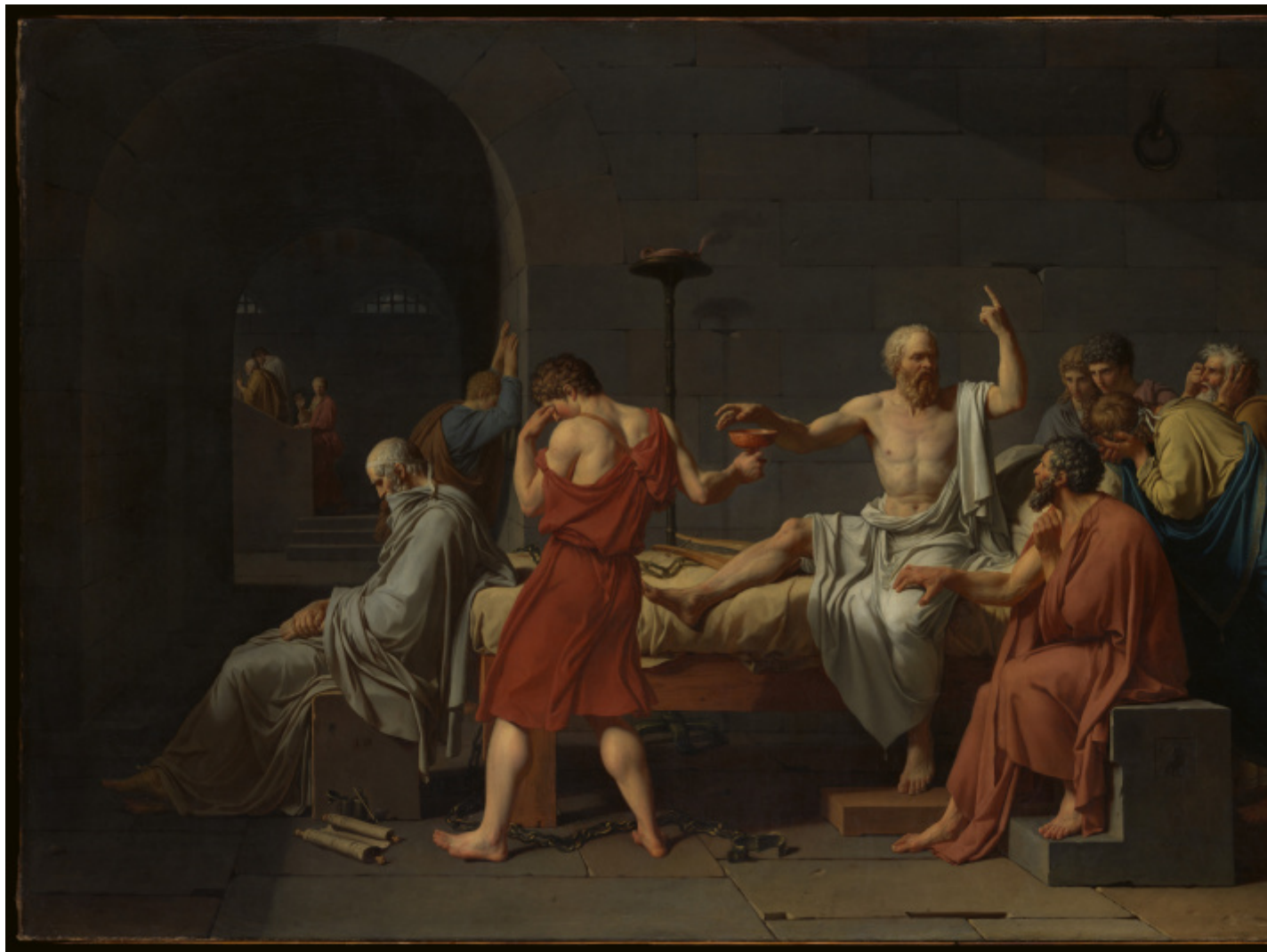
The Death of Socrates Jacques Louis David.