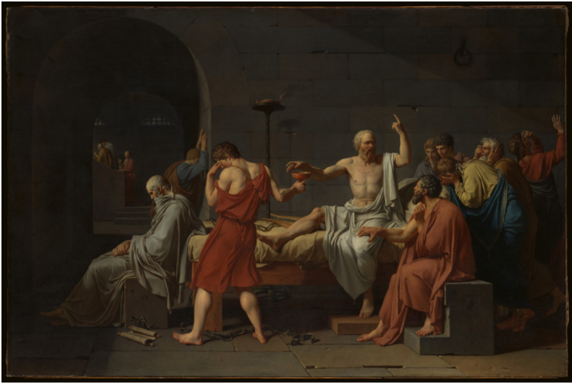
The Death of Socrates Jacques Louis David.