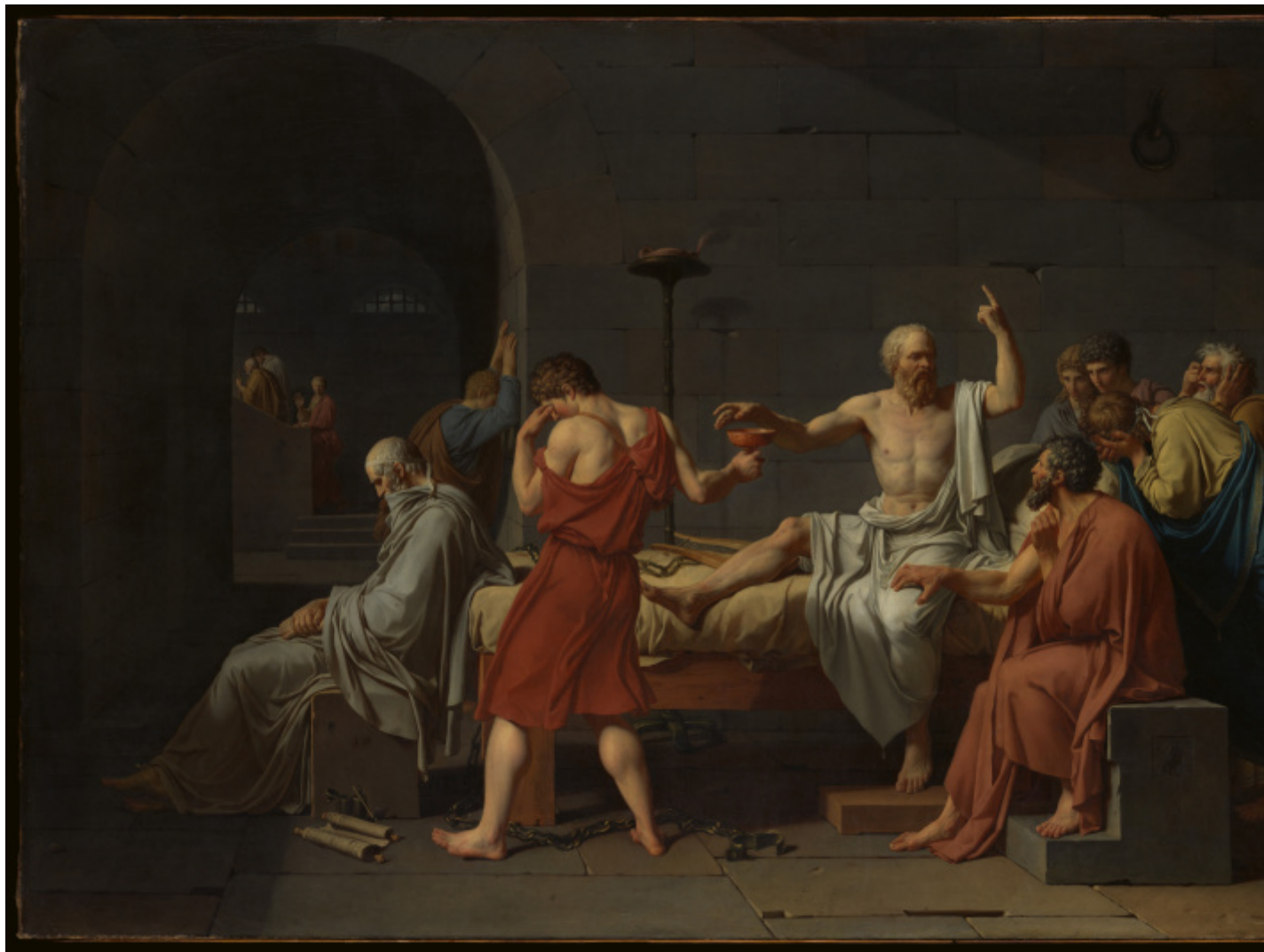
The Death of Socrates Jacques Louis David.

C'è una evidente circolarità tra l'atteggiamento storicistico e l'importanza di certe nozioni: le origini storiche di un'idea sono importanti soprattutto nella misura in cui si interagisce con persone che si attendono quel tipo di conoscenza. In altri ambiti, questo valore è molto meno evidente. Anche l'idea ricorrente secondo cui la storia consentirebbe di evitare di ripeterla è contraddetta dai fatti. Non c'è alcuna evidenza che le culture intrise di storicismo siano capaci di muoversi con infallibile certezza e originalità verso un futuro non macchiato dagli errori del passato. Come nota Santambrogio, «lo storicismo vorrebbe costringerci a cantare nel coro, a essere tutti conformisti. Se ci lascia la possibilità di pensare diversamente dalla maggioranza, si tratta comunque di una libertà limitata: spetta pur sempre alla maggioranza stabilire l'orizzonte entro cui dobbiamo muoverci». E questo è tanto più vero nel caso della filosofia.