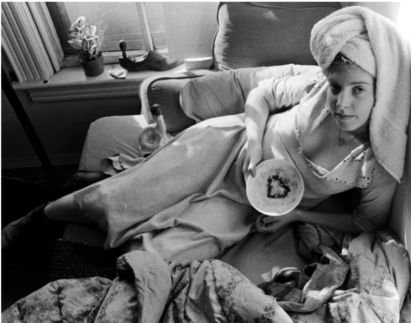
Francesca Woodman

"La storia non è nell'immagine, ma nel rapporto con l'immagine, in ciò che deposita in noi. Inseguo una storia che non esiste. Si parla spesso di un'immagine mancante. Ma qui si tratta di una storia mancante, di un buco."