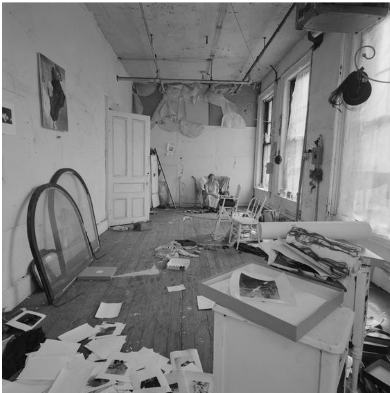
Francesca Woodman Studio by Douglas Prince.