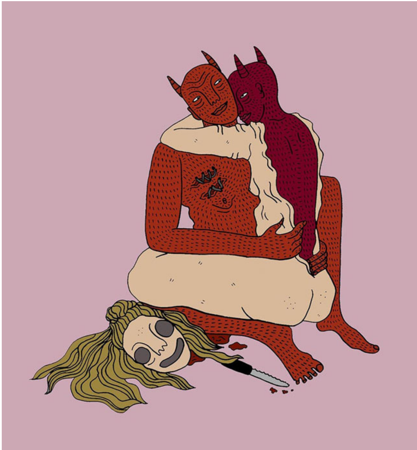
Nine, © Polly Nor 2017.

“Provo per la dama dell’anemone una singolare attrazione sessuale. Sento in me un elemento maschile che, ogni qualvolta penso a lei, affiora a offuscare tutti gli altri. Perché non sono un uomo? – Dico alla sabbia e all’aridità con un certo intenso ardore – così da poter offrire a questa donna meravigliosa, preziosa, incantevole un amore assolutamente perfetto”.