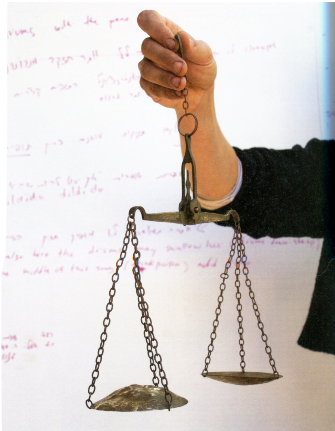
Sigalit Landau, Scales of Injustice , 1997, bronzo, readymade manipolato.

In un saggio del 2012 sul 'contratto civile della fotografia', la studiosa israeliana Ariella Azoulay, autrice tra l'altro di Atto di Stato. Palestina-Israele, 1967-2007. Storia fotografica dell'occupazione (Bruno Mondadori, 2008) cita Edouard Glissant che cita Gilles Deleuze, dicendo: "Funzione della letteratura e dell'arte è inventare un popolo che manca". Ecco, nelle pagine di Gaza quel popolo continua a mancare, miticamente evocato solo come oggetto della frustrazione e dell'ira dell'accecato Sansone. Mi si dirà che gli interrogativi di Lerner, che nel corso del libro si riconosce più volte il ruolo disagevole dell'"ebreo buono", sono altri, che il