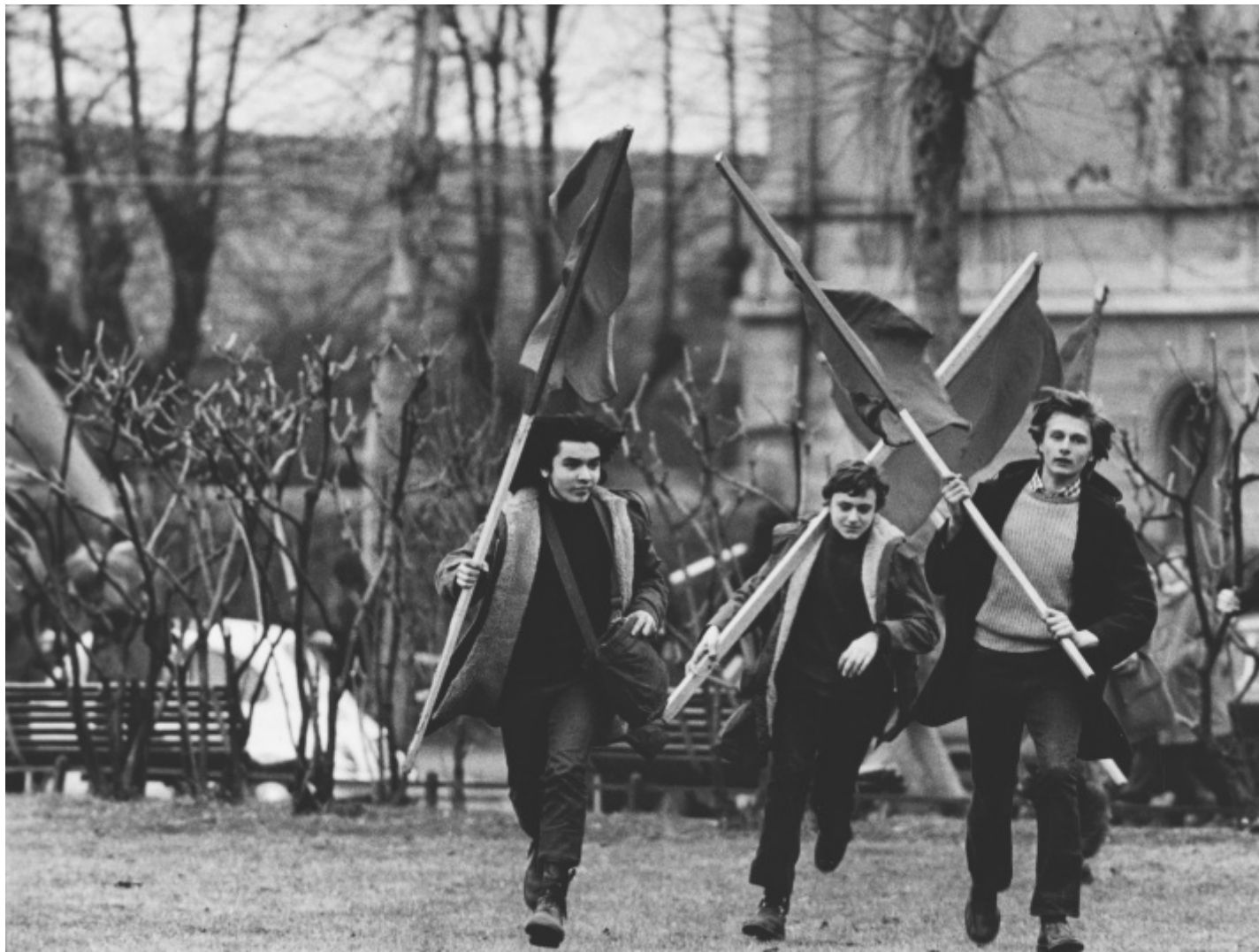
Uliano Lucas, Piazzale Accursio, Milano, 1971.