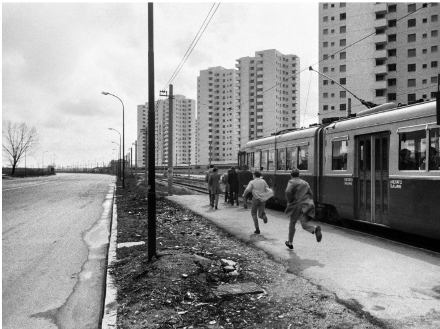
Uliano Lucas, Quartiere Gratosoglio, Milano, 1971.

Uliano Lucas, Assalto all'università Statale occupata dagli studenti, Milano, 24 novembre 1971.