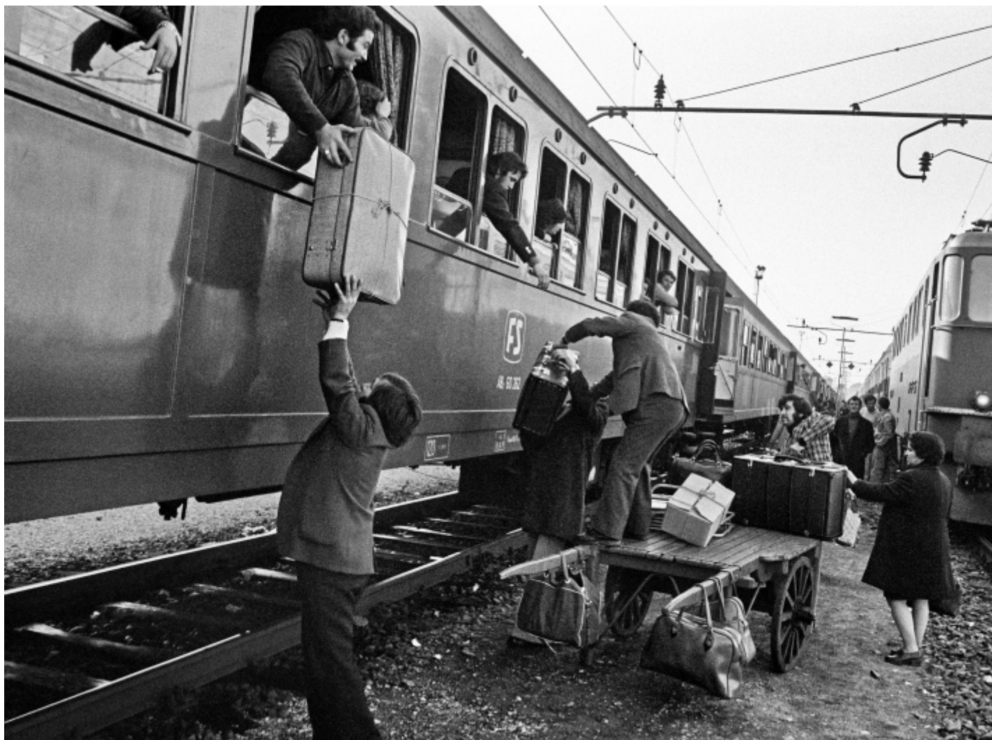
Uliano Lucas, Il trasbordo degli emigrati al confine italo-svizzero, Luino, 23 dicembre 1974.

Uliano Lucas, Immigrato sardo davanti al grattacielo Pirelli, Milano, 1968.