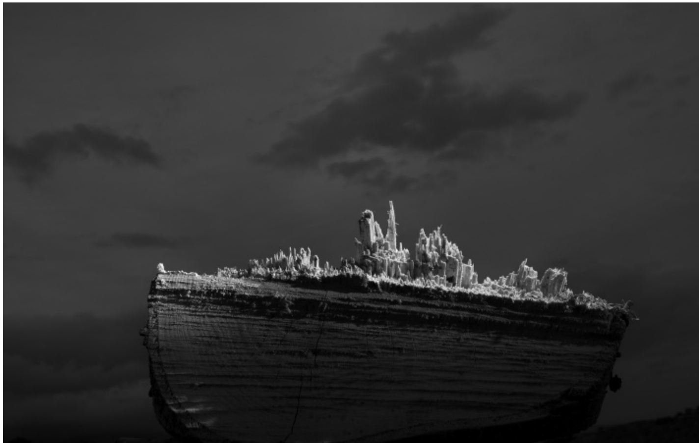
Corpo ligneo 2021 © Antonio Biasiucci.

La mostra, che presenta circa 250 fotografie, ben evidenzia la linea di congiunzione che tiene insieme e lega ogni singolo lavoro di Antonio Biasiucci: non solo per motivi formali – una predilezione chiara e motivata per l’uso del nero è il dettaglio che può saltare più facilmente agli occhi – ma anche per la scelta di quei temi che, come lui stesso afferma, tendono a “riscrivere la storia degli uomini” e che lo spingono a confrontarsi “con soggetti a essa essenziali [...]”. Un’utopia, quella di Biasiucci, che segue però tappe precise senza deviazioni, passando in rassegna davvero le manifestazioni fisiche degli archetipi dell’uomo: il pane, il latte e l’animale che lo genera, la vacca, il magma vulcanico, per citare qualche esempio, sono le fondamenta, il DNA dell’organismo e della nostra mitologia millenaria.