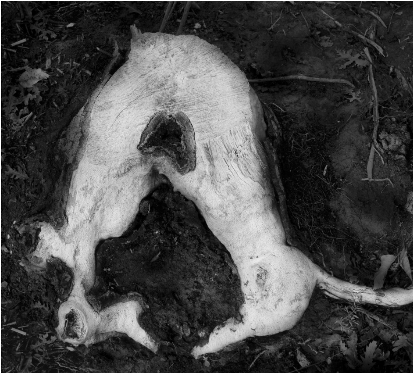
Ghenos 2017 © Antonio Biasiucci.

E l’uomo, sebbene posto come fine di questo ritratto a tappe della sua intera storia, negli scatti di Biasiucci compare poco: in “The Dream” (2016), lavoro svolto nel campo profughi di Souda, in cui volti, mani e piedi si fanno portavoce, sebbene qui i piedi siano fermi e non camminino, le mani non afferrino nulla, gli occhi di tutti siano chiusi, dell’esodo inesausto dei popoli in fuga. Così la lotta per la vita, incarnata da chi fugge verso nuove realtà, si ritrova anche nello spasimo del neonato, nel suo dimenarsi per uscire alla luce nel momento del parto, come in quello fotografato da Biasiucci nell’ospedale di Matany, nel 2015. Il desiderio di vita è espresso nei lavori in mostra senza mai toccare esplicitamente il tema dell’Eros, a cui pure siamo freudianamente abituati a collegare il primario impulso di perpetrare noi stessi.