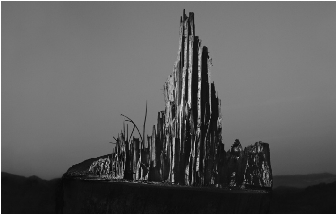
Corpo ligneo 2021.

l'occhio in cui, e grazie a cui, può compiersi la congiunzione perfetta tra le forme nel tempo.