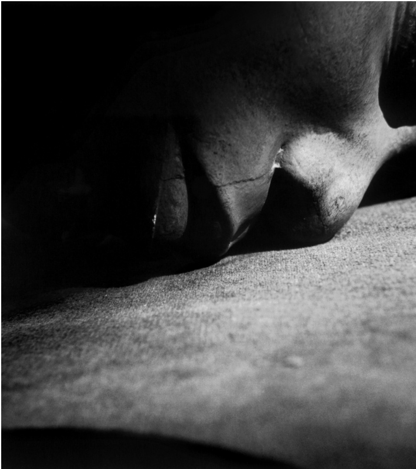
Res 1999 © Antonio Biasiucci.

che costruiremo le piramidi, non importa se poi non le costruiremo.” L’invito che ci lancia Antonio Biasiucci è questo, con un grido: costruite. Là dove in apparenza non c’è nulla di nuovo, si nasconde una Piramide, Babilonia; sotto i metri di acqua del diluvio c’è la terra, un mondo futuro.