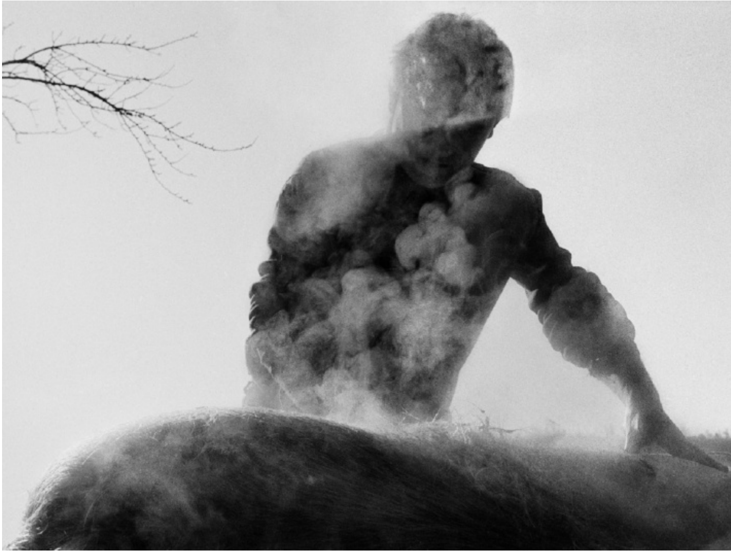
Vapori. Il rito dell’uccisione del maiale 1983-1987