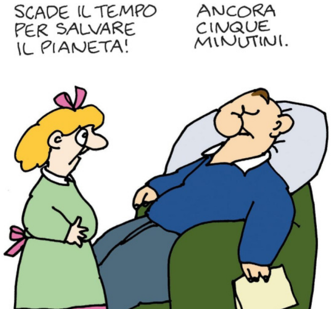
Vignetta (bimba), 2021, l'Espresso.

Eppure queste frasi, aforismi taglienti o legnosi che siano, sono qualcosa di preciso, d'esatto. A loro modo di perfetto. Somigliano a quelle frasi che a volte si leggono nei gabinetti pubblici – o almeno una volta si leggevano lì, perché solo in quei luoghi qualcuno, uno sconosciuto o una sconosciuta, provava a dire la verità, a scriverla, nevrotica, paranoica o delatoria che fosse.