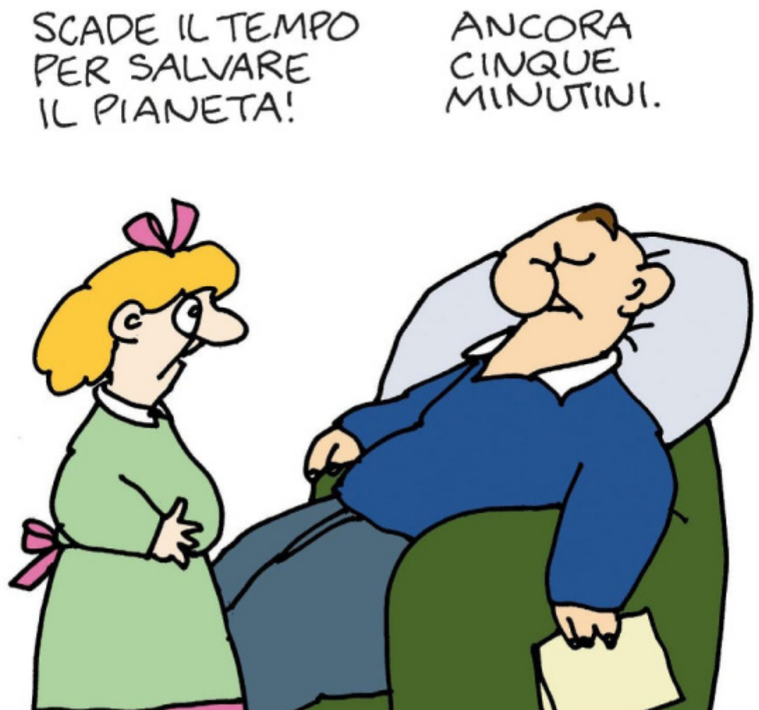
Vignetta (bimba), 2021, l'Espresso.

Eppure queste frasi, aforismi taglienti o legnosi che siano, sono qualcosa di preciso, d'esatto. A loro modo di perfetto. Somigliano a quelle frasi che a volte si leggono nei gabinetti pubblici – o almeno una volta si leggevano lì, perché solo in quei luoghi qualcuno, uno sconosciuto o una sconosciuta, provava a dire la verità, a scriverla, nevrotica, paranoica o delatoria che fosse.