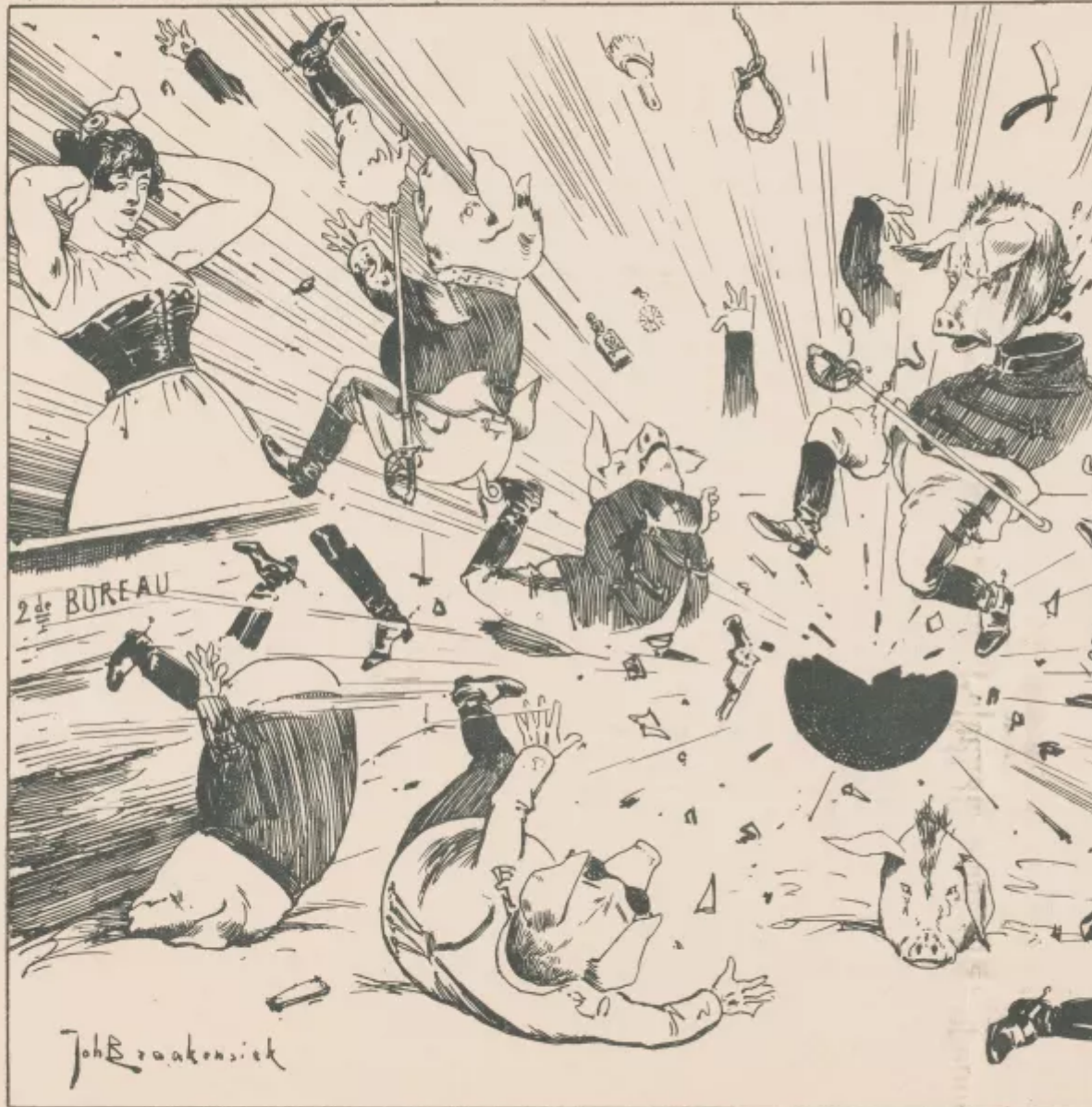
Het barsten van de Revisie-bom.

BIJVOEGSEL van de Amsterdamer, Weekblad voor Nederland, van 4 Juni 1899