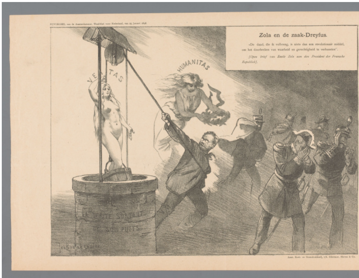
Zola e il caso Dreyfus, Johan Braakensiek, 1898.

Tuttavia alla fine del percorso – e il libro di Clotilde Bertoni lo mette in evidenza a più riprese – si ristabiliscono i rapporti di forza. Con il progressivo affievolirsi degli entusiasmi, il caso giudiziario esce dall’agenda dei cronisti per diventare materia esclusiva di memorie e rielaborazioni artistiche. Ad assumere particolare rilievo nei nuovi scenari del primo Novecento è il destino degli intellettuali, che vengono “estromessi dalla prima linea”, e sono costretti a osservare da spettatori gli scontri parlamentari incentrati sul futuro della collettività. Le loro iniziative “di idealità e giustizia” diventano potenzialmente minacciose per la stabilità del paese, specialmente se interpretate in maniera radicale. Pur essendo colpita da critiche aspre, la società borghese e liberale resiste agli scossoni. L’esercito mantiene intatto il suo prestigio. La ricerca della verità, talvolta corredata da atteggiamenti di grande coraggio, lascia spazio alla politica dei compromessi. E gli scrittori sono costretti a cercare altre cause alle quali dedicare il loro impegno.