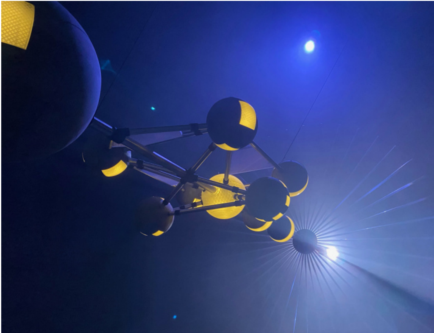
Yael Bartana, Light to the Nations .

intravede, su uno schermo, una gigantesca e futuristica nave spaziale... È la stessa navicella fluttuante nella sala successiva del padiglione. Ideata da Yael Bartana e ispirata alla cabala ebraica, Light to the Nations salverà l'umanità dalla distruzione del pianeta per sua stessa mano. Al di là della sovrapposizione tra dottrina mistica e tecnologia futuristica, la sospensione della nave nel buio, attraversato da fasci di luce, compensa la discrepanza nel rapporto di scala tra osservatore e oggetto. L'interno della nave può essere osservato sdraiati sotto uno schermo a forma di cupola collocato in un terzo ambiente: qui a rendere immersiva l'esperienza contribuiscono la dimensione e la forma avvolgente dell'immagine (realizzata in realtà virtuale) e la particolare posizione dello spettatore.