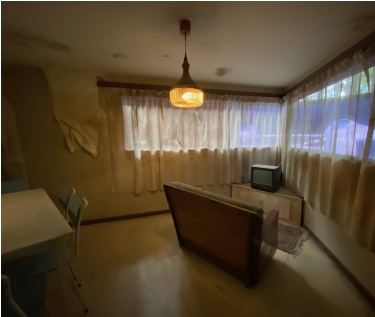
Ersan Mondtag, Monument eines unbekanntes Menschen.

persino più concreta di quella offerta dal cinema. Ma in questo periodo può bastare anche un tuffo alla 60° Esposizione Internazionale d'Arte di Venezia , dove la proposta di alcuni paesi sembra offrire interessanti esperienze immersive. Scelgo tre padiglioni: Germania, Gran Bretagna, Italia, significativamente tre paesi occidentali in un anno in cui il tema generale è “Stranieri ovunque”.