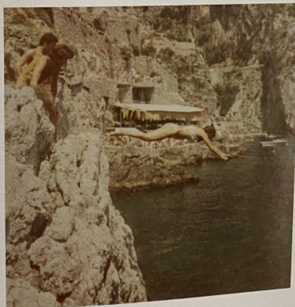
Con amici alla Praia, Costiera Amalfitana.