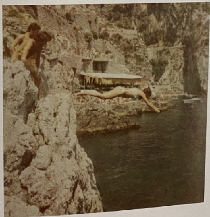
Con amici alla Praia, Costiera Amalfitana.