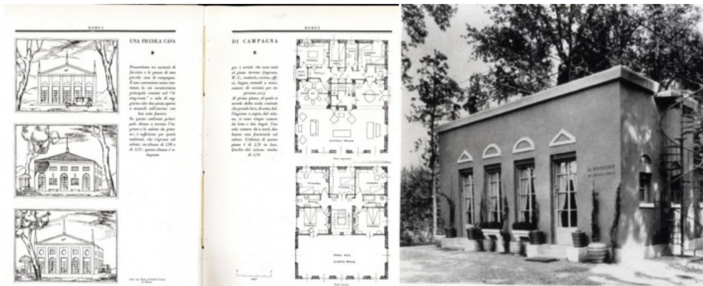
Gio Ponti ed Emilio Lancia, Una piccola casa di campagna . Domus 25 (gennaio 1930), 46-47. Gio Ponti ed Emilio Lancia, Domus nova , Casa per vacanze, nel Parco di Monza, costruita in occasione della IV Triennale, 1930.

Ciò che, tuttavia, a mio avviso, accomuna nella sostanza profonda i due maestri milanesi, è il fatto che entrambi sono eredi della vis classica (non neoclassica, il neoclassicismo formale di Ponti è conclamato, ma è, appunto, soltanto ‘formale’). La vis classica che li accomuna presiede, invece, ab imo pectore al loro fare architettonico. Infatti, pur nelle evidenti differenze linguistiche e compositive, e nella loro diversa scuola di pensiero, i loro manufatti architettonici sono tutti, indistintamente e sempre, classici in nuce . E non già per la loro destinazione d’uso o per le loro forme, ma perché essi sono tutti oggetti architettonici singolari e irripetibili, monumentali, insomma, tal quali lo furono quelli edificati nella Grecia antica, nella Roma repubblicana e imperiale e nel Rinascimento. La vis classica di Ponti e di Rossi risiede proprio in questa unicità monumentale delle loro architetture. Così come gli edifici classici, pur nella propria aderenza ad una tipologia prestabilita, furono ciascuno singolare e irripetuto, anche le architetture di Ponti e di Rossi emergono dal tessuto urbano, sempre riconoscibili e inconfondibilmente attribuibili al loro autore, magniloquenti anche quando sono in sordina.